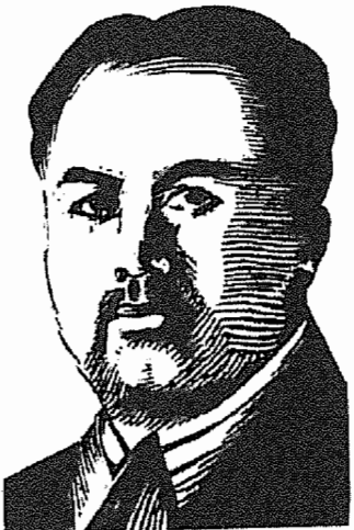
طرح: مرتضی ممیز از مجله کلک

کریه دست ظلم و استعمار و دولت از بیان سخن در هانت فرضی یک تا نوع بشر در جنبش است همت و در جنبش زیسانت فرضی رینه های شور استعمار و ا قطع همسایه و بیسانت فرضی چشم بگشا تا بیینی دور بیست از زمان ارمانت فرضی آن سنگارزان که می چشند باز سود خود و در زیانت فرضی دوش میگردند با دند ان نیز چون دونه قند چانت فرضی میکنند امروز گوشتی تاز نو سازه کرده داستان فرضی یک جرخ زندگی هرگز نکند بر خلاف آرمات فرضی مل گنه این جرخ بس شیب و فراز تا جهلان گردد چرات فرضی ملت ایران از جان و دل دوزد میسرستد بر و وانت فرضی