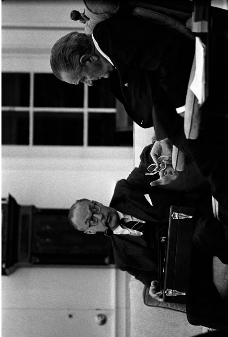
رابرت کومر، مقام بلندپایه سیا و رهبر عملیات فونیکس (نفوذ و ترور انقلابیون)، با جانسون رئیس‌جمهور آمریکا برای راهنمایی مقامات نظامی و اطلاعاتی حکومت پهلوی در فروردین ۱۳۴۲ به شیراز آمد.