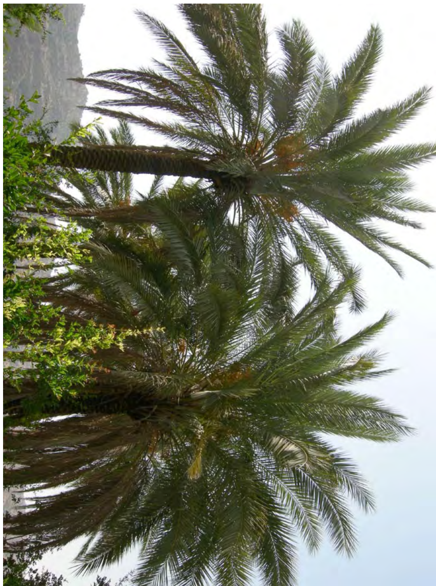
مسقان، گرمسیر کوهمره در متون قرون اولیه اسلامی «مسجان» (مسگان) نامیده شده.