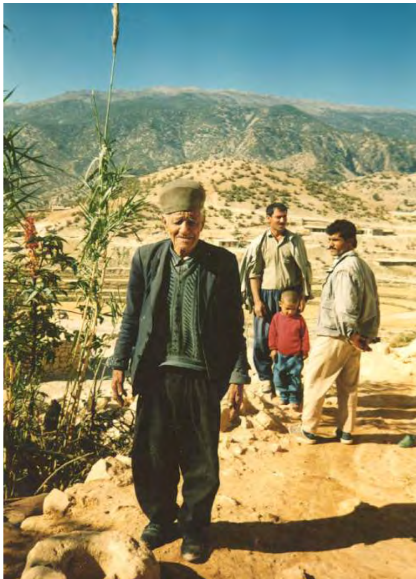
مرحوم حاج باباجان ریش سفید سرشناس طایفه کره بس