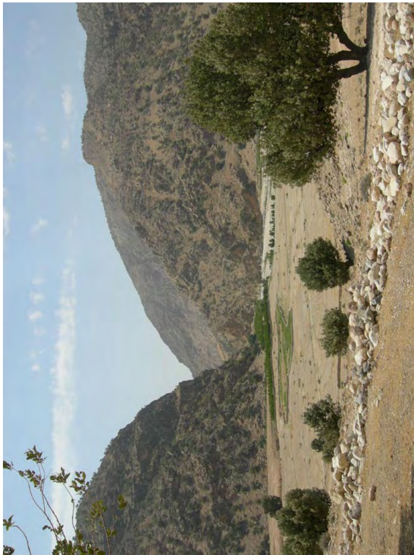
تنگ آب مسقان

مرز کوهمره و بلوک گره (جره)، که در گذشته مسیر انتقال کالا از بنادر بوشهر، به ویژه بندر گناوه، به شیراز بود