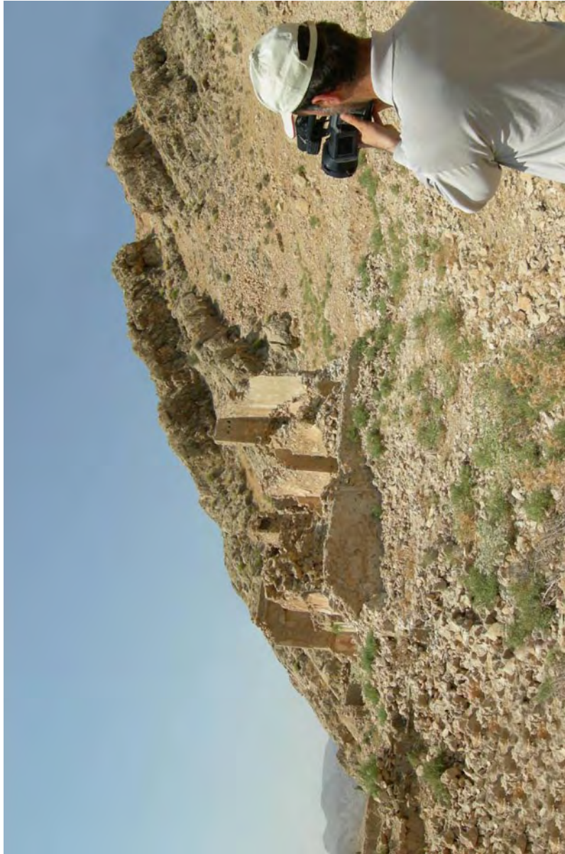
آثار بمباران‌های مسقان در قیام ۱۳۴۱-۱۳۴۲ پدرم