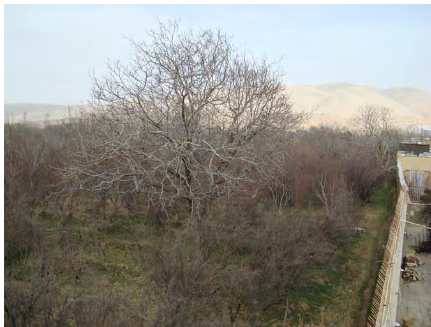
بقایای باغات موقوفه شهر شیراز (شمال بلوار قدوسی غربی) مسعودی در یکی از این باغ‌ها، به مساحت شش هکتار، «برج سازی» می‌کند. شیرمردی نیز مایل است «انبوه ساز» شود!

منظور وی از آن «دستگاه دولتی»، که سی تا چهل هزار هکتار «اراضی موقوفه» را تصرف کرده، اداره کل منابع طبیعی فارس است!