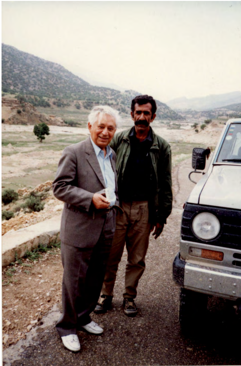
بزرگ علوی و مردی از طایفه بککی کوهمره سُرخ‌ی در غرب جنگل بلوط‌دان بهار ۱۳۷۱