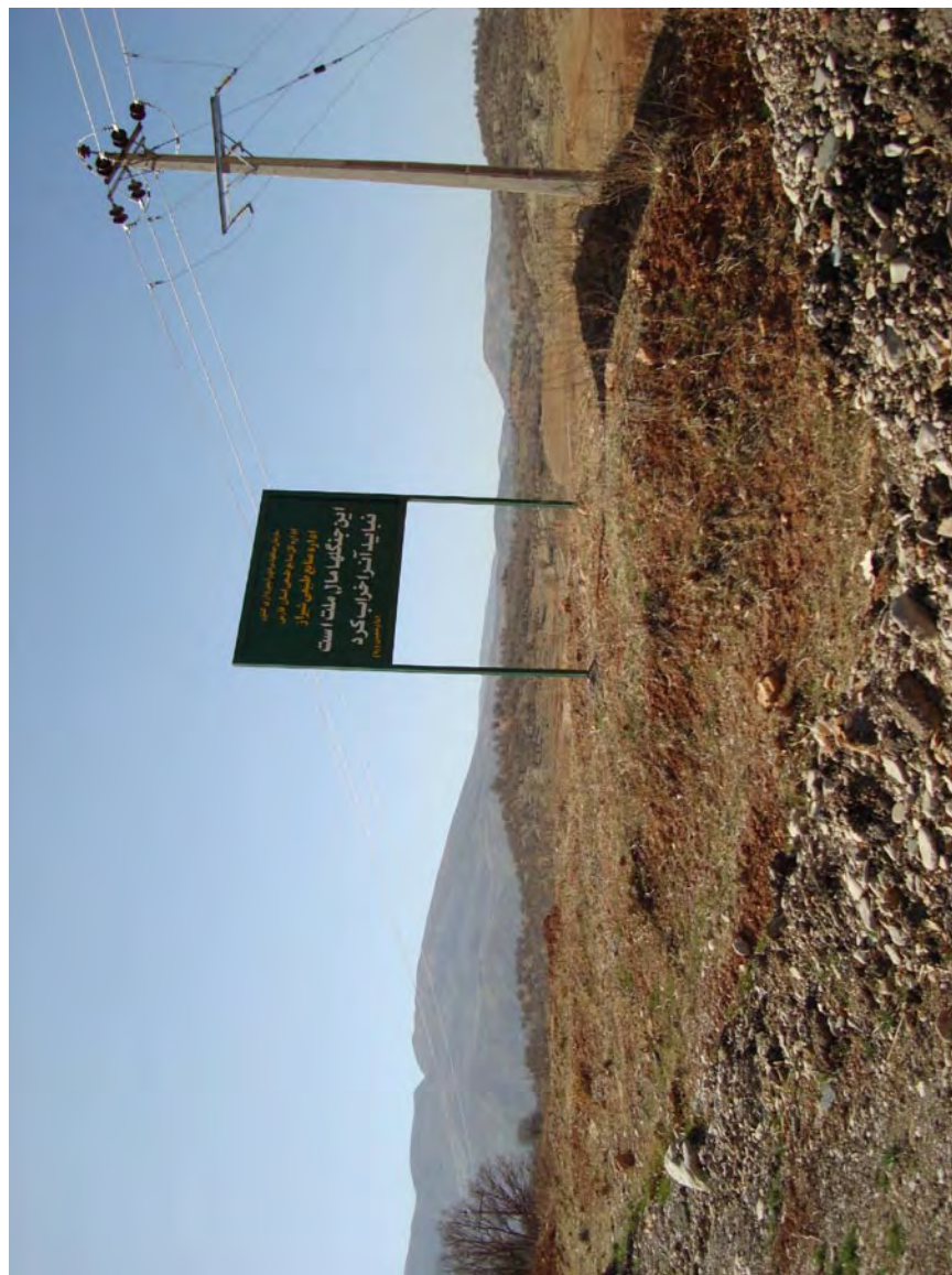
غرب جنگل بلوودان، جنگلی که پدرم عاشقانه حفاظت و قرق کرد. تابلوی اداره منابع طبیعی شیراز: «این جنگلها مال ملت است. نباید آن را خراب کرد.» به تصاویر صفحات بعد بنگرید.