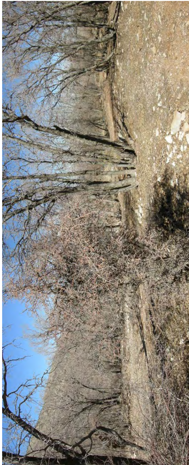
انبوهی درختان بلوط در جنگل بلوطدان عکس در زمستان گرفته شده و درختان بلوط سبز نیست.