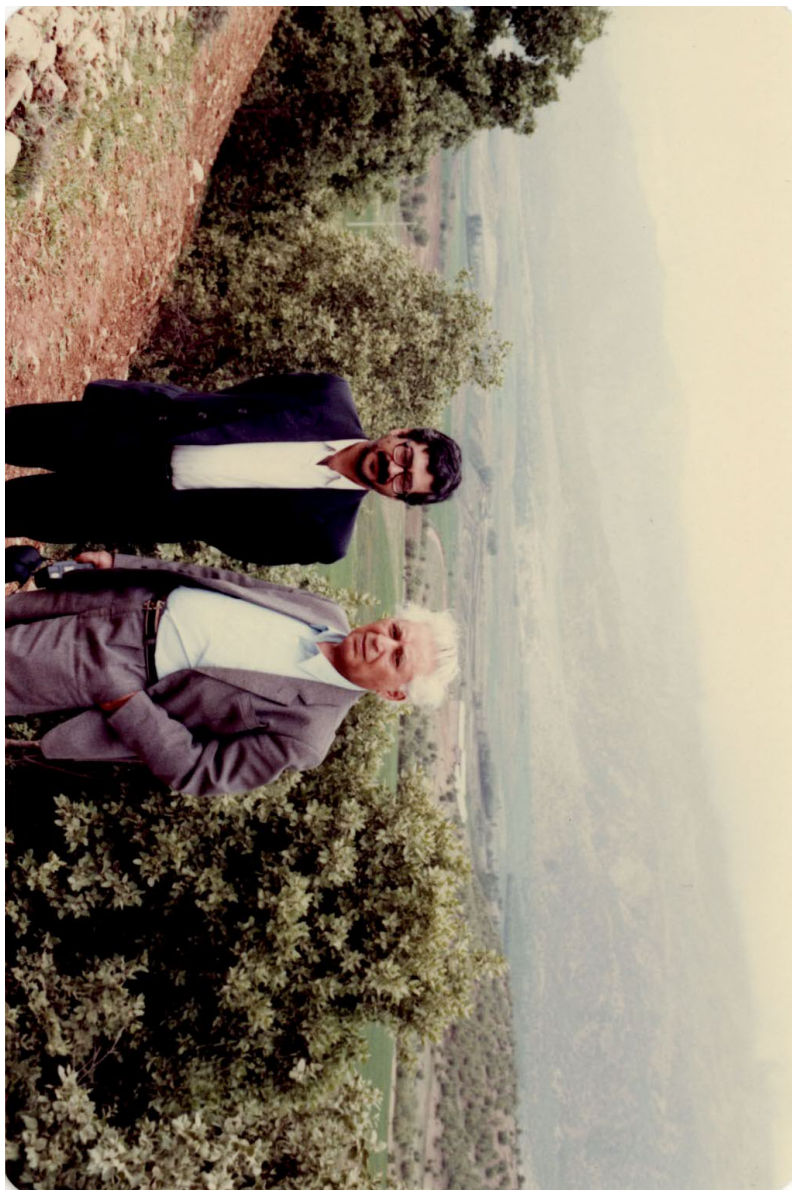
من و بزرگ علوی در چنارفاریاب (غرب جنگل بلوطدان) بهار ۱۳۷۱