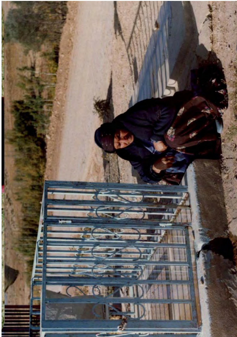
مادری از طایفه سقلمه‌چی بر گور پسر شهیدش در جنگ تحمیلی ۱۶ آبان ۱۳۷۰