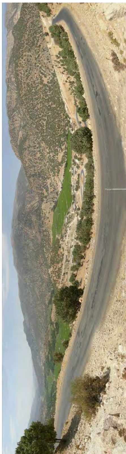
نمای کوه مروک (محل زندگی طایفه بککی) از گردنه کره بس کوهمره سُرخ