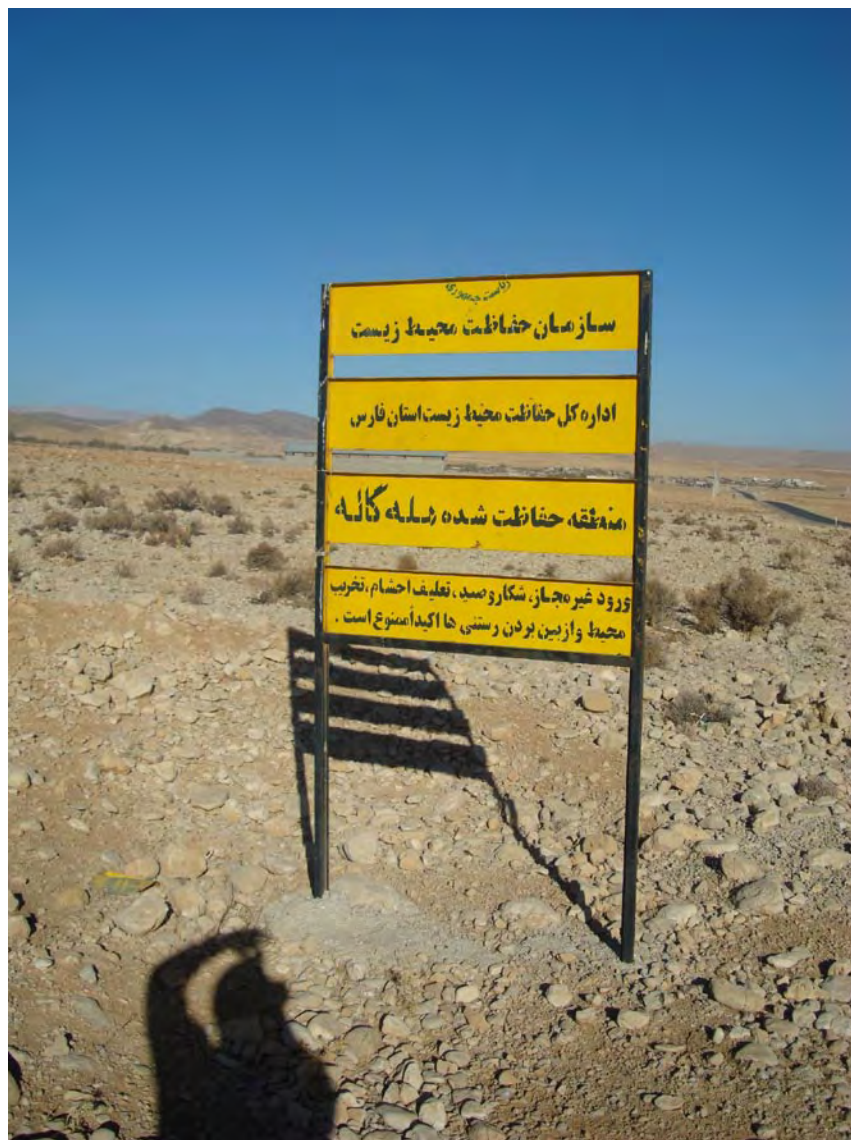
تابلوی سازمان محیط زیست در آغاز مراتع محل فعالیت شرکت احرار در کوهپایه دلو منطقه حفاظت شده مله گاله