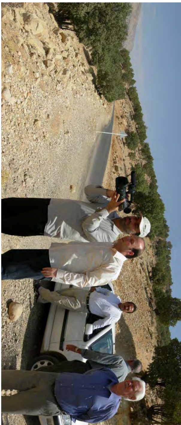
غرب جنگل بلوطدان