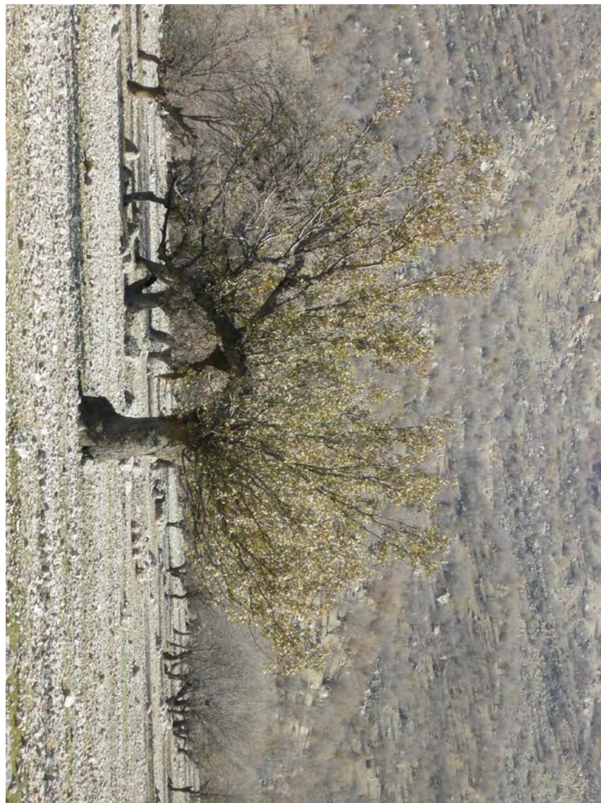
درخت کهن سال بلوط در جنگل های کوهمره سُرخ عکس در زمستان گرفته شده و درختان بلوط سبز نیست.