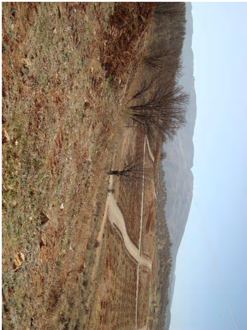
غرب جنگل بلوطدان، کمی پس از همان تابلو