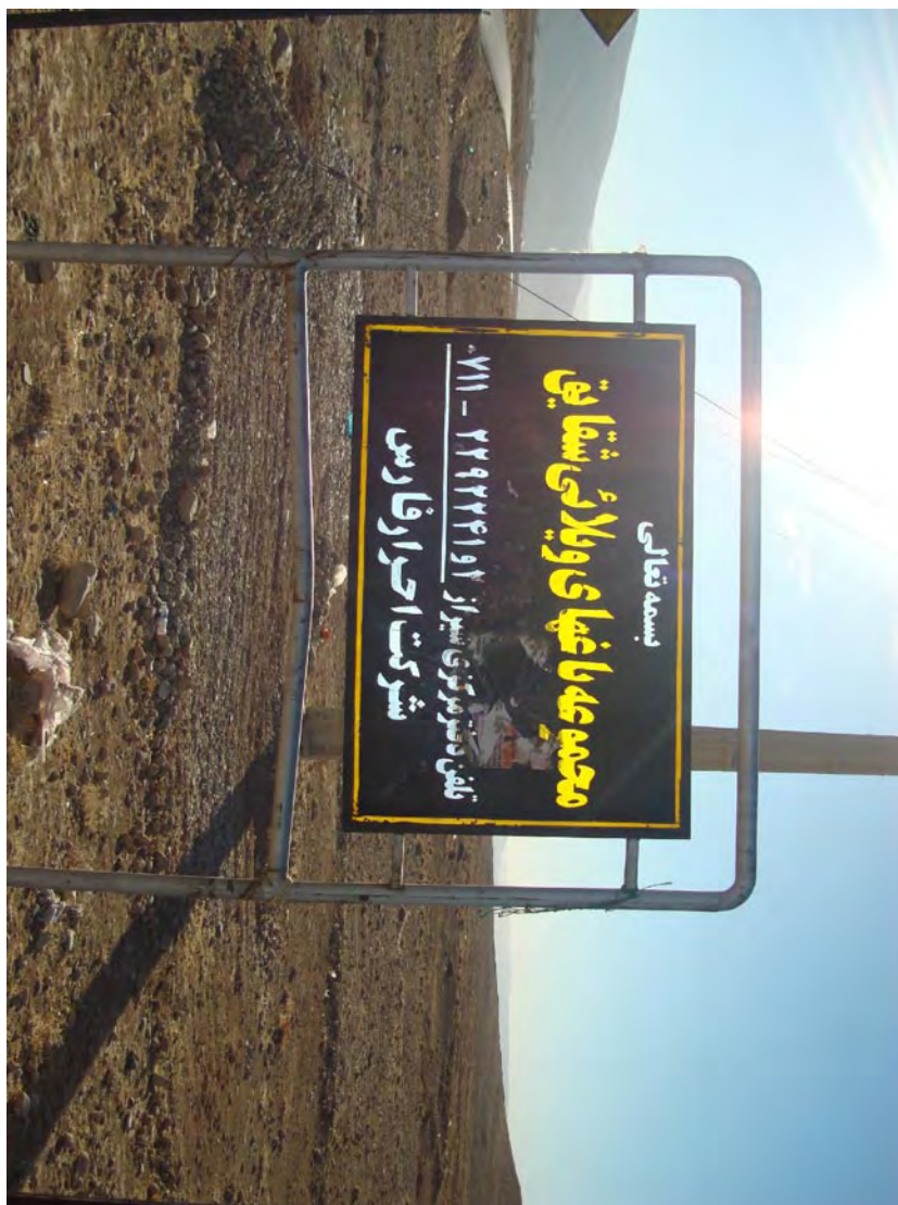
تابلوی مجتمعی شقایق (مراغه کوهپایه دلو) متعلق به شرکت احرار فارس