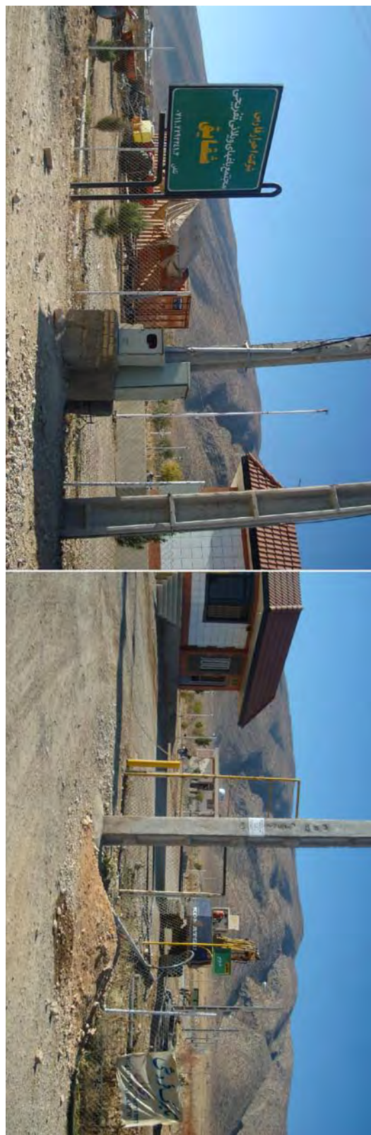
مجمع شقایق (شرکت احرار فارس) در محدوده مراتع حفاظت شده سازمان محیط زیست