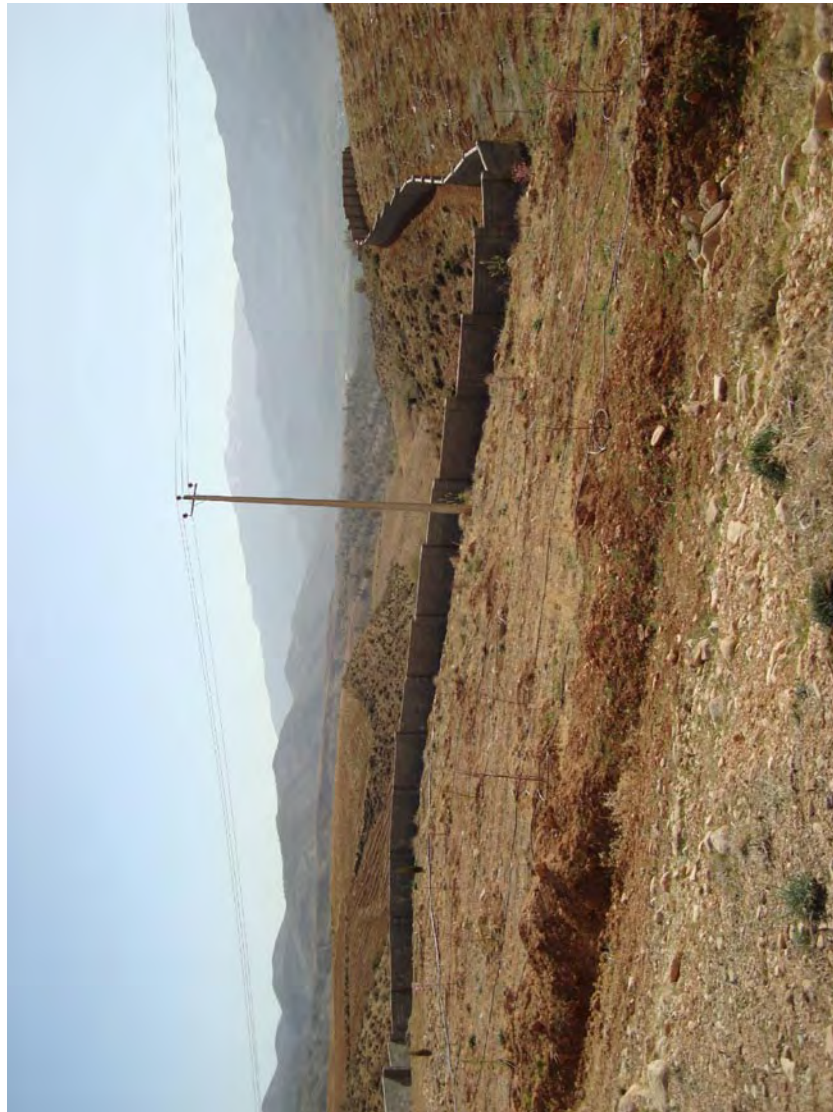
غرب جنگل بلوطدان جنگل های منطقه طایفه سقلمه چی را دیوار کشیده و به «باغ شهر» تبدیل می کنند و می فروشند.