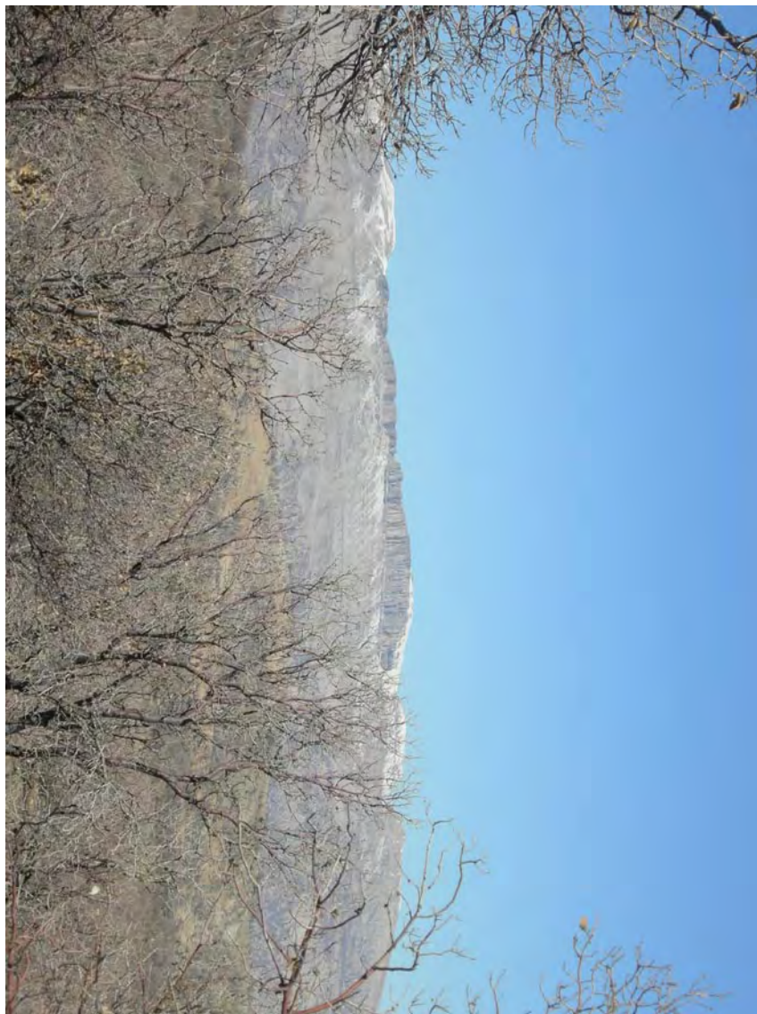
منظره کوه دلو و دیوار تادئنگ (دیوار اعظم) از شرق جنگل بلوطدان عکس در زمستان گرفته شده و درختان بلوط سبز نیست.