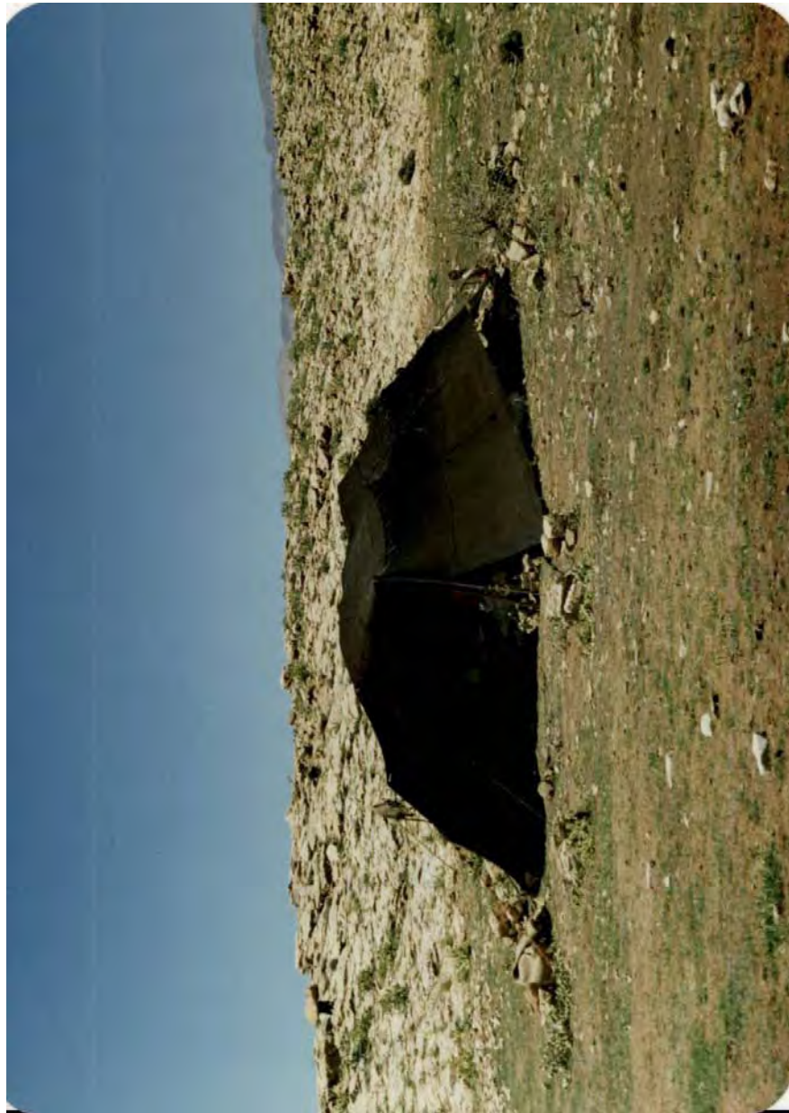
سیاه چادر خانواری از طایفه سقلمه‌چی، عکس از عبدالله شهبازی، ۱۶ آبان ۱۳۷۰