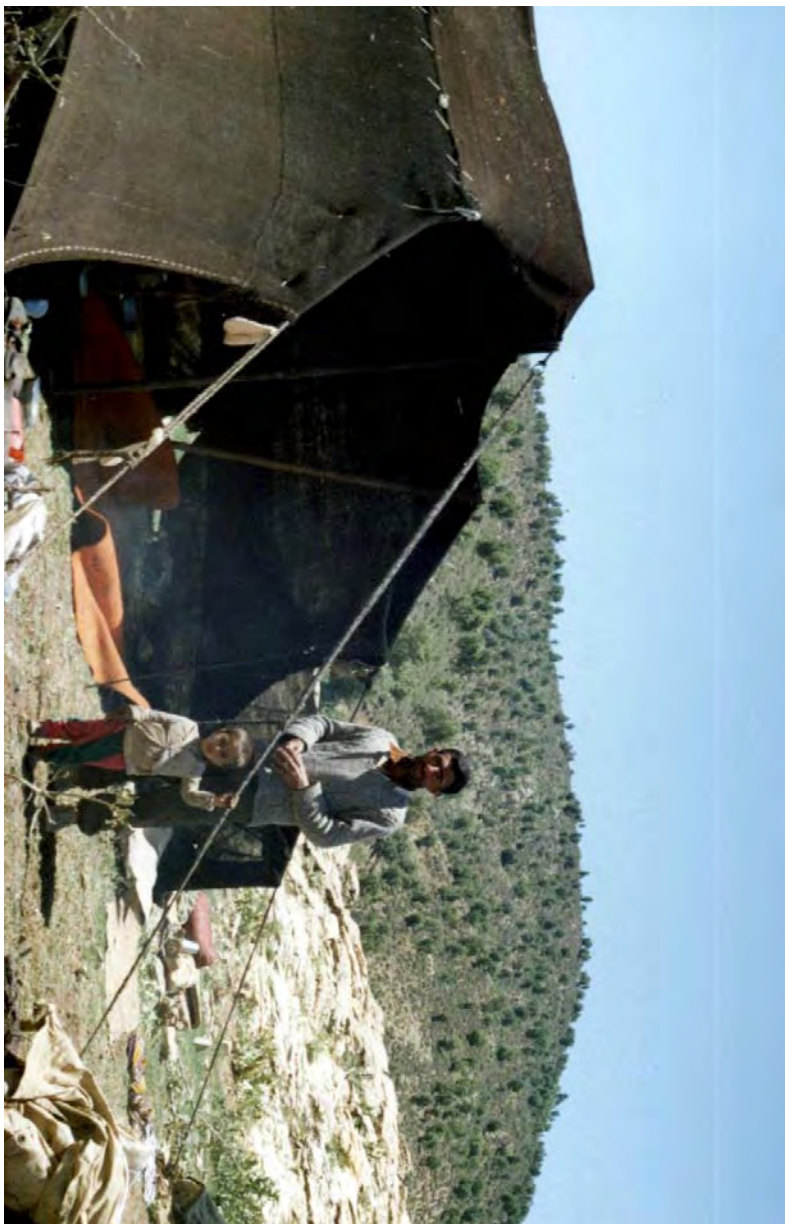
سیاه چادر خانواری از طایفه سقلمه چی، ۱۶ آبان ۱۳۷۰