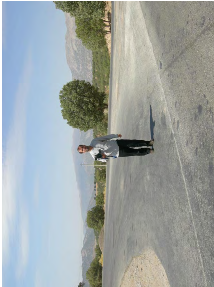
غرب جنگل بلوطدان، آغاز جاده ملا حسینی این جاده در شرق به روستاهای ملا حسینی و چنارک و چشمه بردی، محل استقرار طایفه سقلمه چی، و سرانجام به دارنگان می‌رسد.