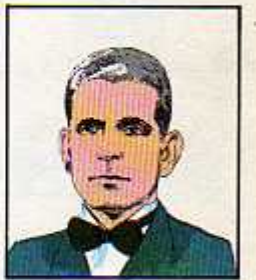
۲۸) سپهبد رزم آرا