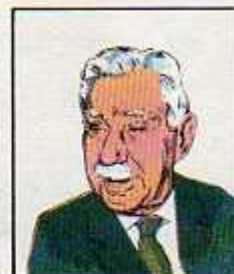
۲۳) محمد ساعد ۸ فروردین ۱۳۲۳ - آذرماه ۱۳۲۳ (سه بار دولت تشکیل داد)، ۲۵ آبان ۱۳۲۷ - فروردین ۱۳۲۹