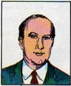
۳۶) حسنعلی منصور

۲۹ اسفند ۱۳۳۰ - اردیبهشت ۱۳۳۱ ۲۳ خرداد ۱۳۳۵ - فروردین ۱۳۳۶