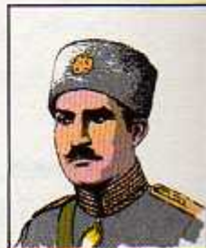
۱۶) سردار سپه (رضا شاه کبیر) ۶ آبان ۱۳۰۲ آذر ۱۳۰۴ (پنج بار دولت تشکیل داد)