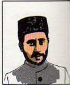
۱۴) سید ضیاءالدین طباطبائی ۳ اسفند ۱۲۹۹ - خرداد ۱۳۰۰ (دو بار دولت تشکیل داد)