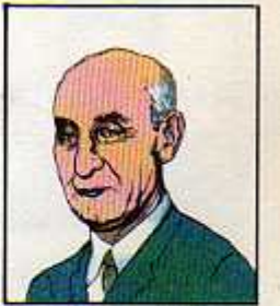
۳۰) دکتر محمد مصدق

۱۲ اردیبهشت ۱۳۳۰ - ۲۵ تیر ۱۳۳۱ ۴ مرداد ۱۳۳۱ - ۲۸ مرداد ۱۳۳۲