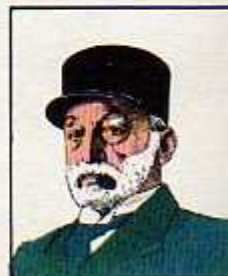
۱۸) مخبر السلطنه ۱۱ خرداد ۱۳۰۶ - شهریور ۱۳۱۲