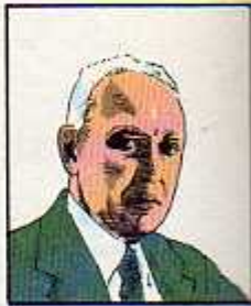
۱۳) وثوق الدوله ۷ شهریور ۱۲۹۵، ۱۵ مرداد ۱۲۹۷ - دیماه ۱۲۹۹ (سه بار دولت تشکیل داد)