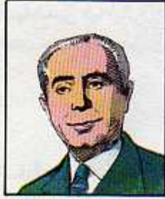
۳۴) دکتر علی امینی