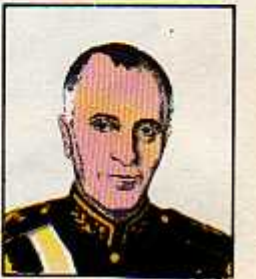
۳۱) سپهبد زاهدی

۲۸ مرداد ۱۳۳۲ - خرداد ۱۳۳۵ (دو بار دولت تشکیل داد)