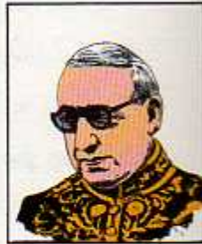
۱۵) قوام السلطنه (احمد قوام) ۱۴ خرداد ۱۳۰۰ - بهمن ماه ۱۳۰۰ (سه بار دولت تشکیل داد) ۱۷ خرداد ۱۳۰۱ - بهمن ۱۳۰۱، ۱۸ مرداد ۱۳۲۱ - بهمن ۱۳۲۱، ۲۵ بهمن ۱۳۲۴ - مرداد ۱۳۲۵، ۱۰ مرداد ۱۳۲۵ - شهریور ۱۳۲۶، ۱۹ شهریور ۱۳۲۶ - دی ماه ۱۳۲۶، ۲۵ تیر ۱۳۳۱ - ۴ مرداد ۱۳۳۱