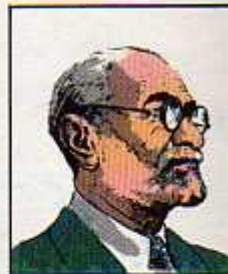
۱۷) محمدعلی فروغی ۲۸ آذر ۱۳۰۴ - تیرماه ۱۳۰۵، ۲۶ شهریور ۱۳۱۲ - آذر ۱۳۱۴، ۵ شهریور ۱۳۲۰ - اسفند ۱۳۲۰