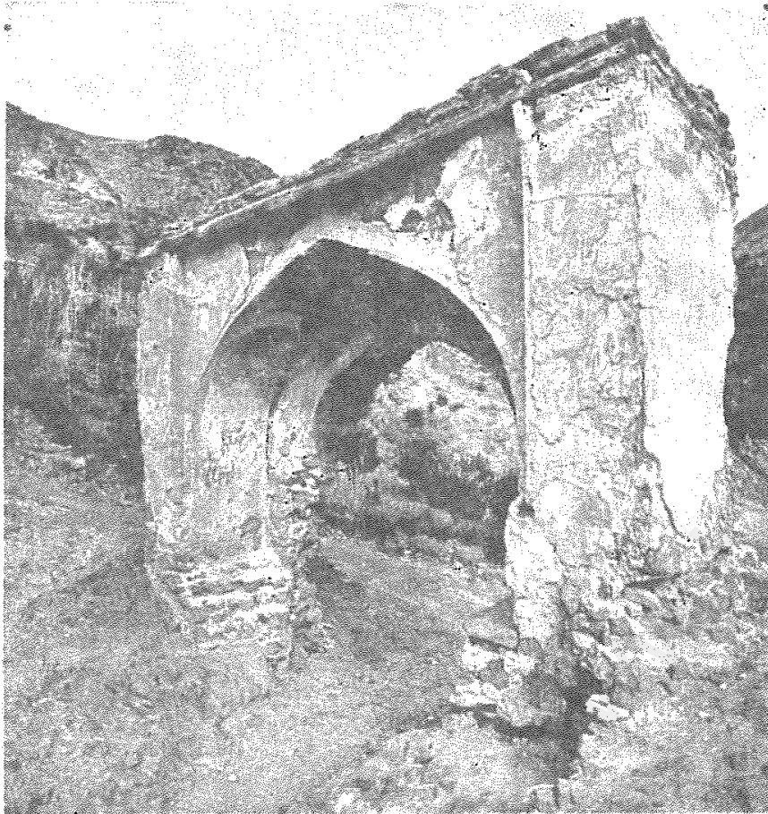
دروازه خرزویل که محل بست مجرمان بوده است