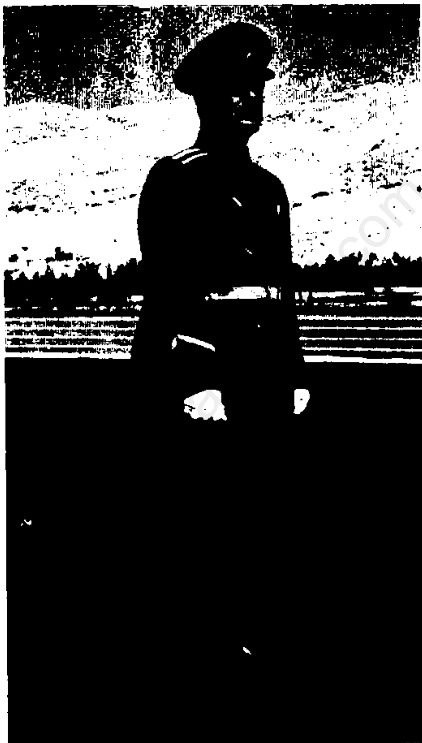
نفر موزیک نیروی هوایی شاهنشاهی