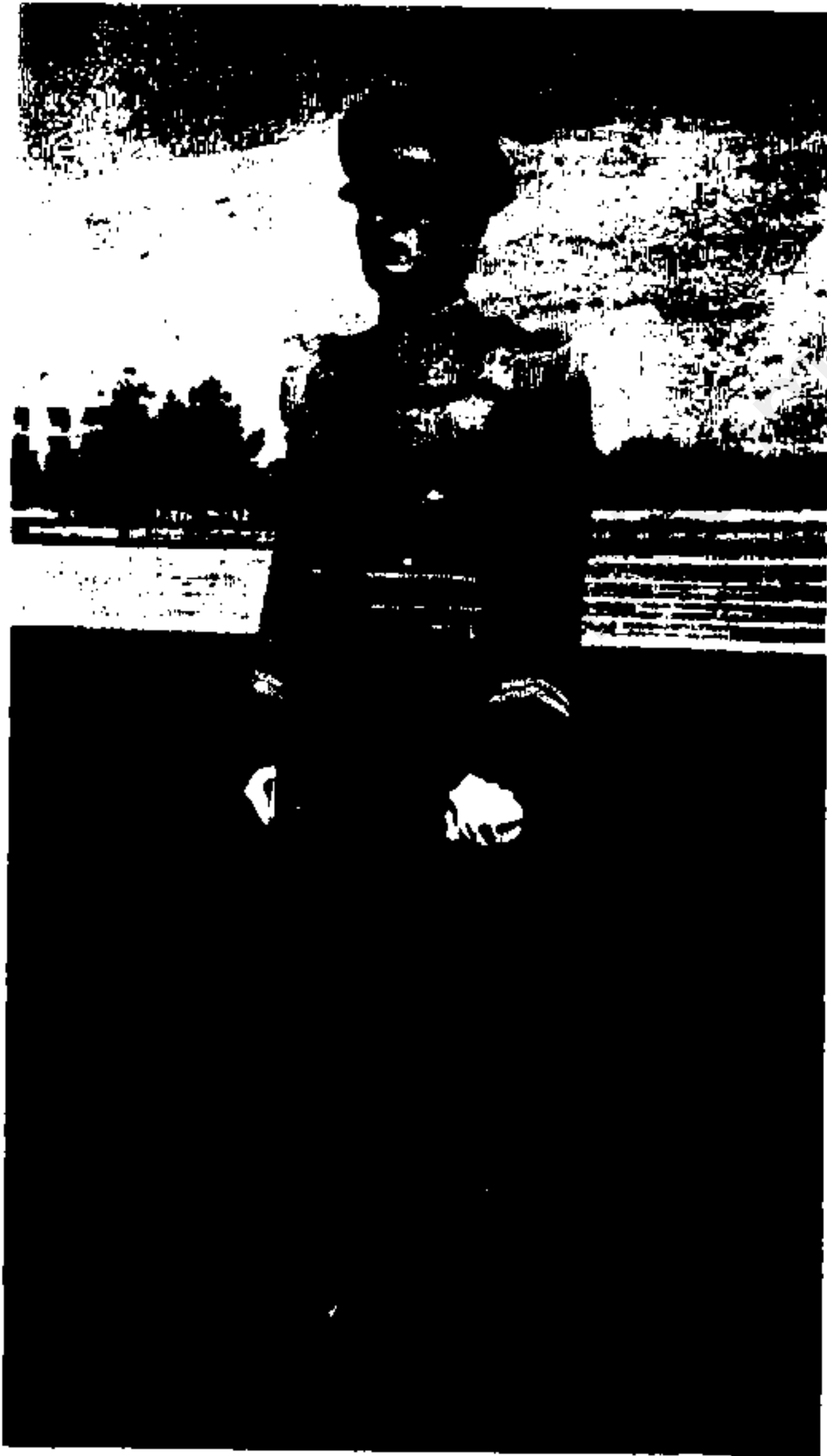
نشر بورتال را اداره مری کب کشور