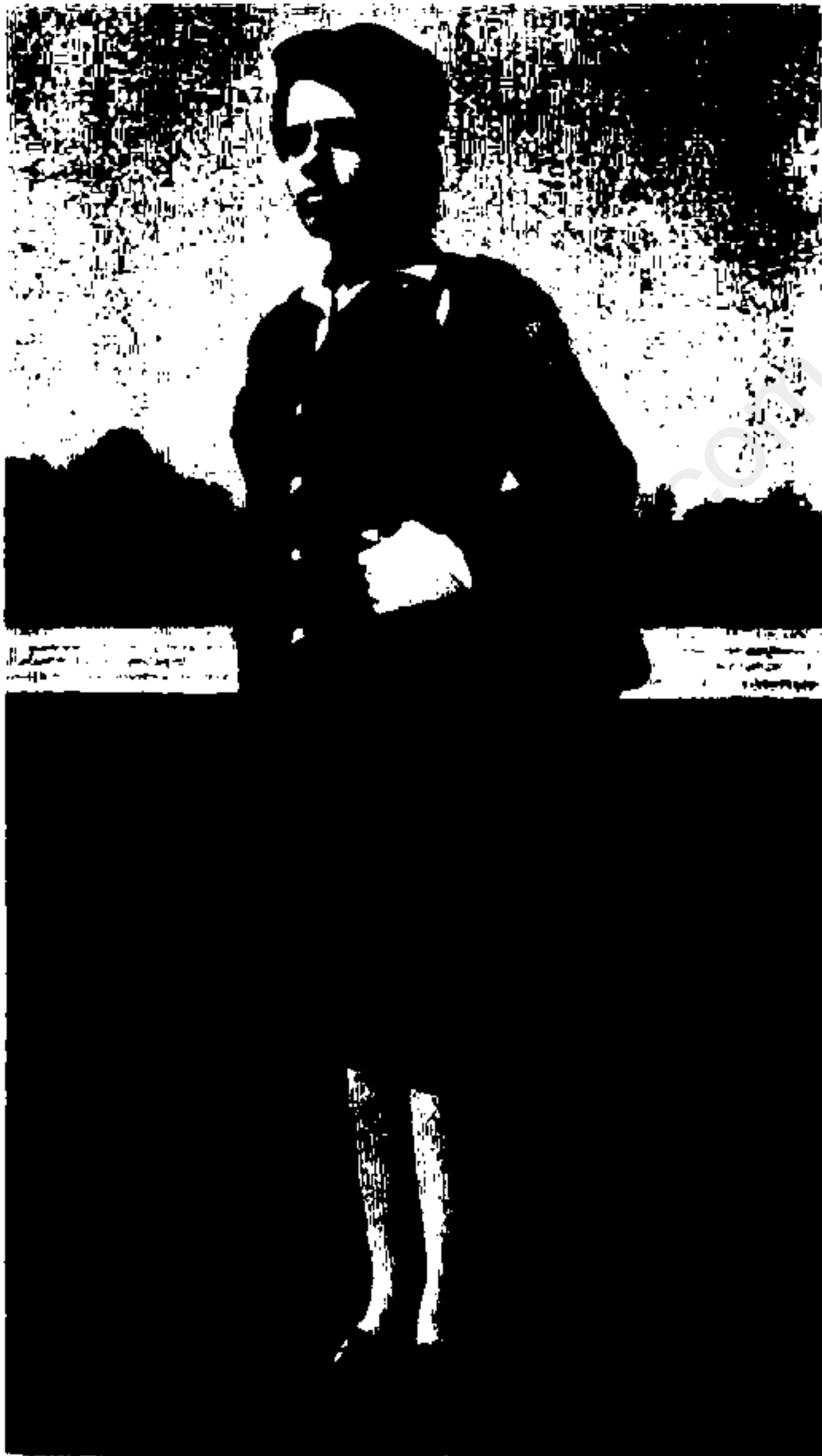
نیروی هوایی (زن)