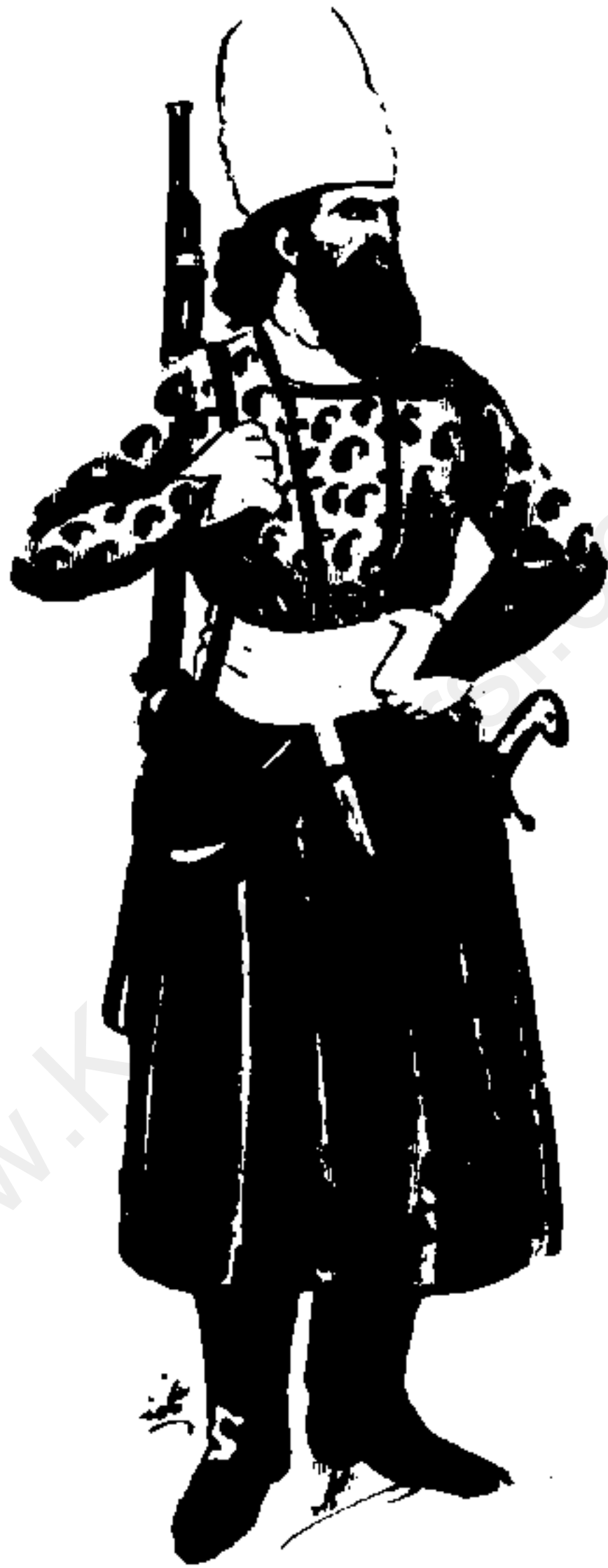
سر باز دوره زنده مدک : نمبرهای دوره زنده و خاستنی ای دوره زنده