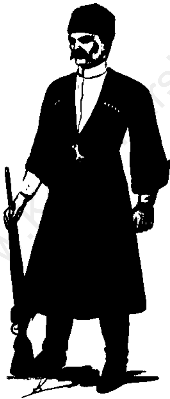
آزاد - دوره قاجاریه مدت: ۱۰۰ ساله دوره قاجاریه مکان: تهران رسم: شایسته ایران