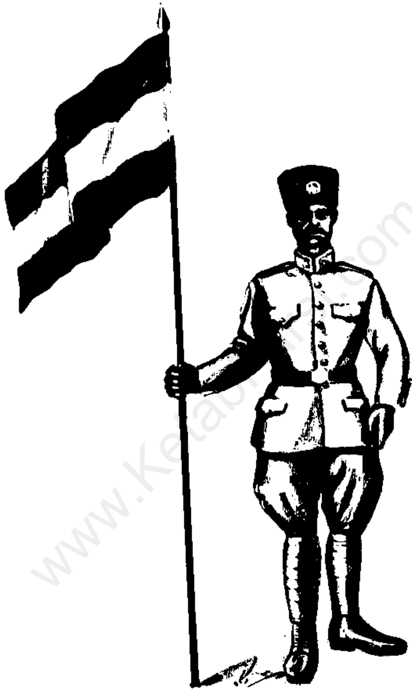
رضی ادفش دارژاندارم - دوره قاجاریه مدک با آئین نرسای باس ازاد ژاندارمری دوره قاجار