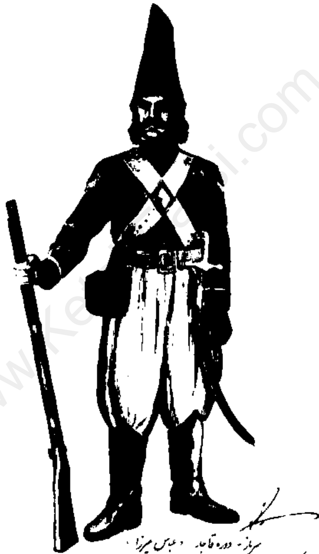
سرباز - دوره قاجار - عباس میرزا عکس : سرباز سرتیپ کلاهدوز قاجاریان نوشته دعوی نوشته ای ژنرال گلجان نقشه سرباز ای و سینه گلجان علی