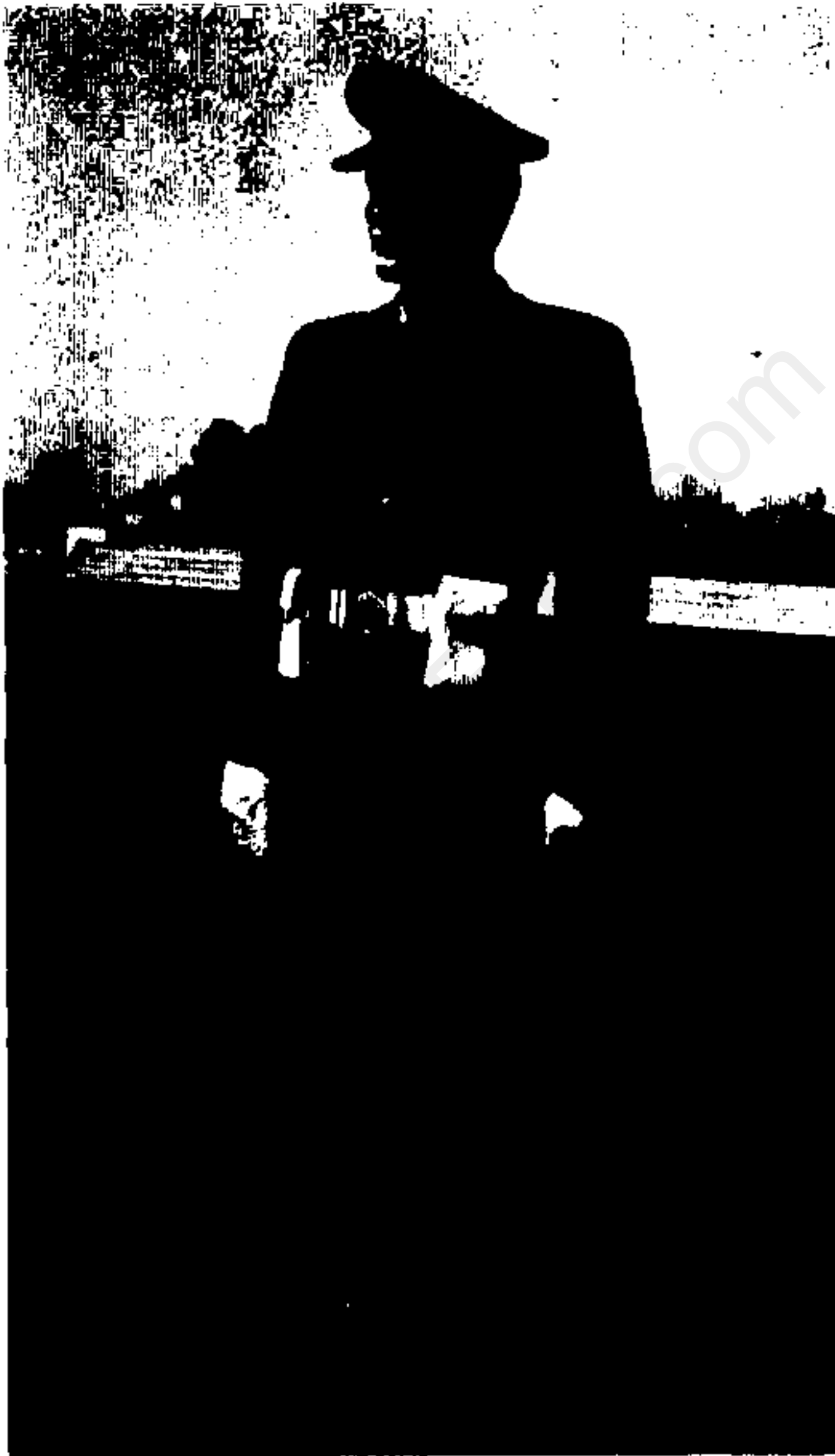
نیروی هوایی (مرد)