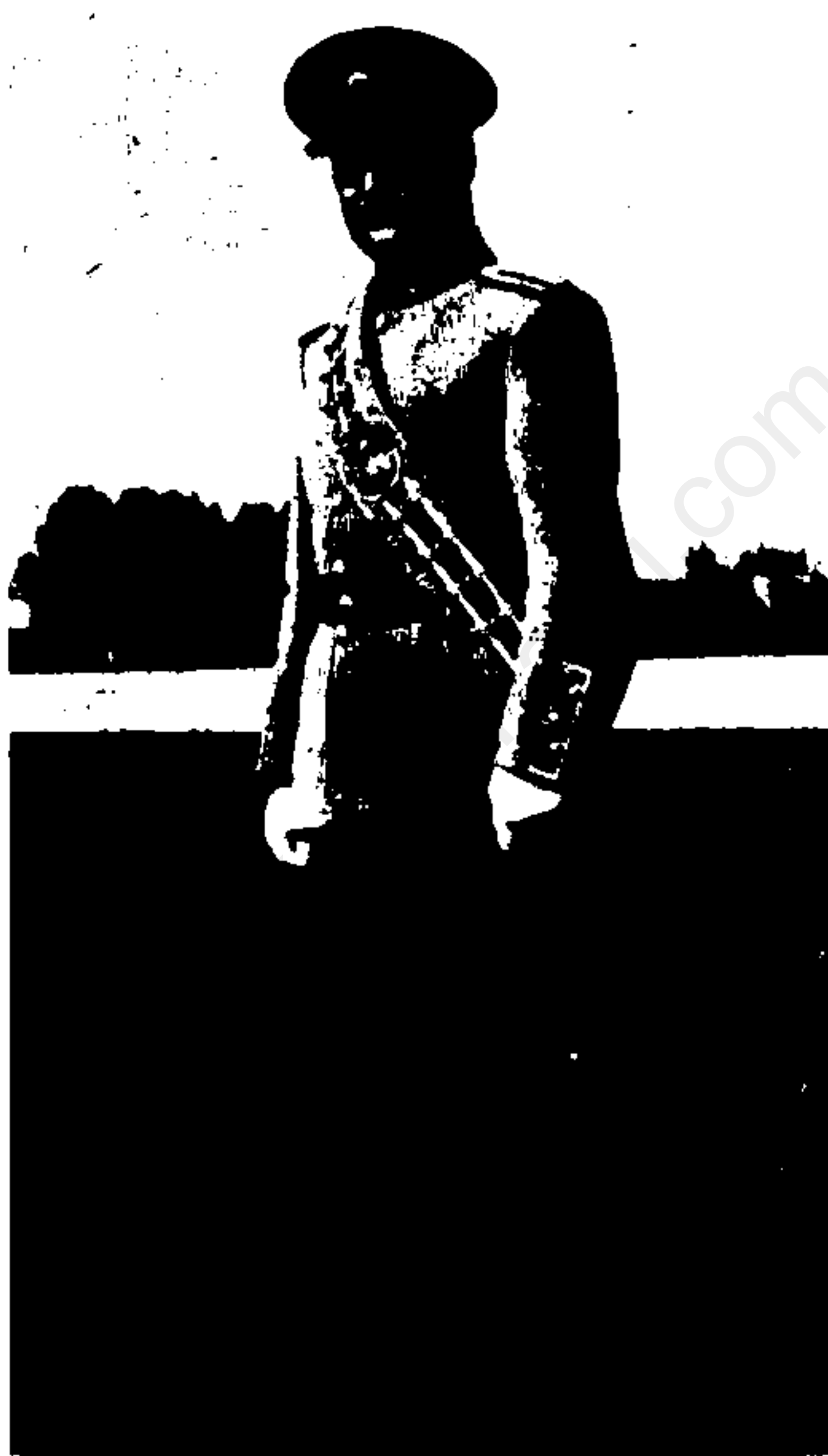
نفر موزيك دانشكده افسری