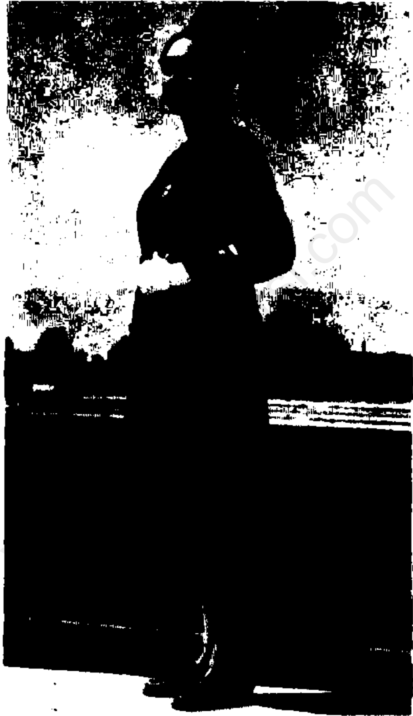
سیاهی انقلاب سفید (دختر)