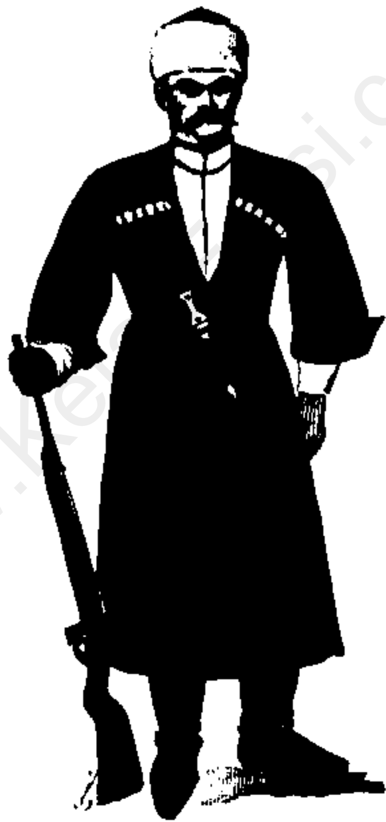
قزاق - دوره قاجاریه مدركت به آذربایجان، دوره قاجاریه، گنمای آبخ مشروطه مین باسار سواء مرد گنمای ناک