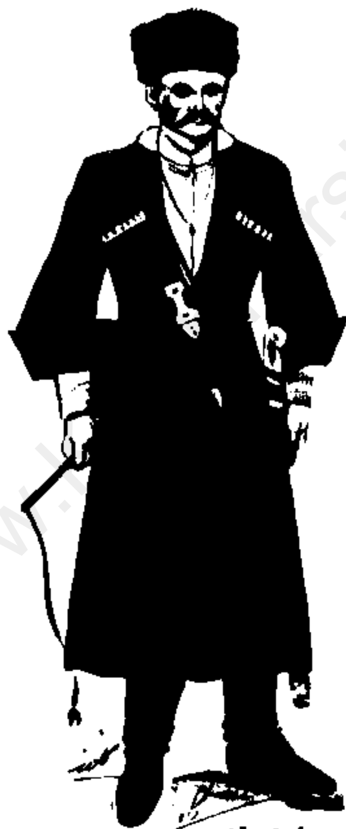
افسر رگاد قزاق - دوران قاجاریه هولت: ازبکهای آذربایجان - مسمای دور مشروطه - چین لباس مورد استفاده مردم تاجیک