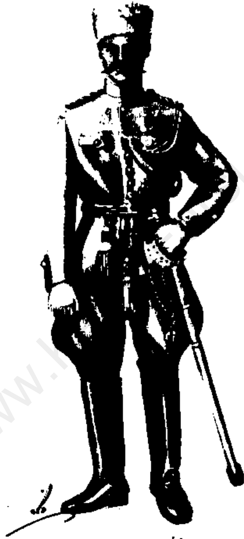
افسر نظامی - دوره قاجار درک : کسری دوره قاجار - من باب اولیٰ می‌سینیا آبی اولی