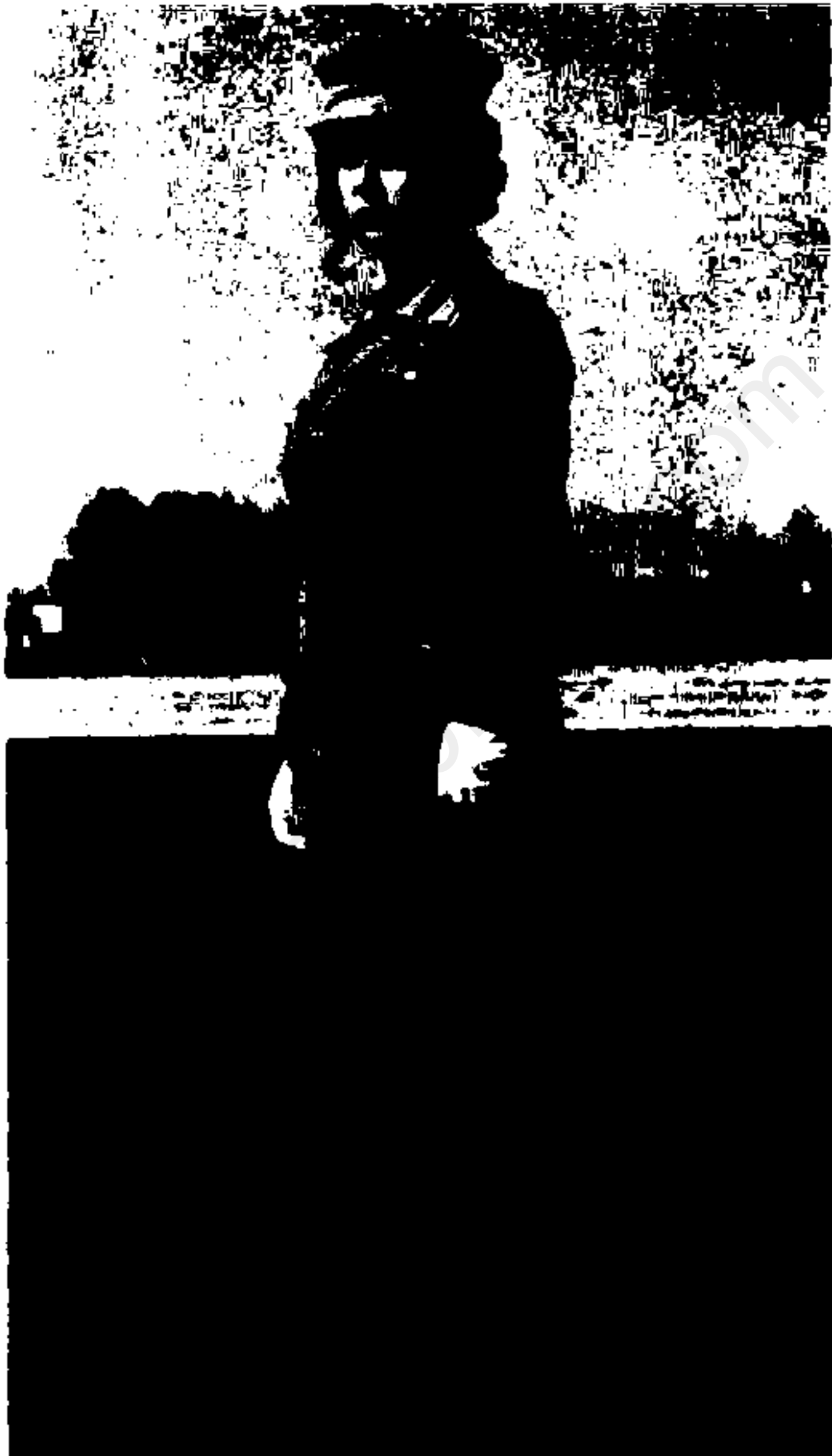
لر تون خدمتگذاران سر (زن)