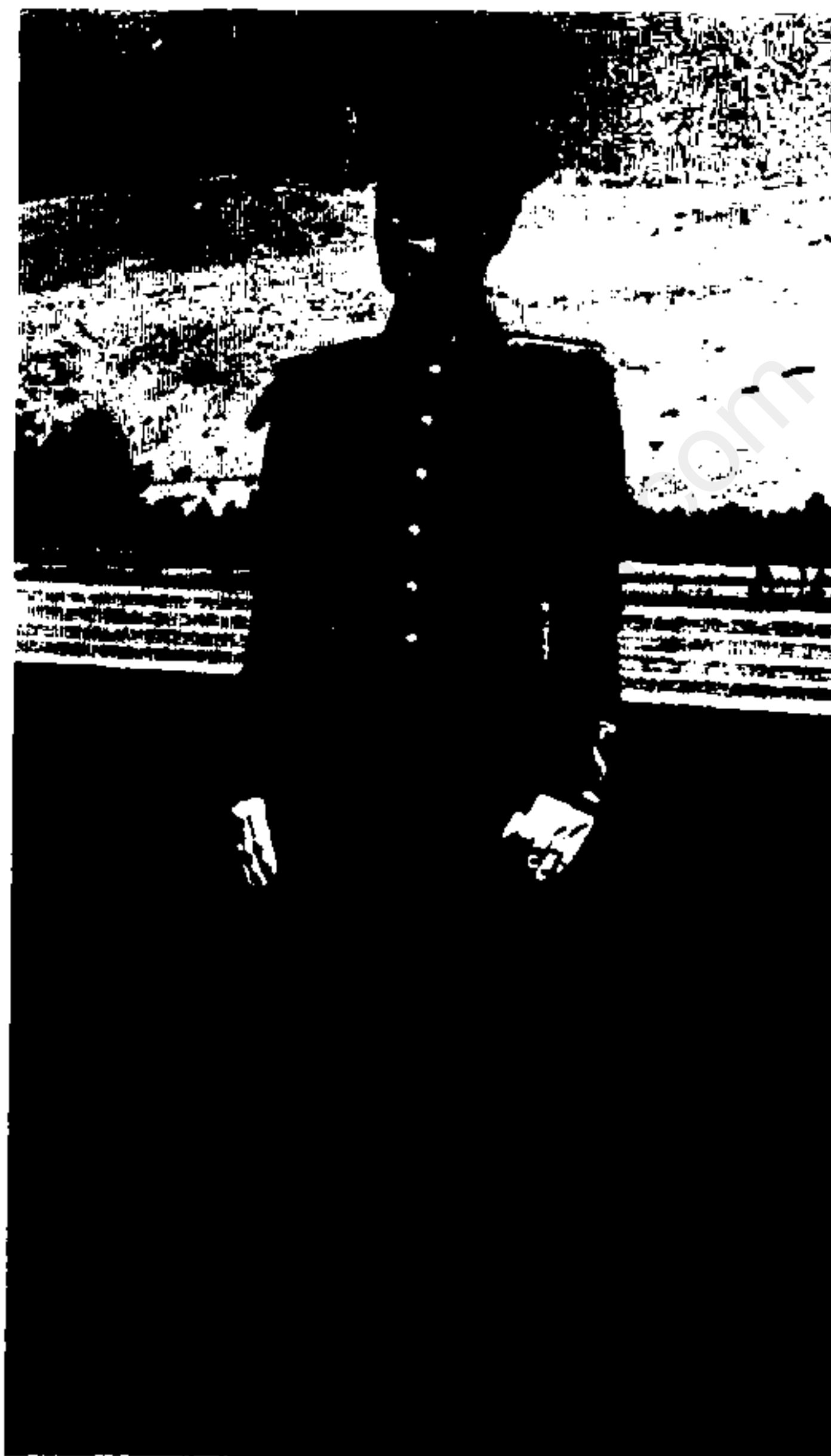
دانشجوی دانشکده افسری