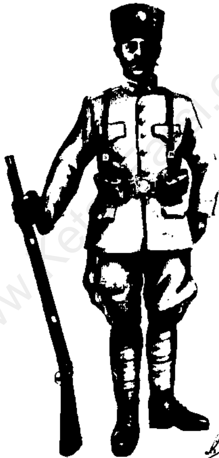
سرباز شادارم - دوره قاجار حدک : آئین ندرای لباس افلاک شادارم - دوره قاجار