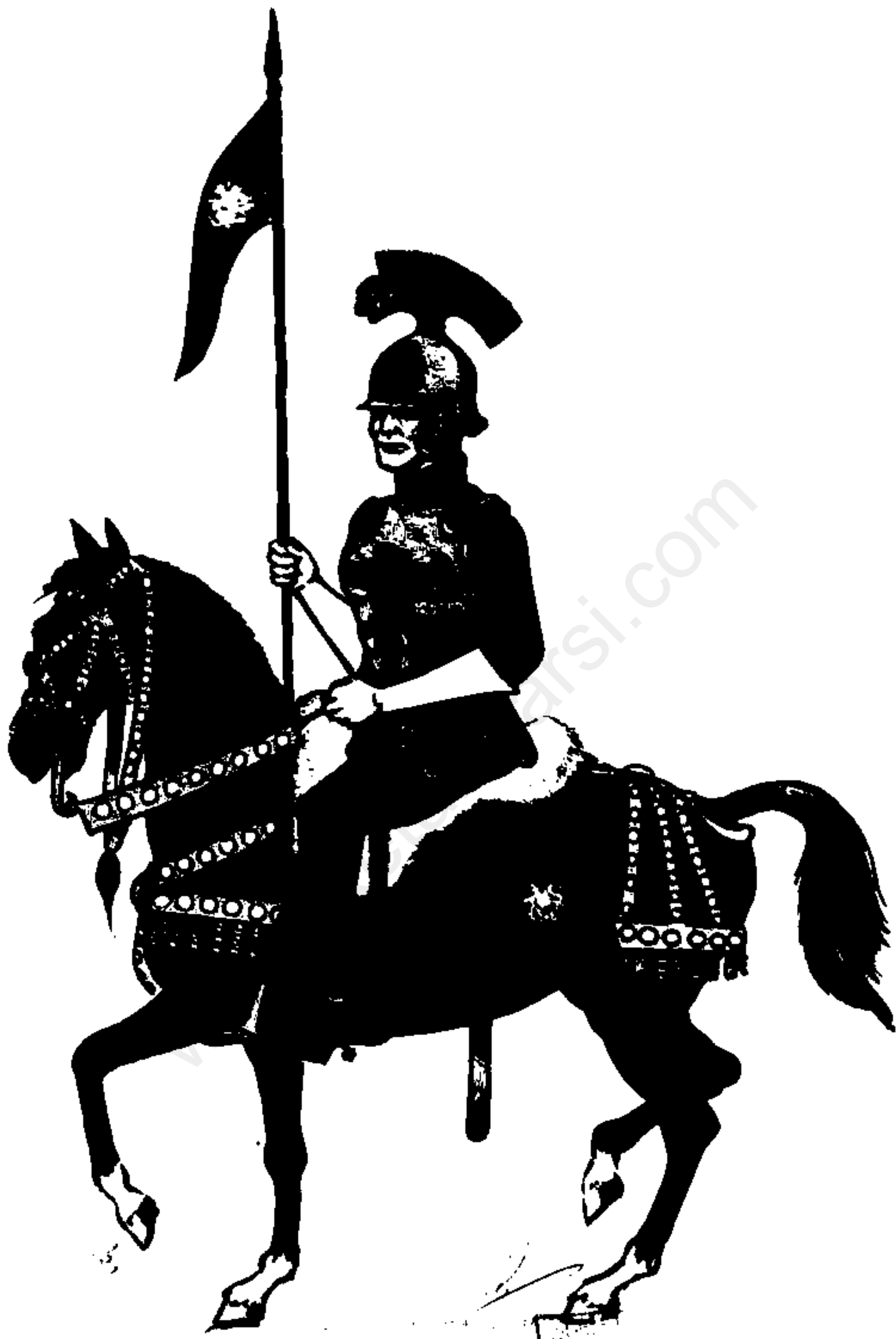
سوار گارد جاویدان