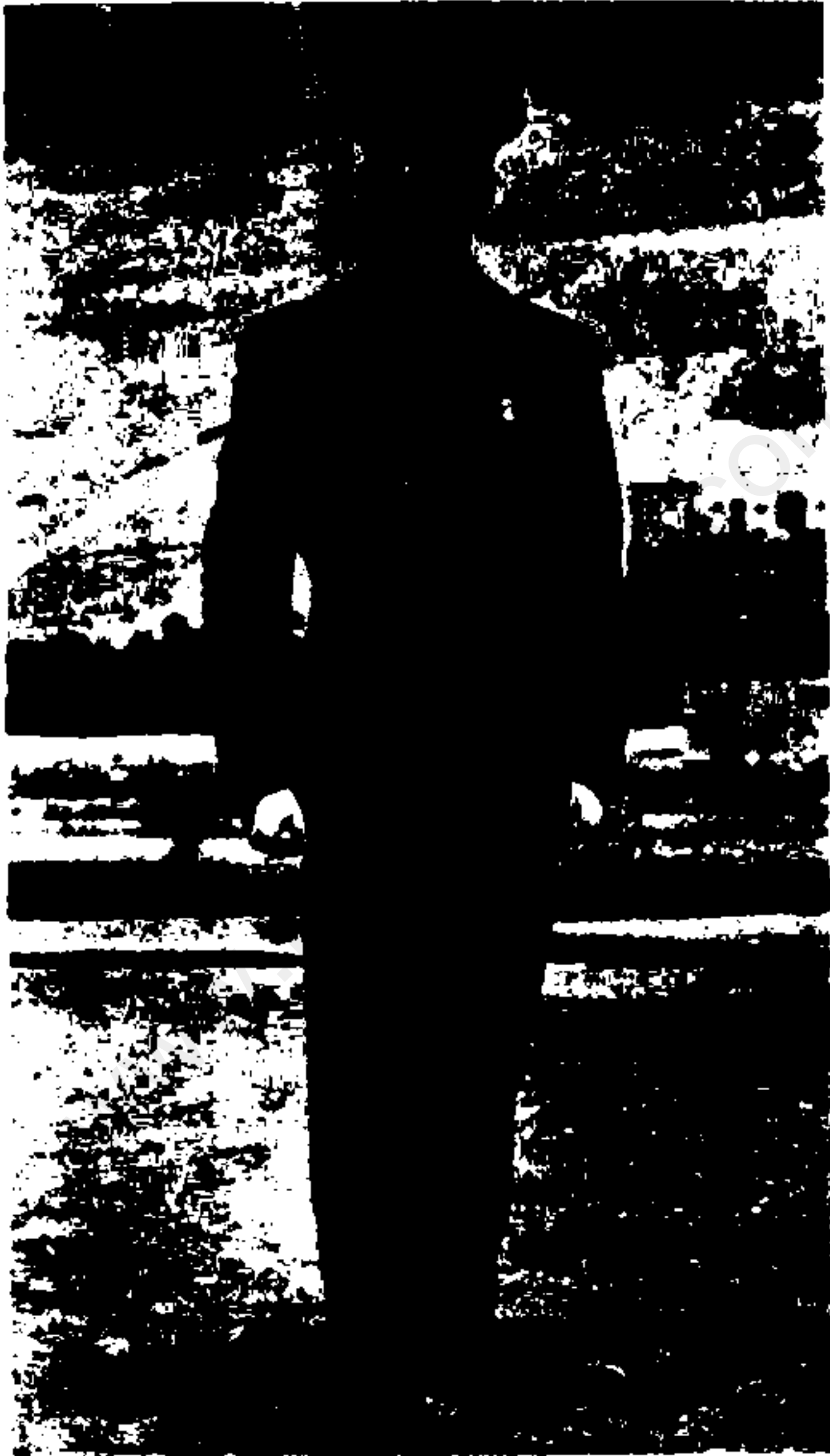
سہمی انقلاب عند انجرا