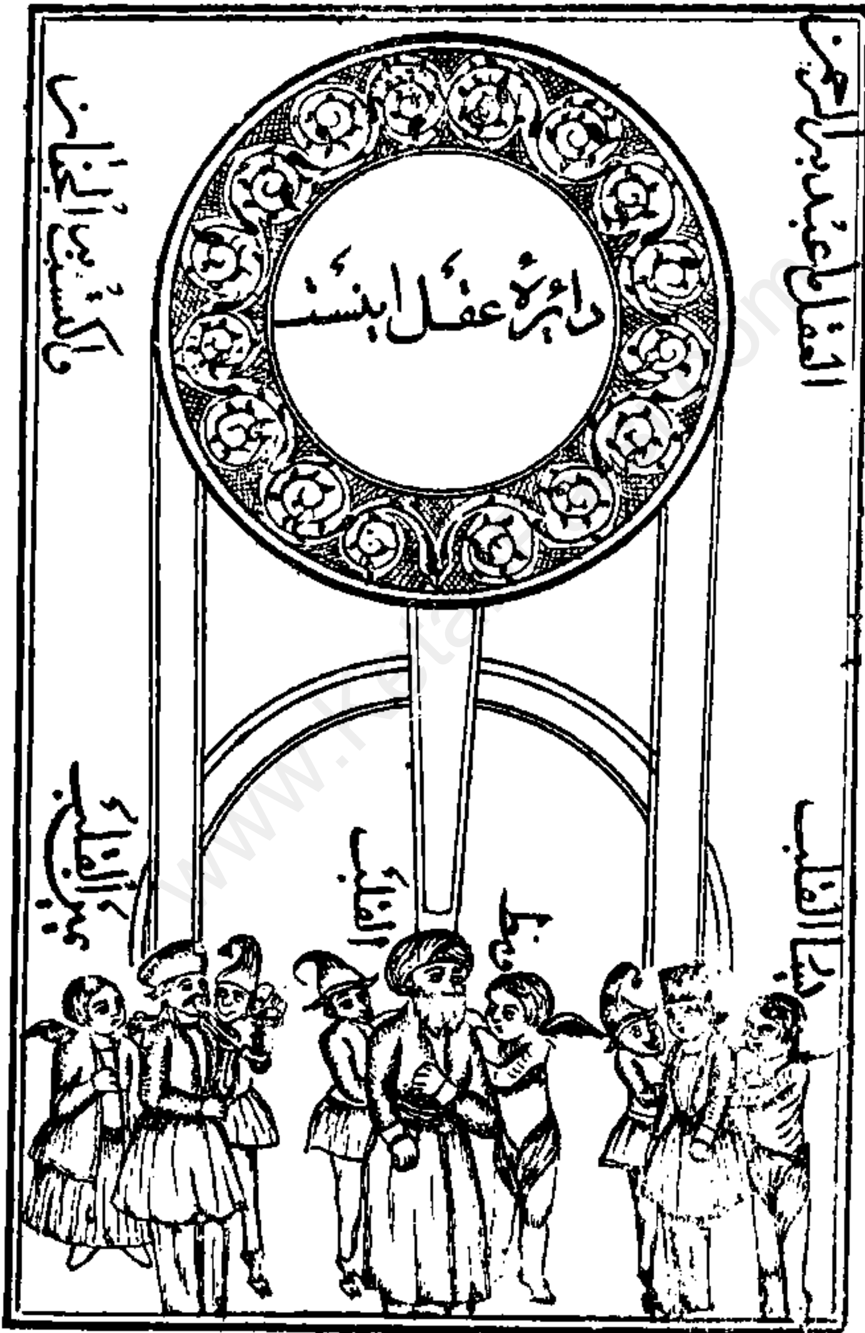
هدایت ملائکه و وسوسه شیاطین نقل از عقاید الشیعه