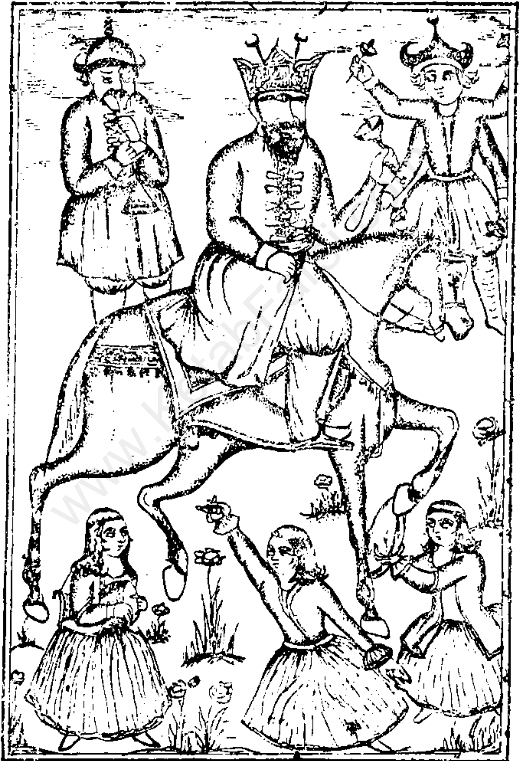
صورت خیالی دجال و خر او و جنود و پیروانش نقل از عقاید الشیعه