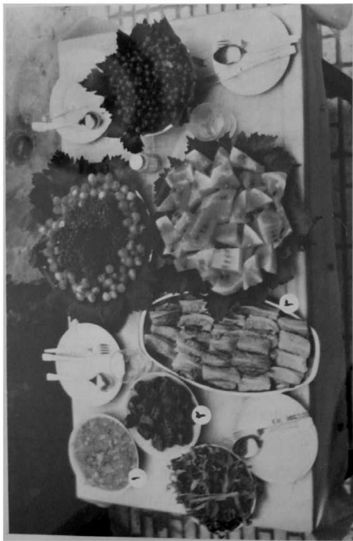
۱- خورش - ۲- خرما - ۳- دلجه