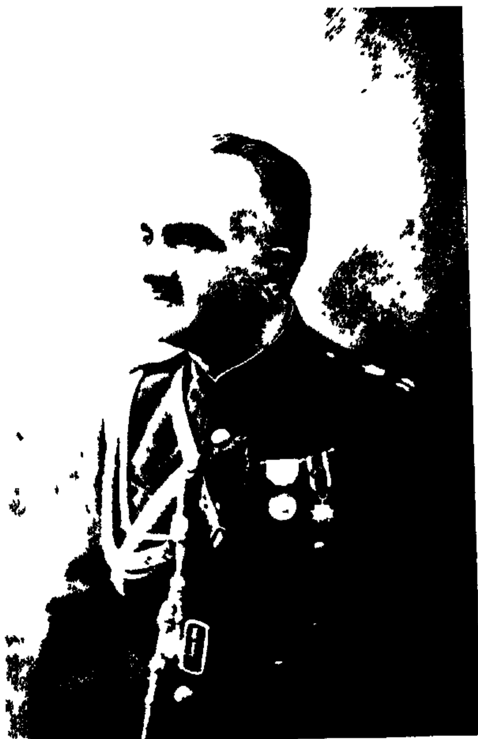
سر ایشق محمد خان