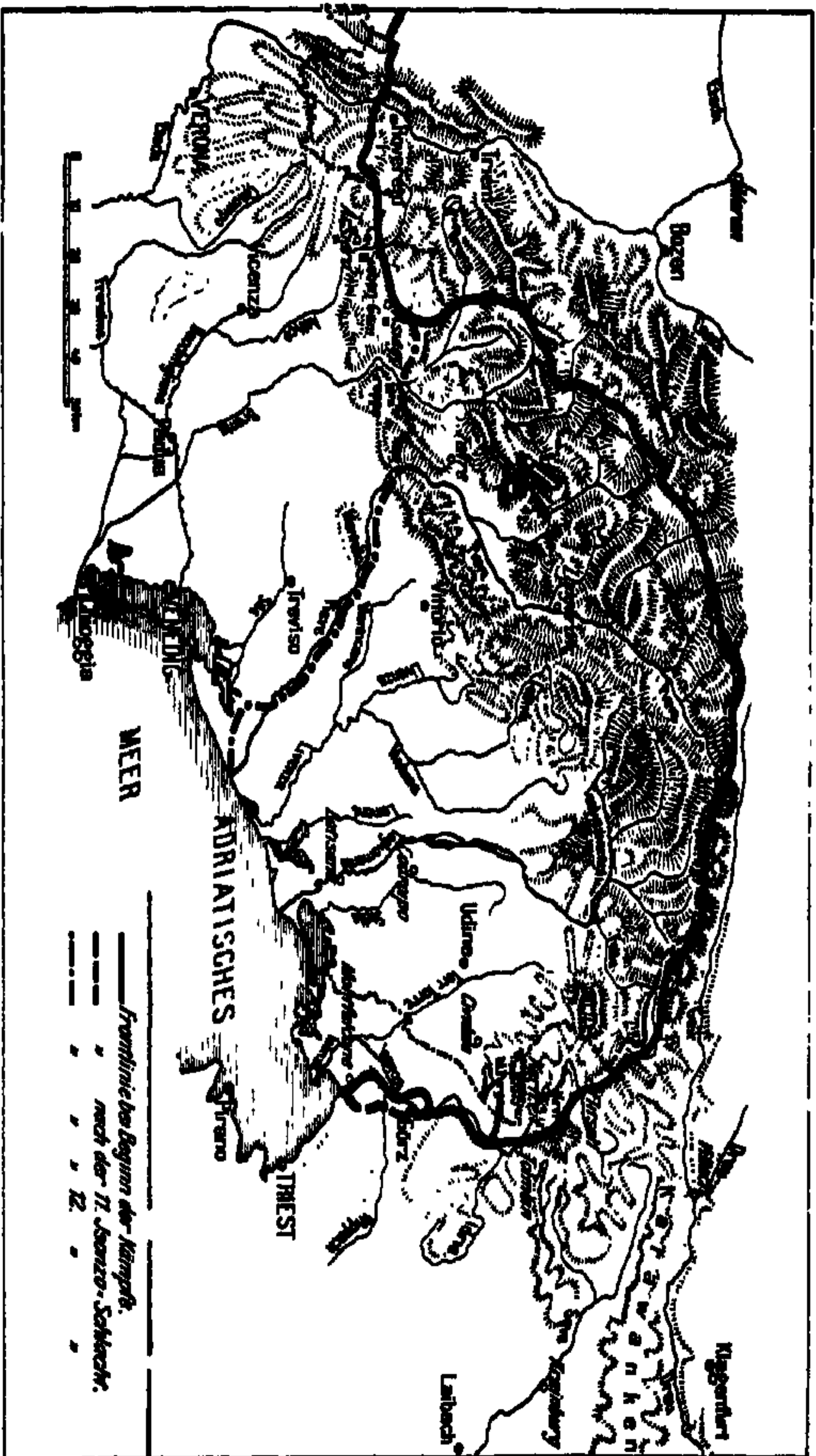
سماحة طرقات جنگی ایتالیا