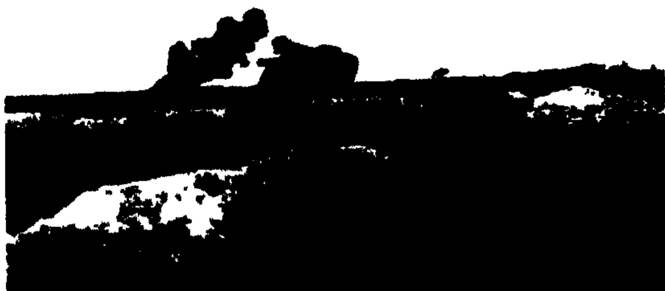
جنگه توت انگلس ه سکرهای آلمان