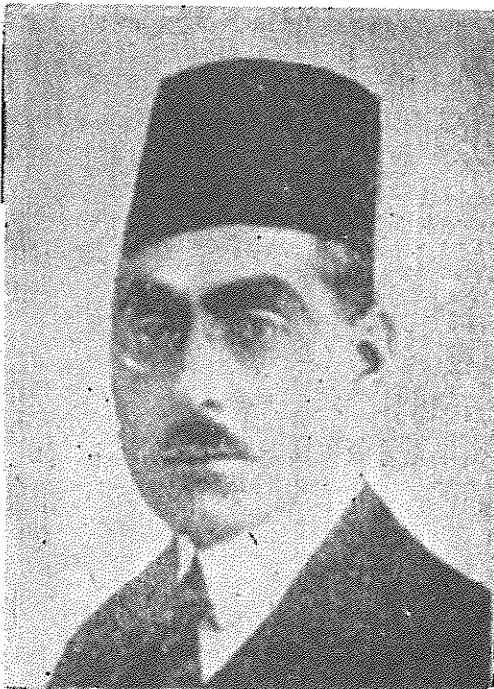
فیروز میرزا نصرت الدوله وزیر مالیه حکومت کلیشه ساز که سالها حبس و تبعید و از کار بکنار بود بعد از قتل داور توقیف و در سنجان او را مسموم و بعد خفه نمودند قرارداد ۱۹۱۹ بین ایران و انگلستان در زمان وزارت خارجه او منعقد گردید