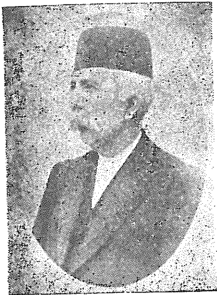
میرزا حسن خان مستوفی الممالک