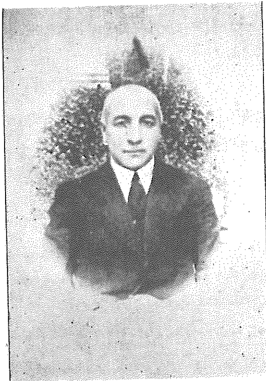
بهاءالملک - علیرضا قراقرز لو

وزیرمالیه کابینه مستوفی الممالک بود و بمیل خود استعفا نمود و در تمام دوران حکومت مطلق العنانی از قبول کار خودداری نمود