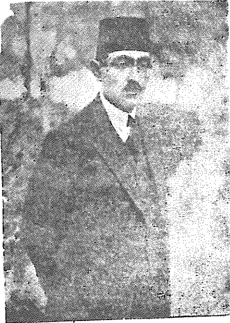
علی اکبر داور وزیر عدلیه

و این شخص ریاست قوای را داشت که موفق باعاده امنیت در آن نقاط گردید و در جنگهای