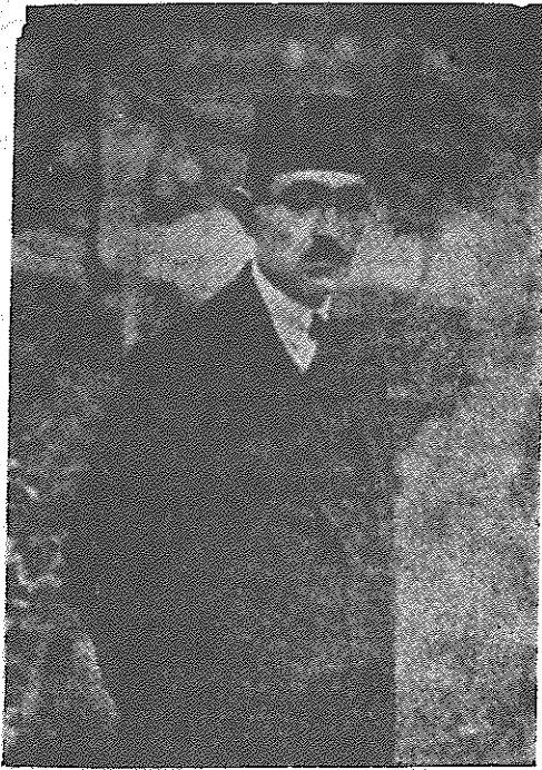
علی اکبر داور وزیر عدلیه

نمایندگان خارجه را روز های یکشنبه در منزل می پذیرفت، رئیس الوزراء نبود