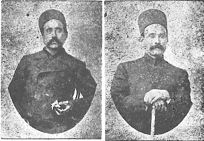
سردار ملی ستارخان

مدعی العموم موفقیت بیست ساله صیاد آزادی را بی نهایت مدیون بمساعدت های سردار اسعد ( سردار بهادر سابق بعد از فوت پدرش سردار اسعد گردید ) میدانند و این شخص با هوش در تمام مراحل و قدمهایی که بسمت سلطنت بر میداشت با نهایت سادگی یاد آور میشد « که من سرباز ساده ای بودم و سردار اسعد در آذربایجان بمن چنین محبت کرد و چنان رأفت و مهربانی با زیردستان داشت .... » این یاد آوری گذشته سردار اسعد