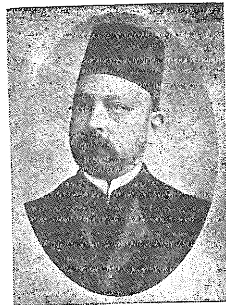
حسین پیرنیا - مؤتمن الملک رئیس نامی مجلس شورای ملی

وزیرمالیه کابینه مستوفی الممالک بود و بمیل خود استعفا نمود و در تمام دوران حکومت مطلق العنانی از قبول کار خودداری نمود