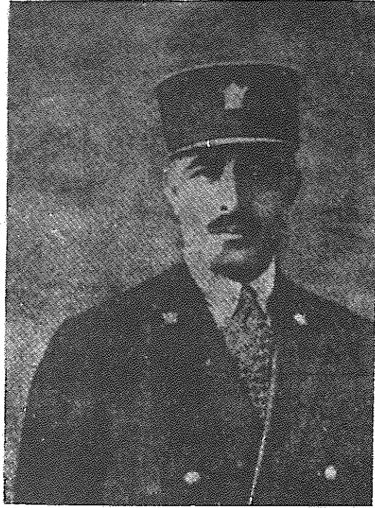
تیمور تاش - عبدالحسین خان خراسانی سردار معظم بهیما وزیر دربار و بالاخره در زندان قصر مقتول گردید ۱۳۱۲