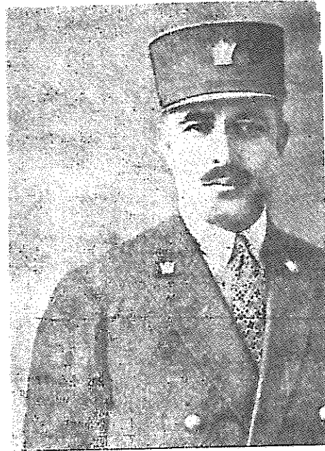
تاش - عبدالحسین خان خراسانی سردار معظم بهدها در بارو بالاخره در زندان قصر مقتول گردید ۱۳۱۲