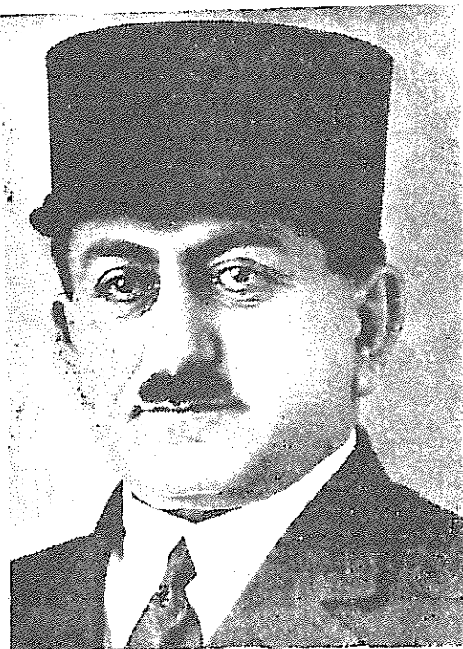
جعفر قلیخان سردار اسعد پسر علیقلیخان سردار اسعد بختیاری وزیر جنگ که در مجلس نظمی او را مسموم و خفه نمودند