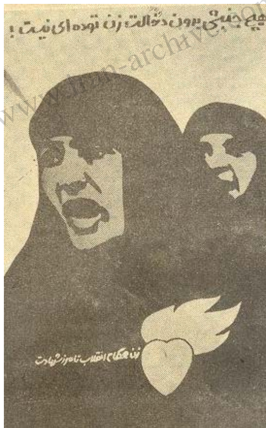
پوستر حزب بمناسبت روز جهانی «زن»!!

امام خمینی از جمله گفتند: ..... ساده اندیشی است که ما گمان کنیم که فقط تخصص میزان است و علم میزان است . علمی الهی هم میزان نیست ، علم توحید هم میزان نیست ، علم فقه هم و فلسفه هم میزان نیست مردم شماره ۴۱۵، شنبه ۲۰ دیماه ۱۳۵۹