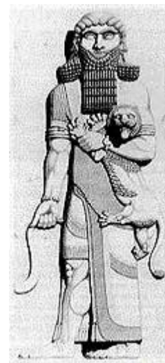
چهره‌ی انسانی گیل‌گمش

افسانه‌ی درخت «هولوپو» از نخستین افسانه‌هایی است که به داستان کاشت درخت می‌پردازد. «زن» در این داستان نقشی اساسی دارد. در باره‌ی درخت هولوپو نظرات مختلفی وجود دارد. برخی آن را درخت بید، برخی درخت سرو و برخی آن را درخت نخل می‌دانند، اما همه بر این باورند که این درخت میوه‌دار زنده و نیاز دیگری انسان را به کشت درخت و می‌دارد.