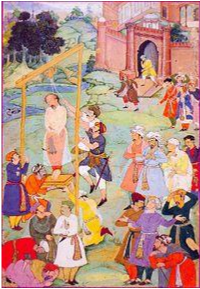
اعدام مانی/منصور حلاج