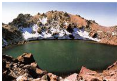
دریاچه کوه سبلان بر فراز قله آن

طایفه گور ، گلوور و گوران که اکنون به صورت فرقه علی الهی در آمده اند در اساس آلوهی بوده اند و بازماندگان همان قبیله مادی مغان عهد باستان می باشند که زرتشت (گائوماتای مغ، بردیه) از میان ایشان بر خاسته بود.