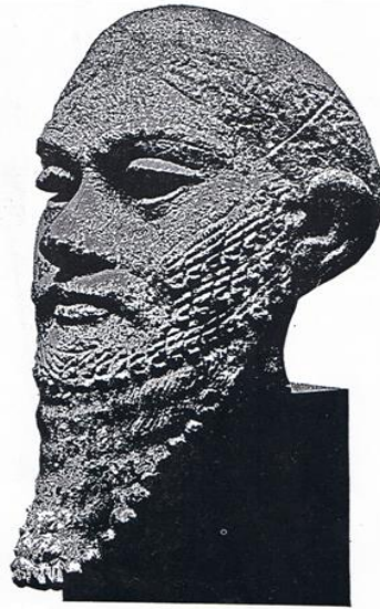
۱۵۰ مجسمه سر، تصویر از پادشاهان کیان [1]، از موزه. کارستانسنگر آندی باغیانی، پایان هزاره سوم قبل از میلاد [2]