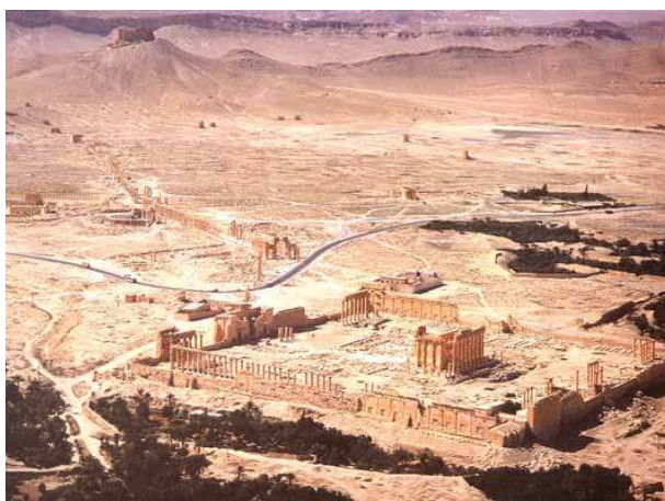
آثار بر جای مانده از شهر تدمر در قلب صحرا

دست کاهنان بود و دوم از اواسط قرن ششم ق. م . تا انقراض که سلاطین مقتدر و غیر دینی و مذهبی به قدرت رسیدند. در دوره اول، پایتخت آنها شهر صرواح بوده است . در سال ۱۱۵ ق.م . قوم حمیر که باز از مناطق جنوبی شبه جزیره بودند ابتدا بر ممالک قتبانی و بعد بر سبا تسلط یافتند. در قرن دوم مسیحی حبشی ها ( شمال افریقا ) بر ممالک تحت نفوذ حمیریها استیلا یافتند و پای مبلغین و مروجین مسیحیت را به شبه جزیره و به ویژه منطقه یمن باز کردند و کلیساهای مسیحی را بر پای نمودند! ( داستان حمله ی ابرهه به مکه و شکست وی توسط خدای کعبه از همین جا نشأت می گیرد! ) حمیریها که از تسلط حبشی های مسیحی و بیگانه بر خاک خود نا خشنود و نا خرسند بودند، سر انجام به دربار ساسانیان روی آوردند و از خسرو انوشروان استمداد طلبیدند! دولت ایران در حدود سال ۵۷۰ م . به یمن لشکرکشی کرد و حبشی ها را شکست داد و خود بر یمن فرمانروا شد!