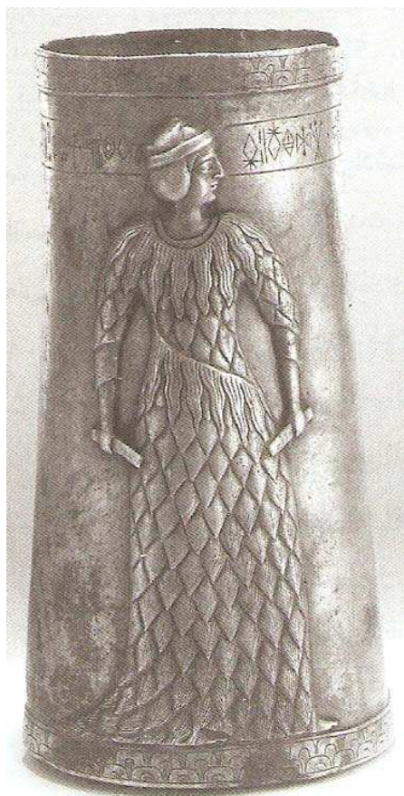
تصویر یک زن ایلامی

را گم می کنند تا هم دلی خالی کرده باشند و هم اجازه ندهند که دانه ی گردی بر دامن پاک و از گل منزه تر اسلام عزیز و نجات دهنده بنشیند!!