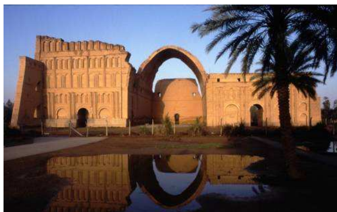
خرابه های تاق کسری در عراق کنونی

چرا توده ها نباید بدانند و آگاه شوند که: آنان که آمدند خالد بن ولیدها، سعد وقاص ها و شمشیرداران بیابانی شان بودند، که به نام آیین خدا و احکام قرآن آمدند تا تا تازیان را سروری و عزت بخشند و هستی و ناموس شان را بتاراج برند؟