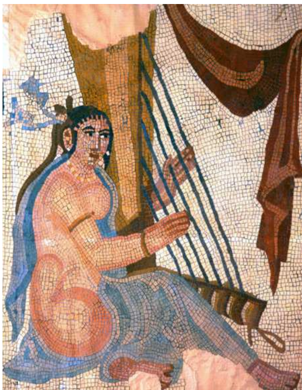
نمونه ی هنر دوران ساسانی. موزاییکی از ریزه های سنگ

ه.ق) در کتاب ۱۸ جلدی تاریخ الرسل و الملوك يا تاريخ الامم والملوك معروف به تاريخ طبري، شويس عدوي، محمد بن جرير طبري ( ۲۲۴ ه.ق در آمل - ۳۱۰ ه.ق ) در کتاب ۱۸ جلدی تاريخ الرسل و الملوك يا تاريخ الامم والملوك معروف به تاريخ طبري و ... مدد می گیریم!