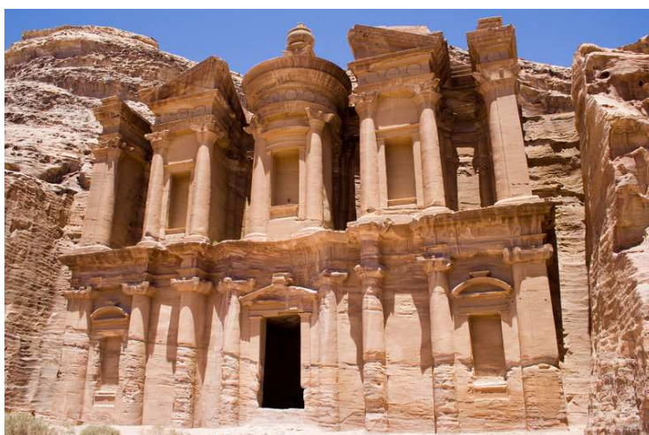
آثار بر جای مانده از شهر پترا در شمال عربستان

غیرتمند و متعصب عرب را به منظور انجام کارهایش به استخدام در می آورده که شخص محمد یکی از آنان و نمونه ی غیر قابل انکار این گونه مردان بوده و هست! و همین بانوی اول اسلام است که بنا بر يك سنت مادر سالاری و زن تباری از محمد خواستگاری به عمل می آورد!