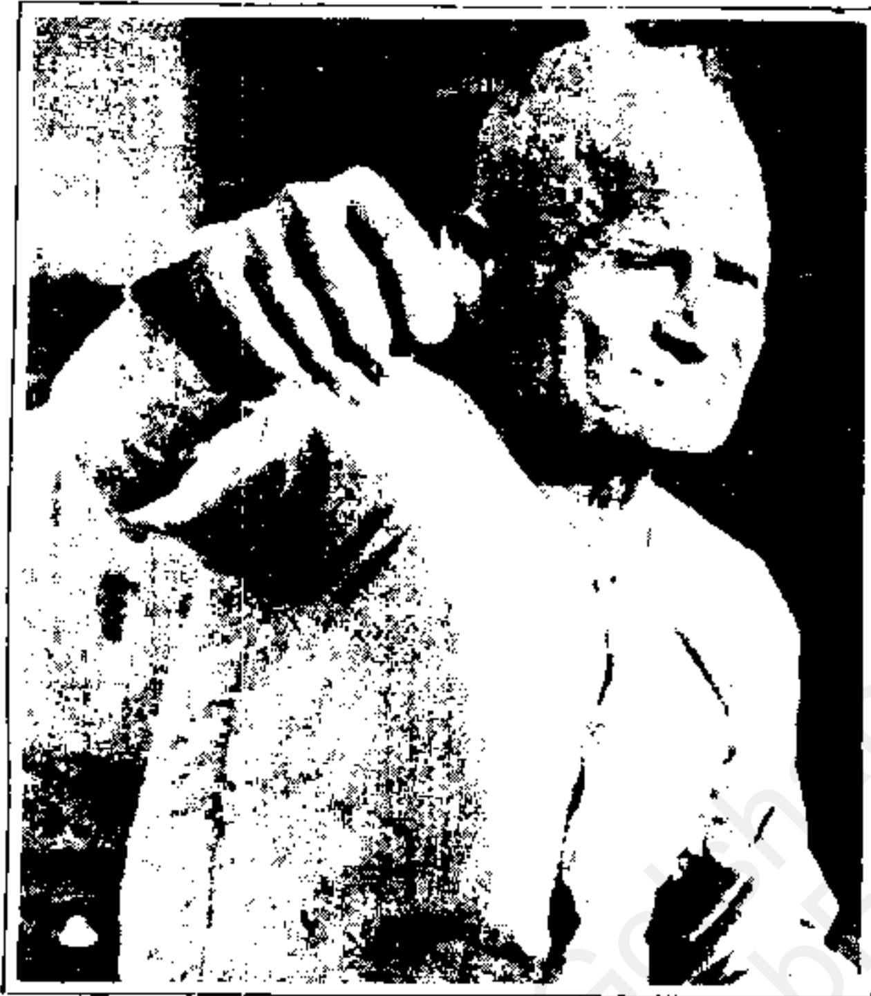
«پ مثل پلیگان» (۱۳۴۹) ساخته‌ی پرویز کیمیایوی