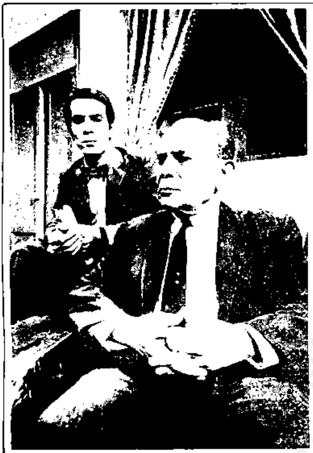
• مجموعه تلویزیونی "آخشبوس" (۱۳۴۶) ساخته پرویز صیاد