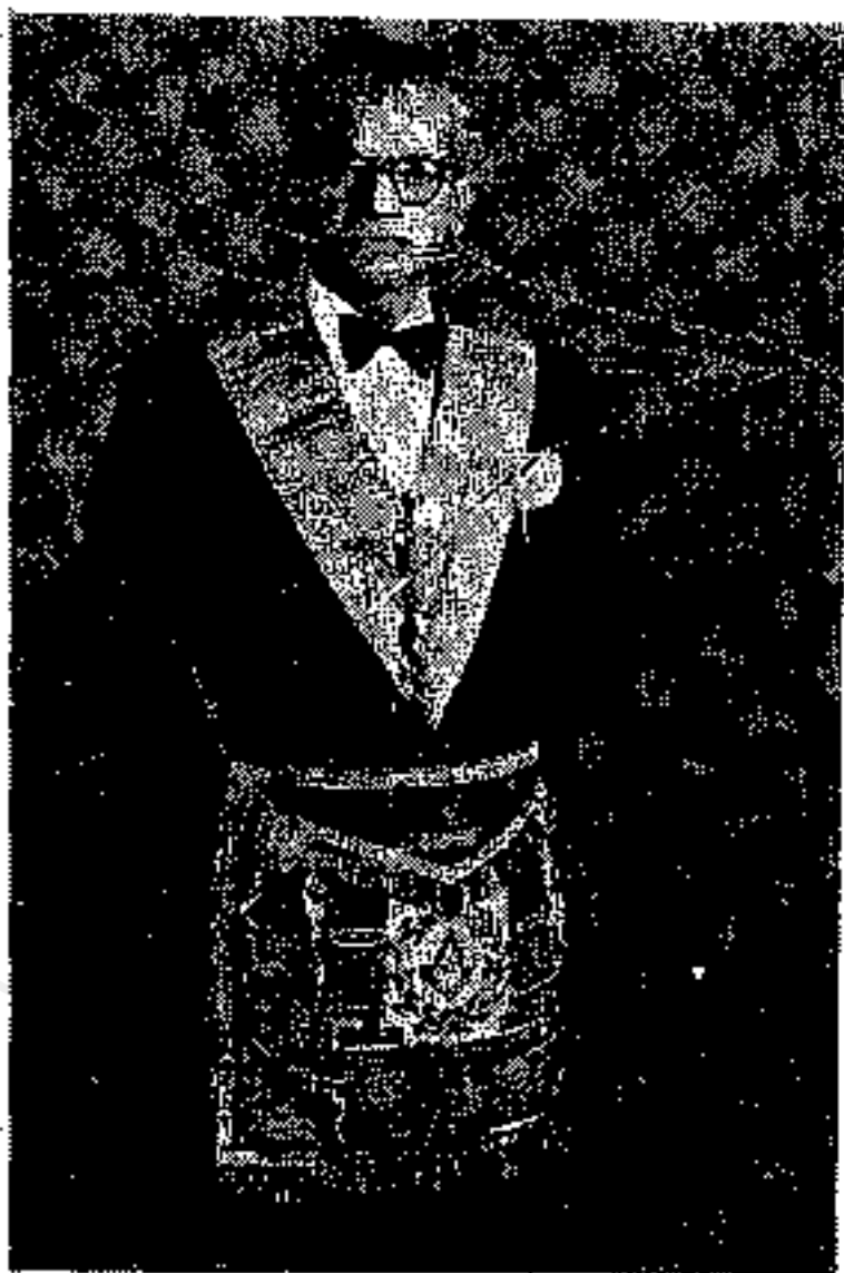
سید محمدعلی امام شوشتری یکی از بنیانگذاران نژاد نو