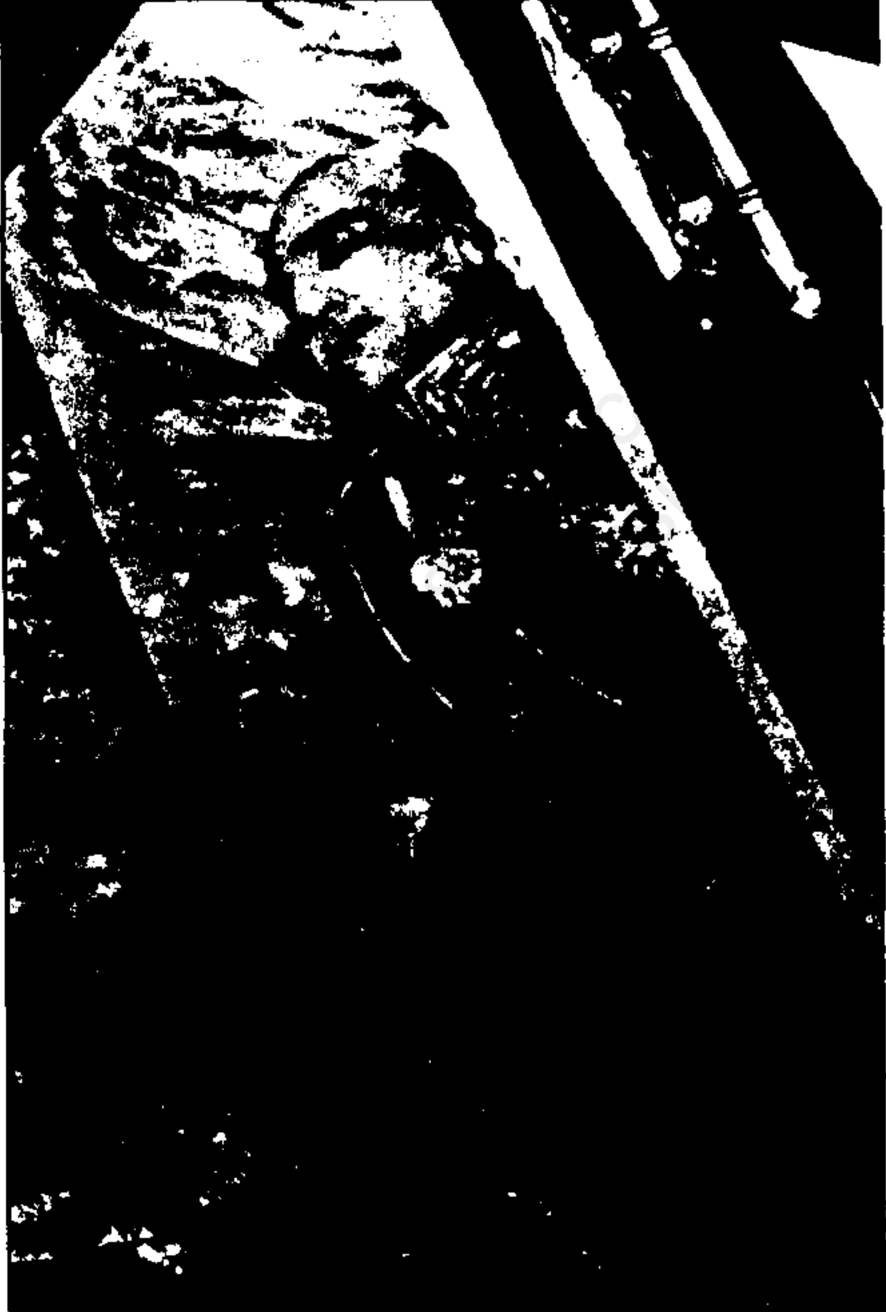
جنازه مومیایی شده رضا شاه که در حال حاضر در مسجد الرفاعی قاهره قرار دارد .