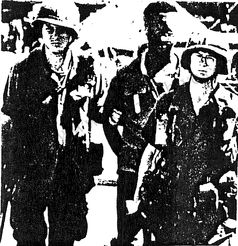
امیرسالیستهای پانکسی در " گرانادا "

بنیاد هواخواه غرب از نظر اقتصادی و هرچه بیشتر وابسته نمودن آنها به غرب . ۱) " قرار داد امنیت متقابل " ( M S A ) که همانا تعهد حمایت از رژیمهای ضد کمونیست همجوار چین و شوروی است . ۱۹۸۶ — تخصیص کمک نظامی به مبلغ ۱۰۰ میلیون دلار به ضد انقلابیین کنترا علیه دولت ساندنیست نیکاراگوئه .