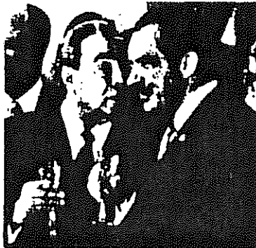
Nixon and Brezhnev in Moscow