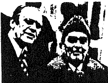
Ford and Brezhnev in Vladivostok