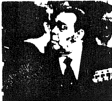
Carter and Brezhnev in Vienna