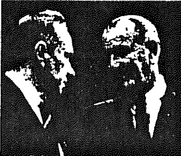
Johnson and Kosygin in Moscow