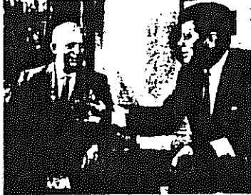
Kennedy and Khrushchev in Vienna