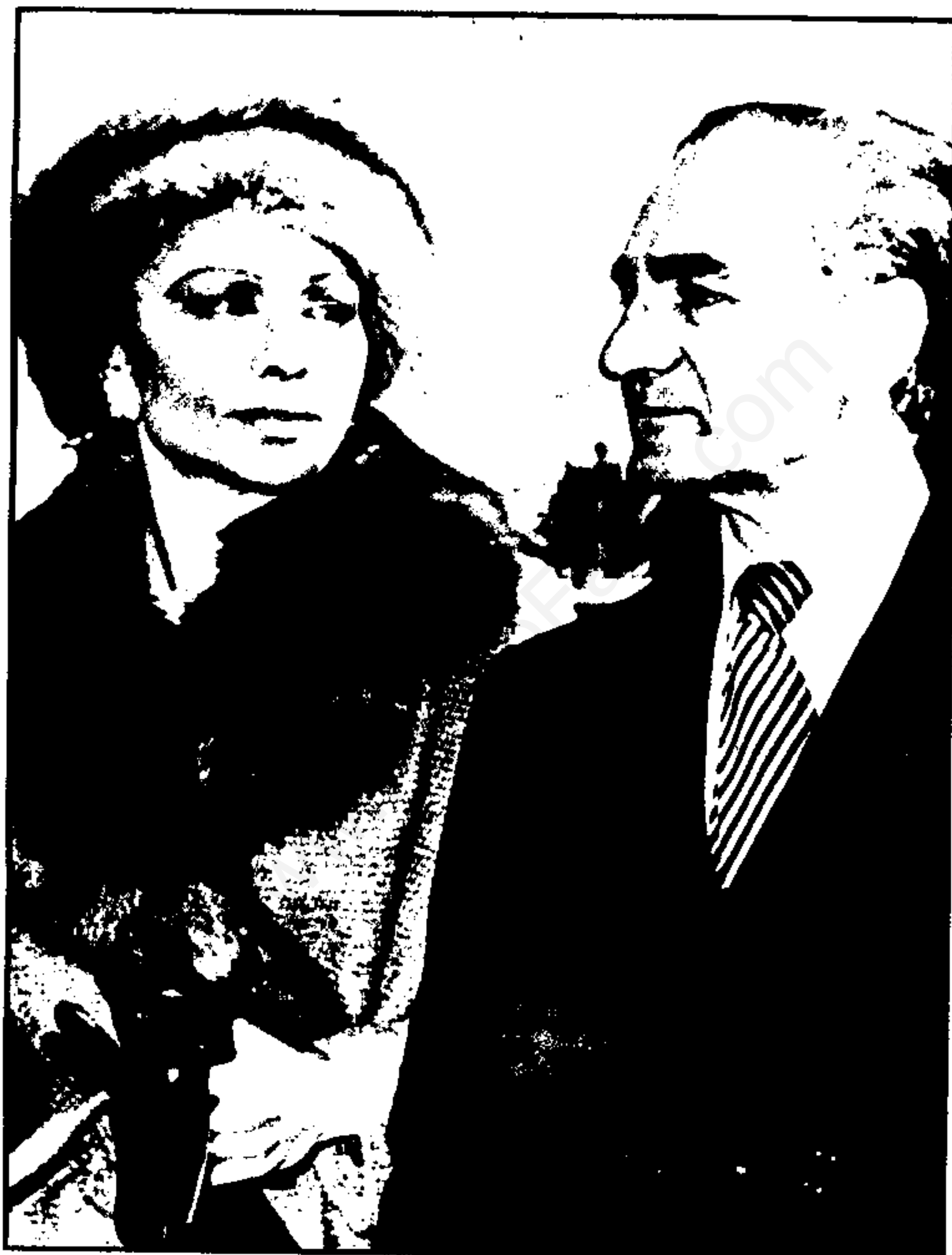
روز ۲۶ دیماه ۱۳۵۷ شاه با چشمان گریان برای همیشه ایران را ترک گفت. این آخرین عکس او با همسرش فرح لخطانی قبل از عزیمت از تهران است.