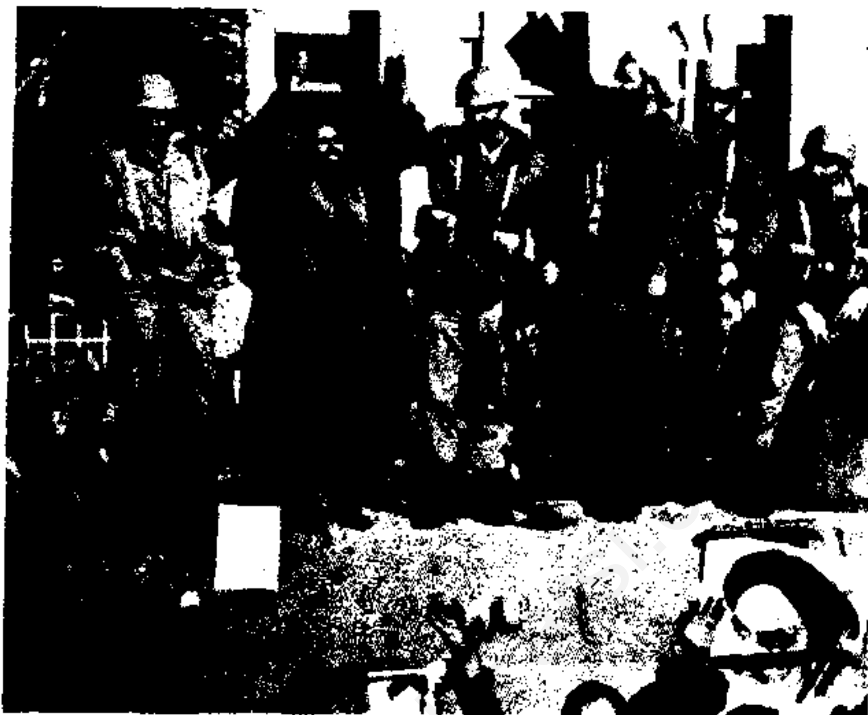
بدنبال خروج شاه از ایران روحیه نیروهای نظامی به شدت متزلزل شد و نیروهای انقلابی و نظامیان بیش از پیش بهم نزدیک شدند.