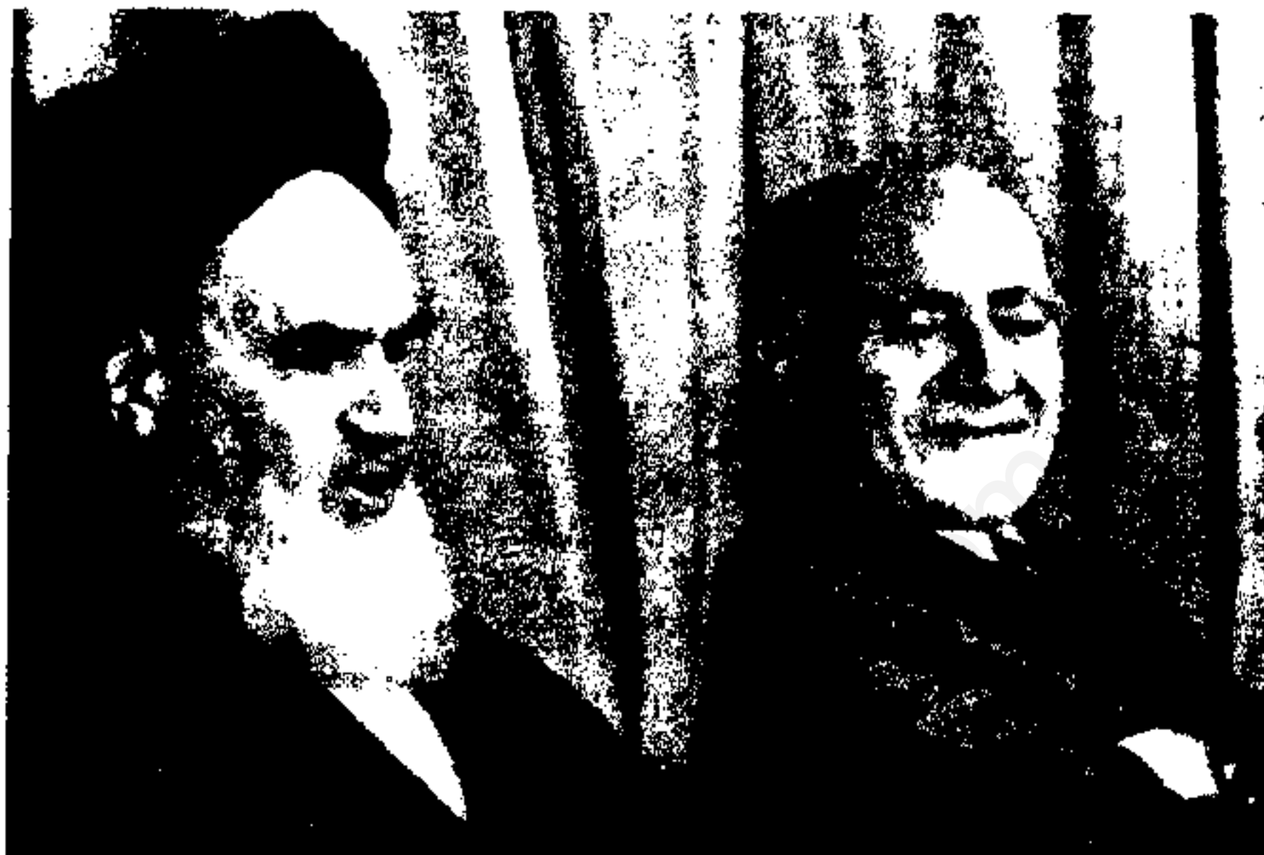
امام خمینی چند روز پس از مراجعت به ایران مهندس مهدی بازرگان را به مقام نخست‌وزیری منصوب نمودند و مهندس بازرگان برنامه کار خود را طی نطقی در دانشگاه تهران اعلام داشت.