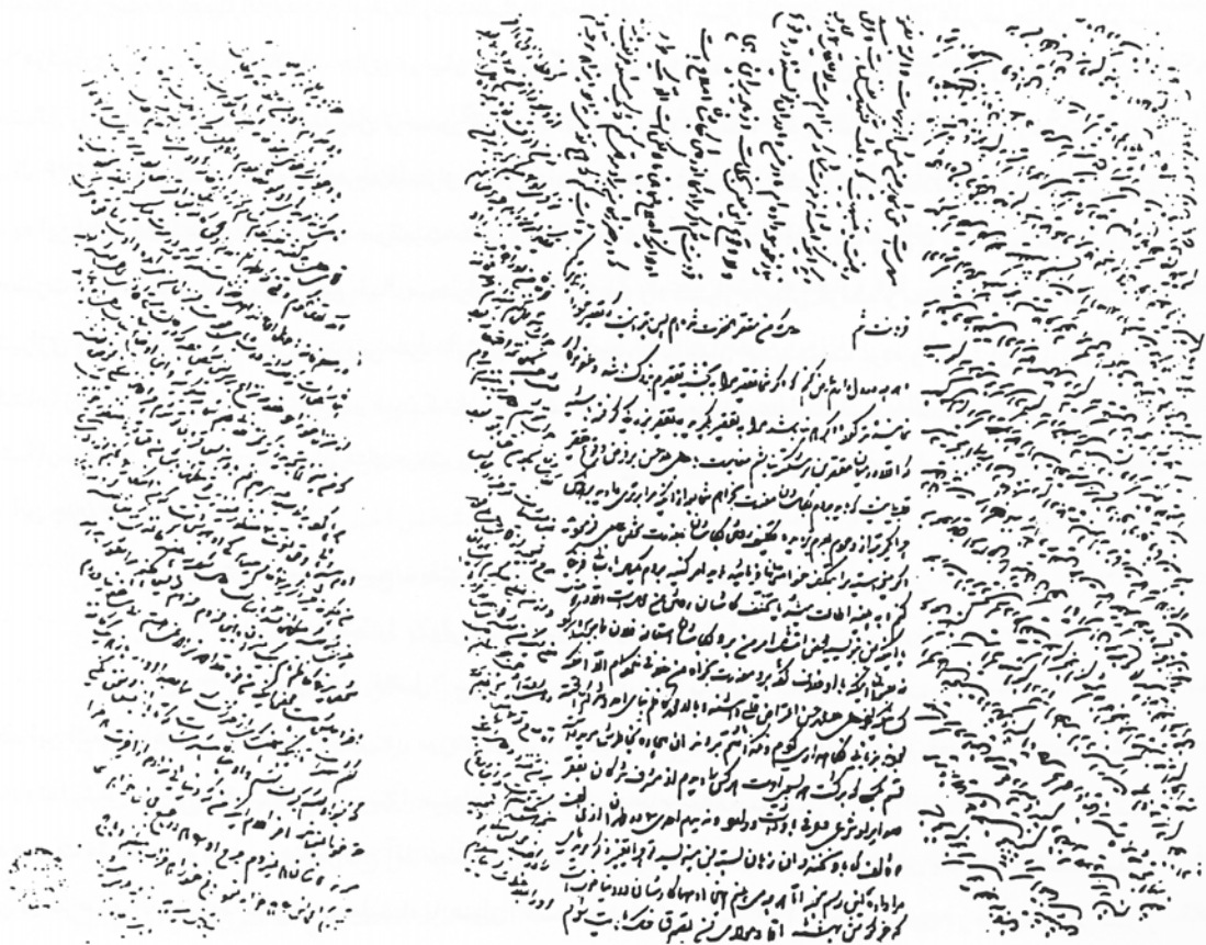
دستخط حاج میرزا حسن اصفهانی (صفی) به منورعلیشاه

با صدور این دستخط، چنین شایع شد که فرمان جانشینی حضرت آقای سعادتعلیشاه منسوخه است، و حاج آقا محمد منورعلیشاه جانشین حضرت رحمتعلیشاه می‌باشد و فقرا باید با ایشان تجدید بیعت نمایند. به این ترتیب ابتدا برخی از مشایخ سلسله - مانند عبدالعیشاه- و سپس عموم فقرا با جناب حاج آقا محمد منورعلیشاه بیعت کردند و بدین ترتیب شکاف بزرگی در سلسله پدید آمد. از این تاریخ سلسله نعمت اللهیه که به دو شعبه کوثریه و مستعلیشاهیه تقسیم شده بود، به دو شعبه جدید سعادتیه و منورعلیشاهیه انقسام یافت. البته پیروان جناب حاج آقا محمد منورعلیشاه بسیار زیاد بودند، و بر عکس ایشان، حضرت آقای سعادتعلیشاه اصفهانی مدتها مشایخی تربیت نمودند.