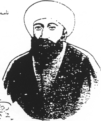
رست علی شاه