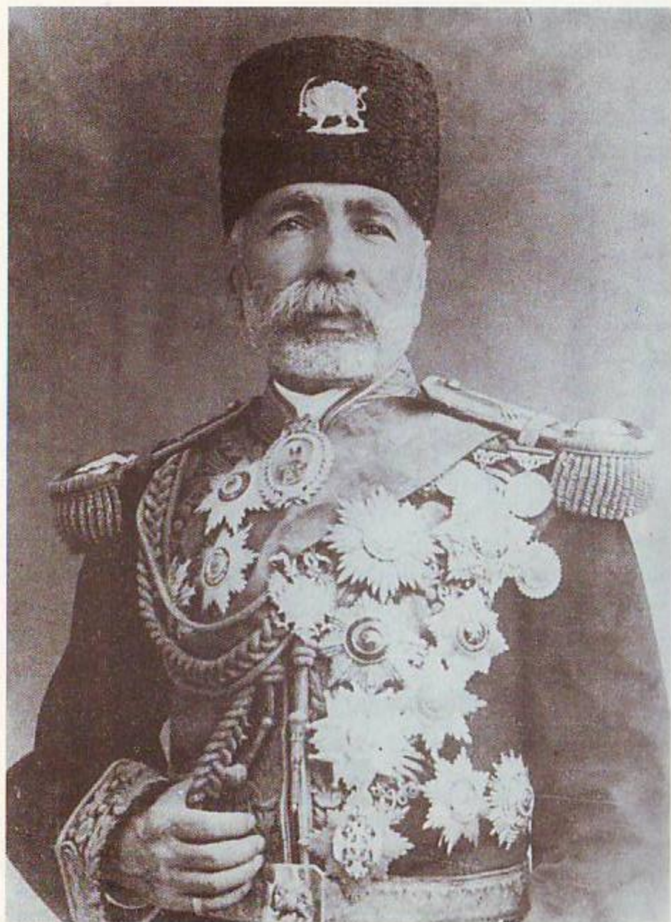
... باری علاء الملک وزیر علوم به حالت شکایت رفت حضور شاهنشاه و اثری هم بر آن مترتب نشد. (ص ۷۹)