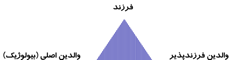
شکل ۱-۱، مثلث یا اجزاء سه گانه فرزندپذیری

این اهداف می تواند متنوع و گسترده باشند اما بهترین هدف برای کودک « مراقبت» و رفع نیازهای اساسی است که این می تواند همراه با شناخت و آگاهی کودک یا غیر آن باشد. برای والدین فرزندپذیر این هدف، همان فرزندپذیری، تجربه والدینی و پاسخ به فقدان هایی است که تجربه کرده اند. برای والدین زیستی رهایی از یک فشار روانی بزرگ که معمولا بارداری ناخواسته به آنها تحمیل می کند از مهمترین هدفهایی است که آنها دنبال می کنند. در کشور ما ممکن است، والدین اصلی مستقیما در فرایند فرزندپذیری حضوری نداشته باشند. با این حال فرزندپذیری با روش های مختلفی اتفاق می افتد که برخی مشخصه ها منجر به تفکیک و تقسیم بندی آن می شود. اینکه چه کودکی و با چه مشخصاتی به فرزند سپرده می شود یا اینکه این کودک از چه مسیری و به چه نحو به فرزند سپرده می شود، تعیین کننده نوع فرزندپذیری است.