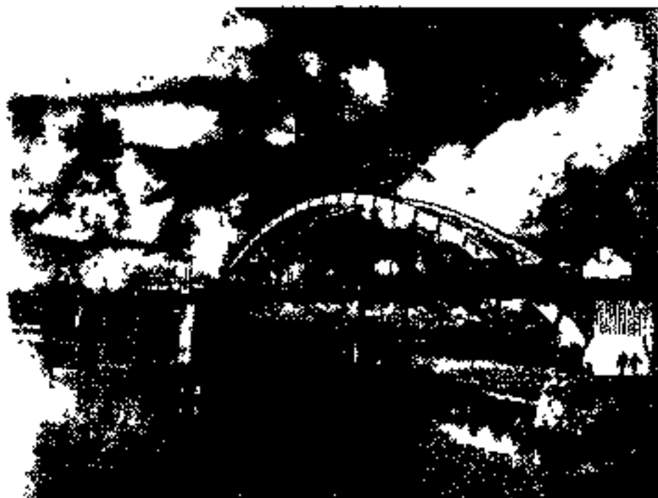
« پل فلزی، اهواز »

با ابتداء سده ۱۳۱۵ هجری قمری ، دروست وسی و پنج پل بتوسی مصالح و فلزی ساخته شد و پس عازیان و میان پشته و بند پهلوی دوپل متحرک را گردیدند است بیش از یک هزار و دوست و بیست پل تمام سنگی و پل سنگی سقف آجری و ۳۴۵ پل آجری و عده کثیری پلهای کوچک روستائی باشدند است همچین