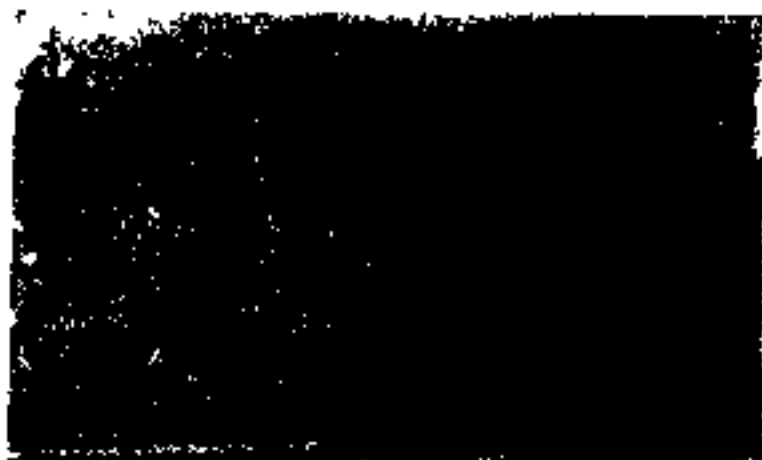
« بانک ملی ایران »

چون دوره ضعف سپری و عظمت ایران تجدید گشت آرزوی ملت ایران بر آورده شد و در ۱۴ اردیبهشت ۱۳۰۶ شمسی قانون تأسیس بانک ملی برای پیشرفت امر تجارت و اصلاح و زراعت و صناعت بتصویب مجلس رسید در ۱۷ شهریور ۱۳۰۷ مؤسسه مذکور در ظل نوجبات شاهنشاه ایران تأسیس گشت .