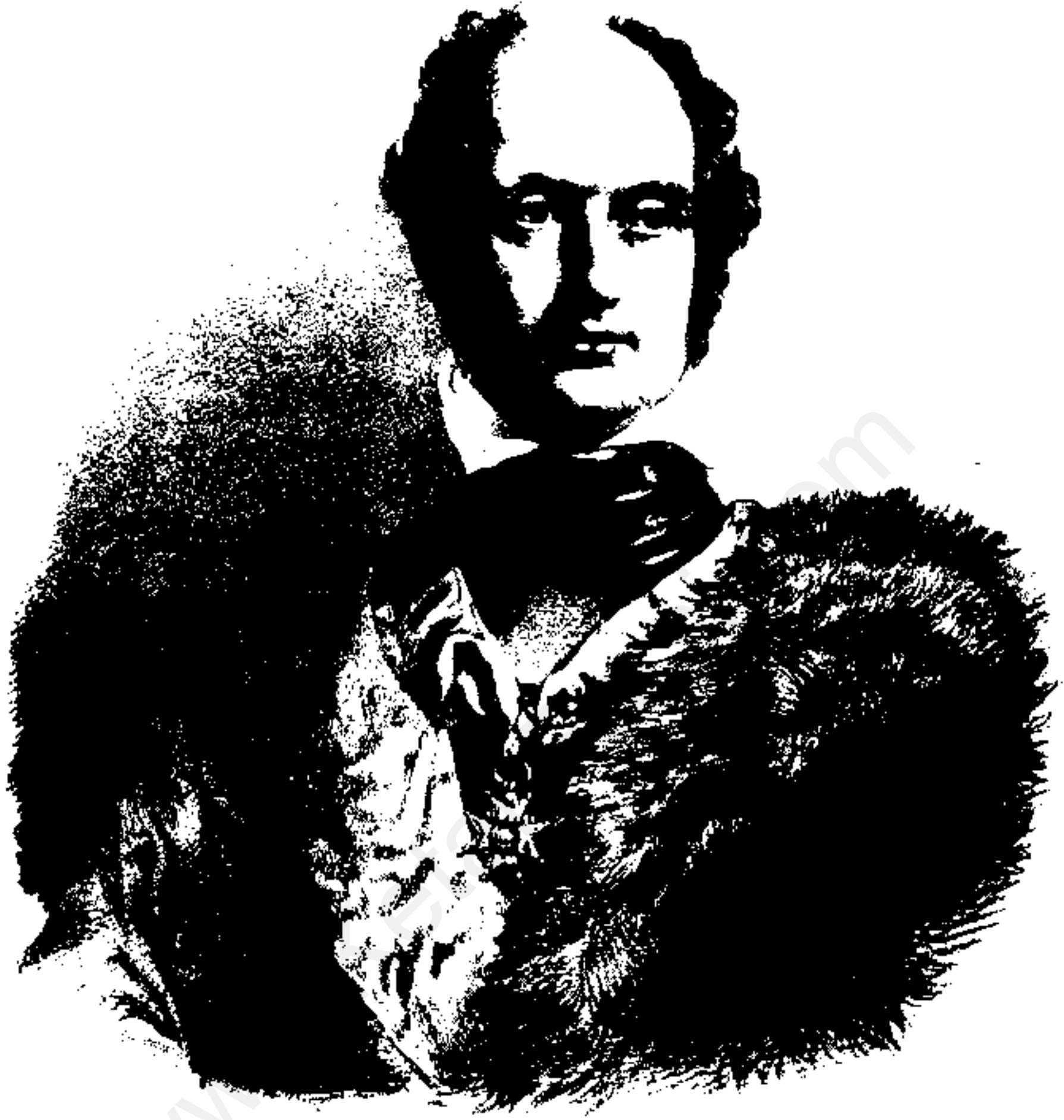
سرجان مالکوم فرساندهی کمپانی هند شرقی