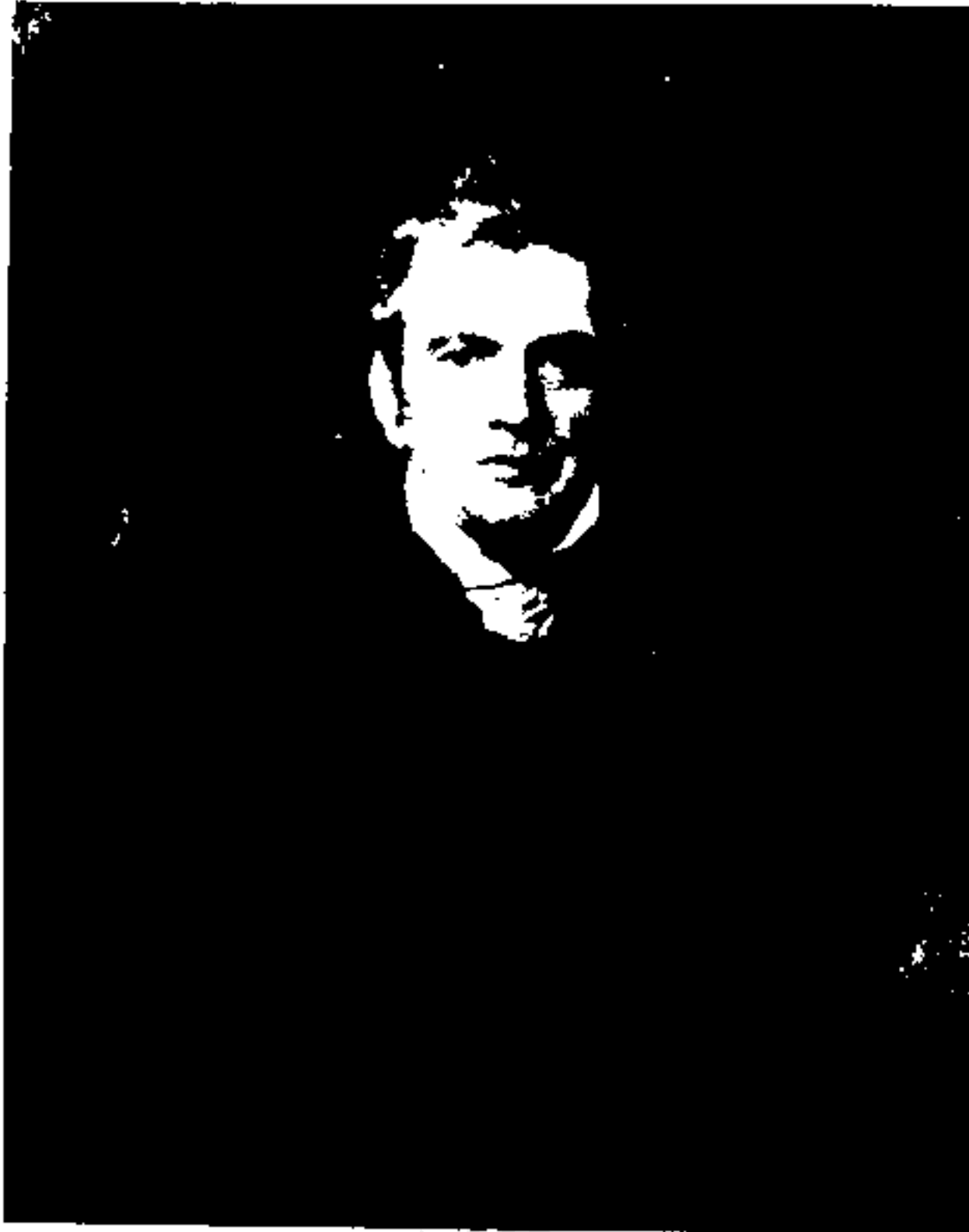
هارفورد جونز فرستاده‌ی ویژه و وزیر مختار