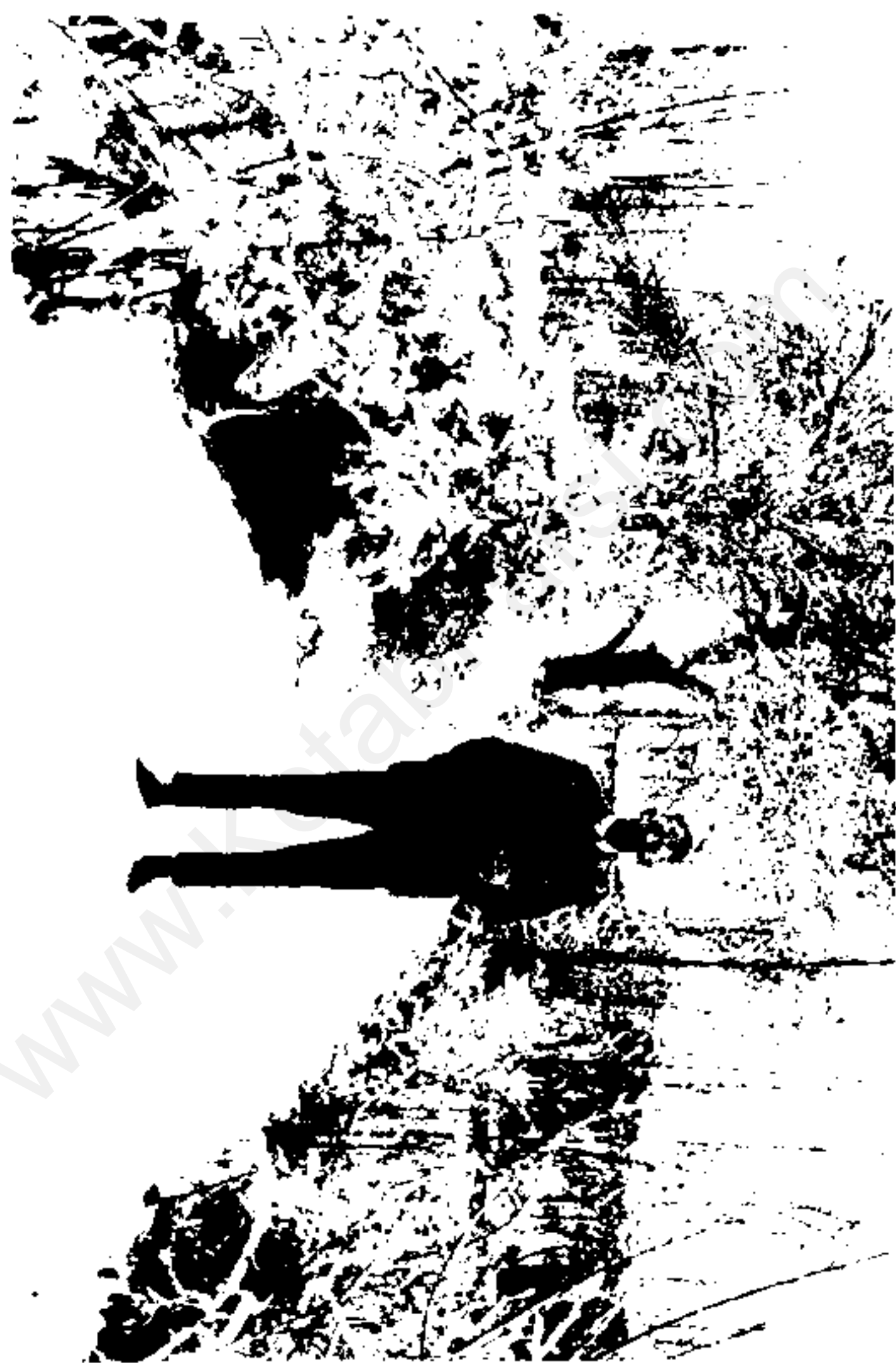
دیوید لاکهارت و ایرتسون لاریس کسول