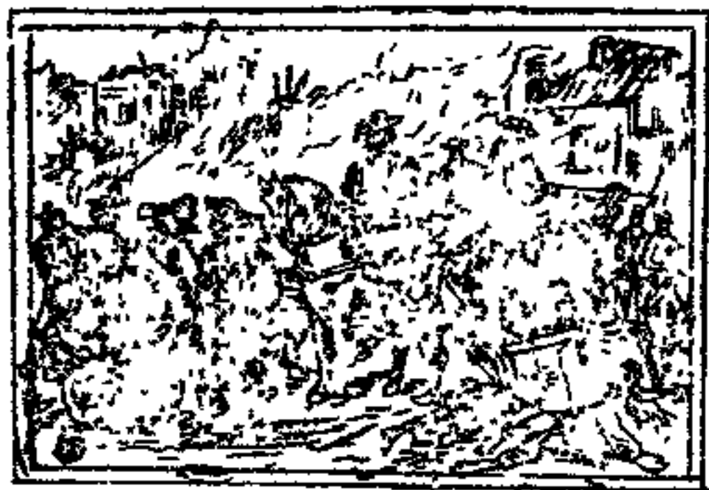
سوم جنگ سی ساله

حاکم شارلکن چه از قماره کردن او از سلطنت چه شد منزل غیبی ویم در کدام مقصودش چه بود با پروتستانها چه قسم رفتار میکرد