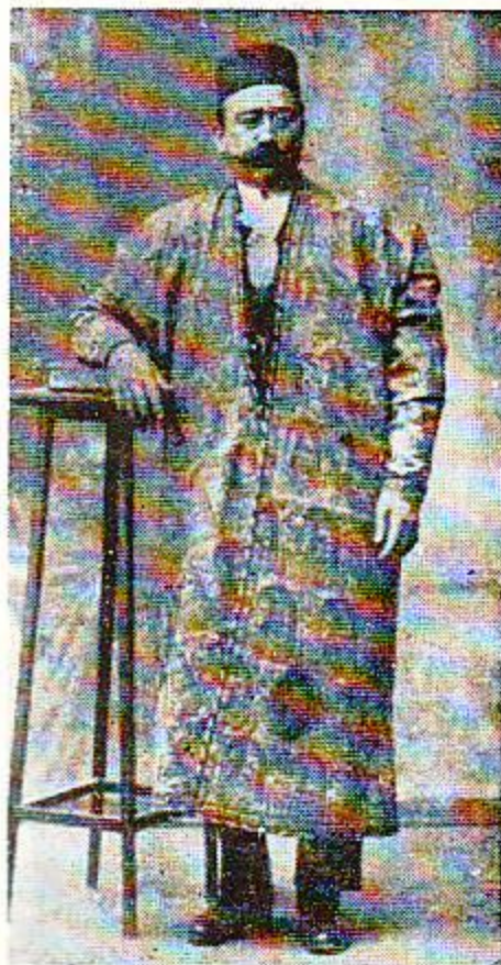
مرحوم میرزا سلیمانخان میکده

پای ستارخان در نتیجه تیری که برداشته بود بکلی بهبودی نیافت و بزحمت می‌توانست راه برود.