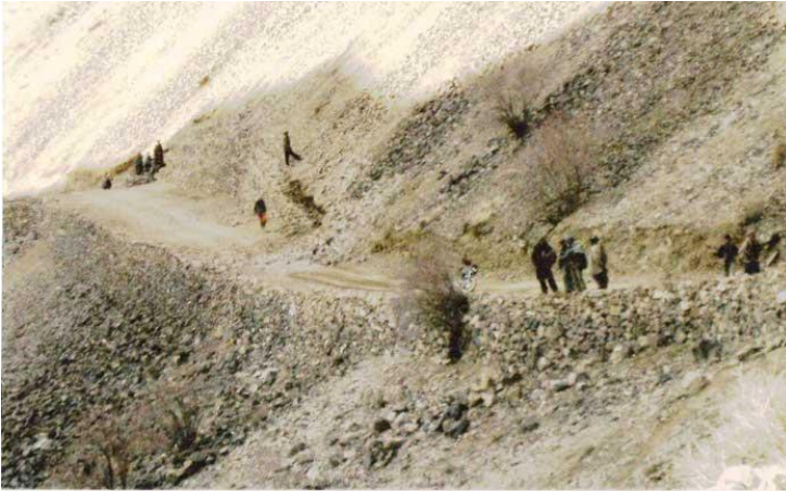
نمایی از هموارترین منظره دره جام.