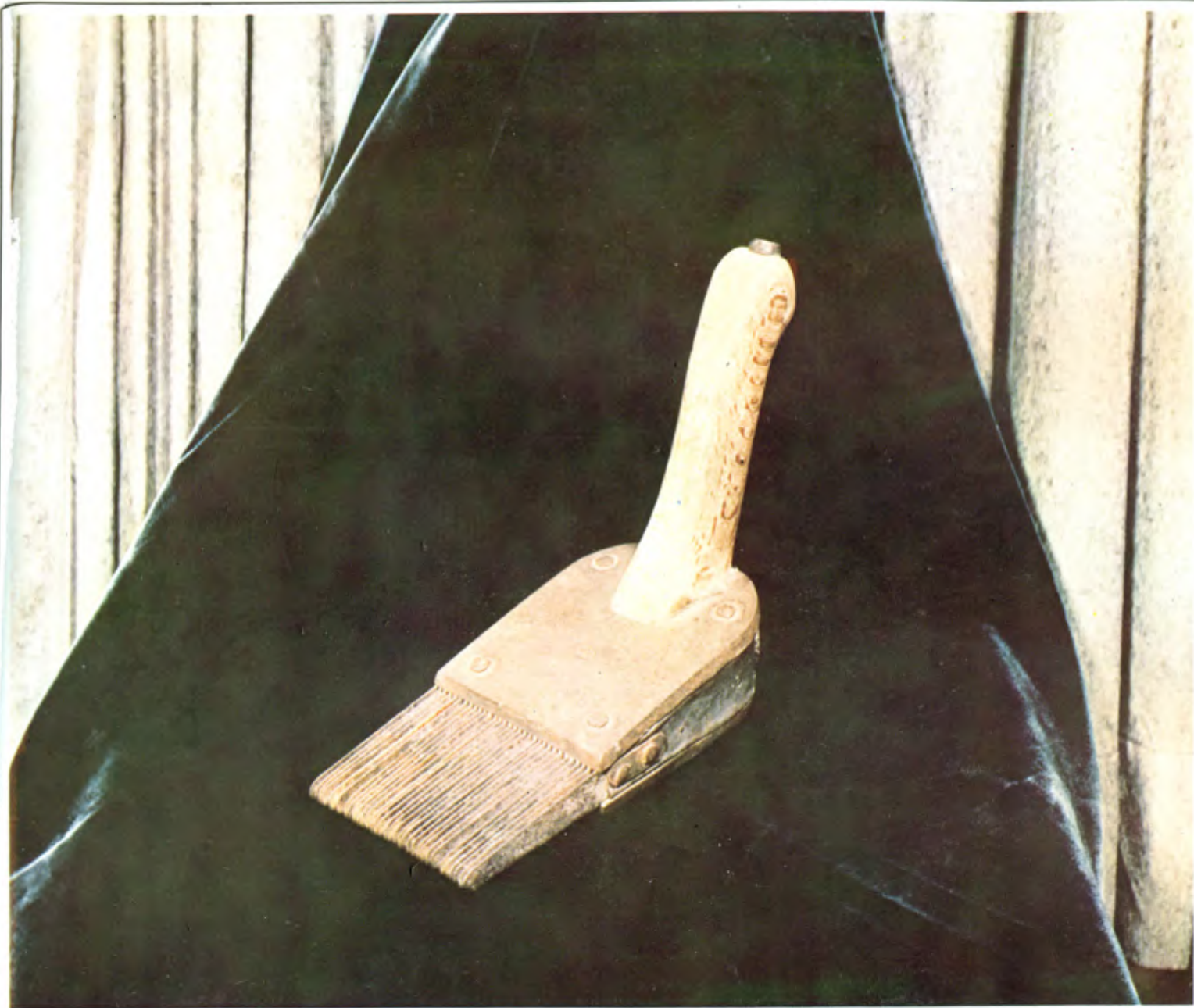
عكس ۰۸ كلوزار