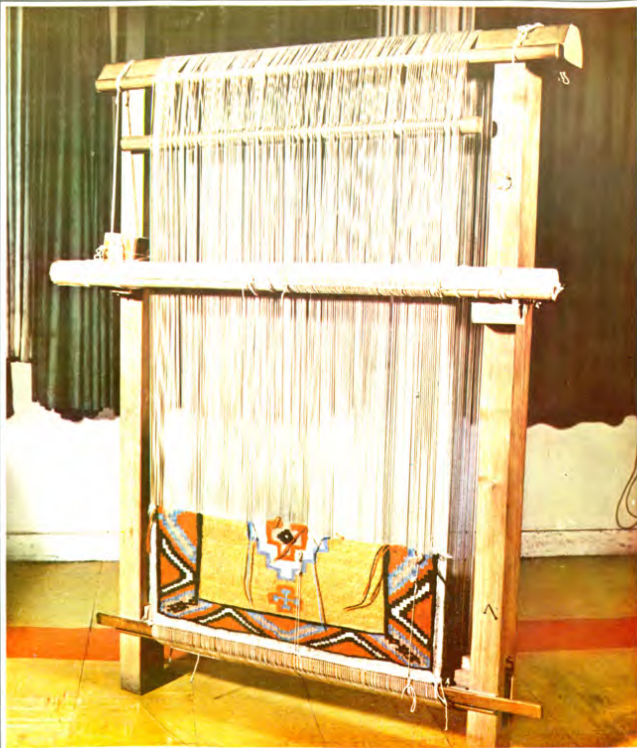
عکس ۱۵۰ کجو و دار گلیم بافی