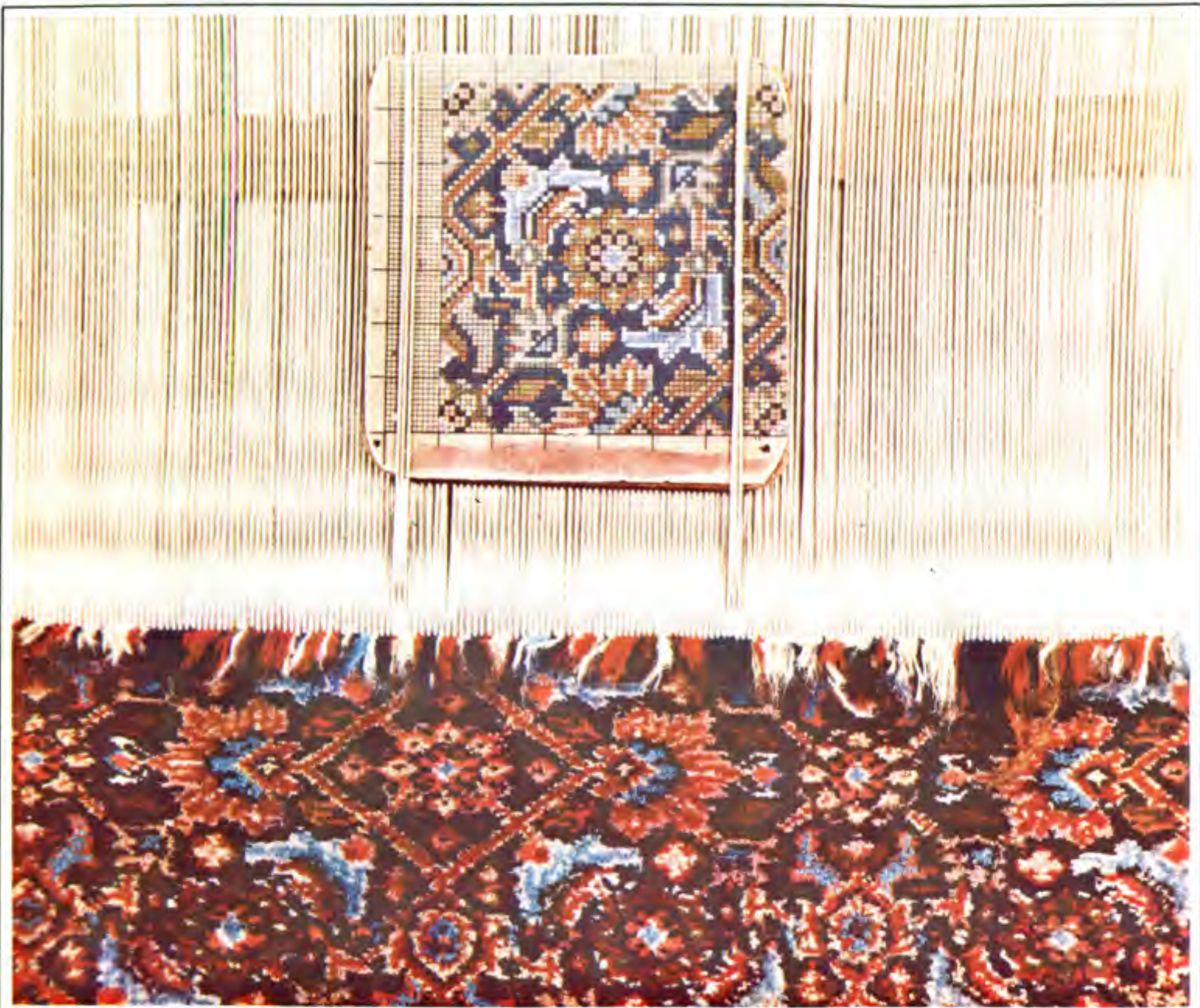
عکس ۱۳ . نقشه تکرار شونده