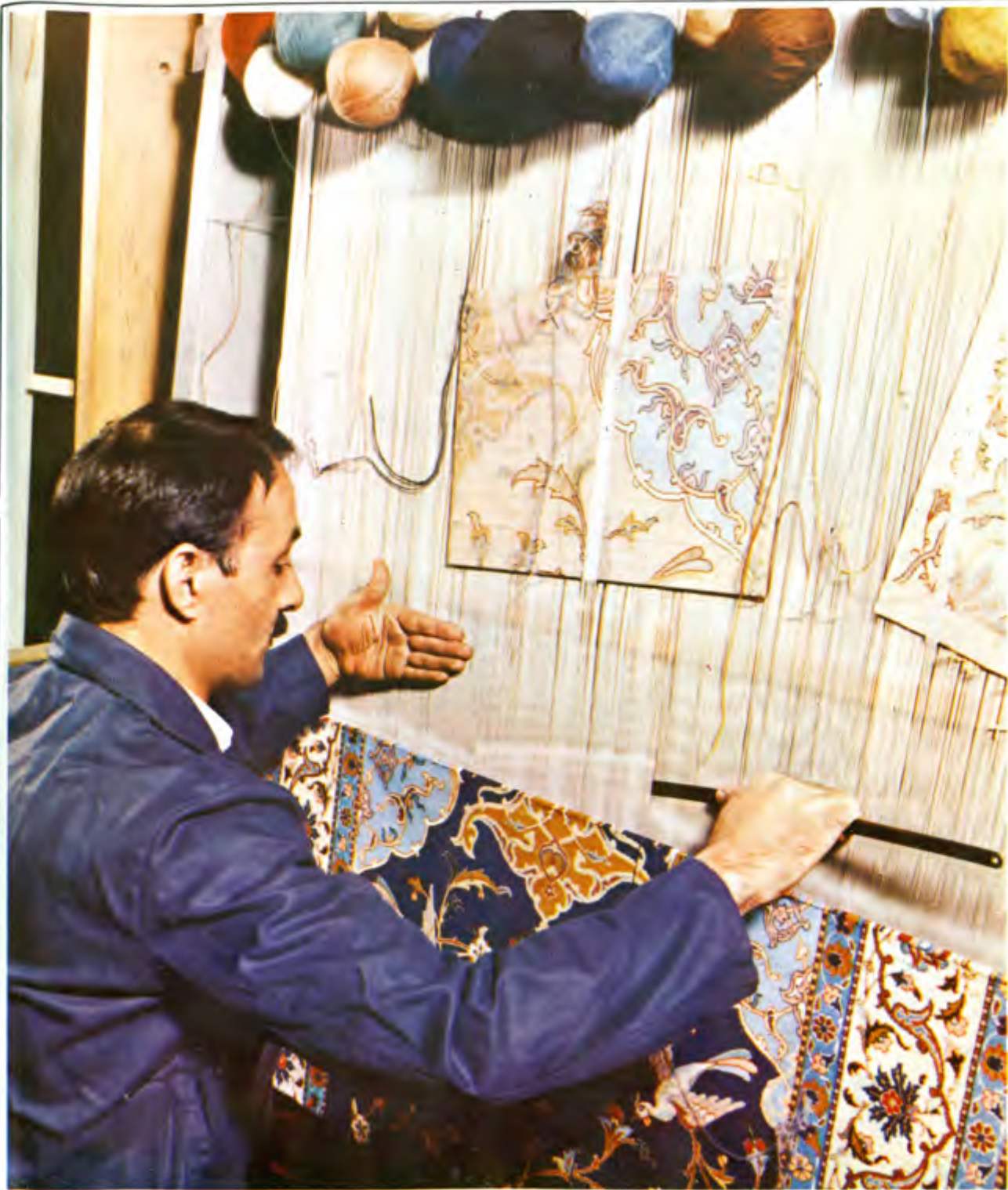
عكس ۰۲ نحوه کار با سیخ