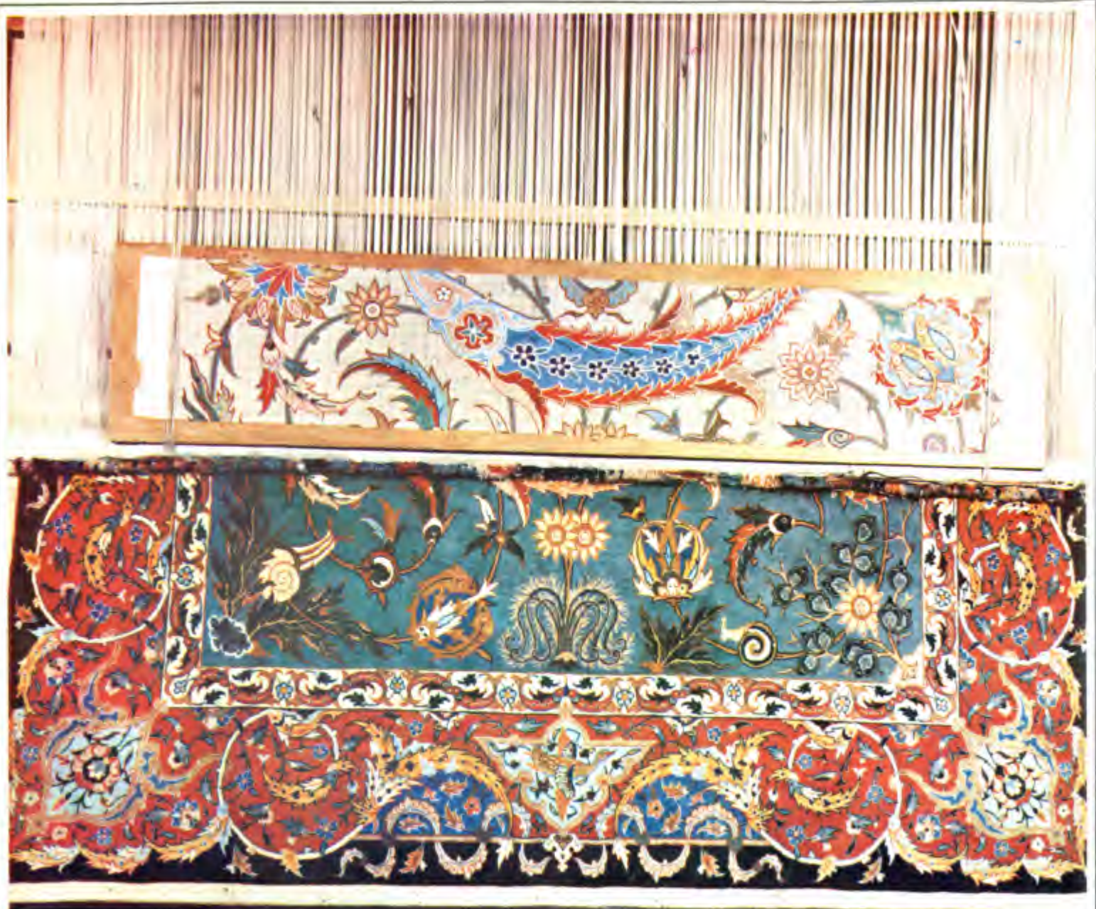
عکس ۱۱ نقشه جزء به جزء کار