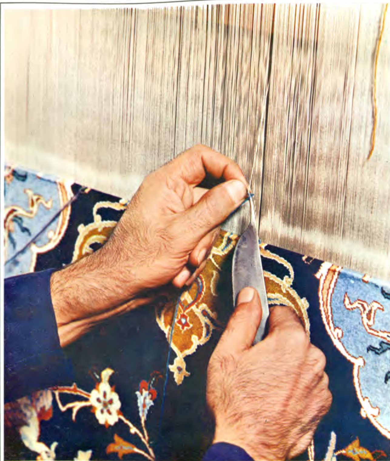
عکس ۳. نحوه گره زدن با چاقو