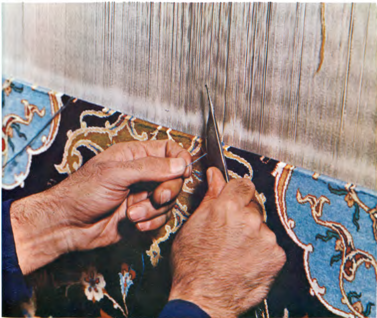
عکس ۴. نحوه بریدن با چاقو