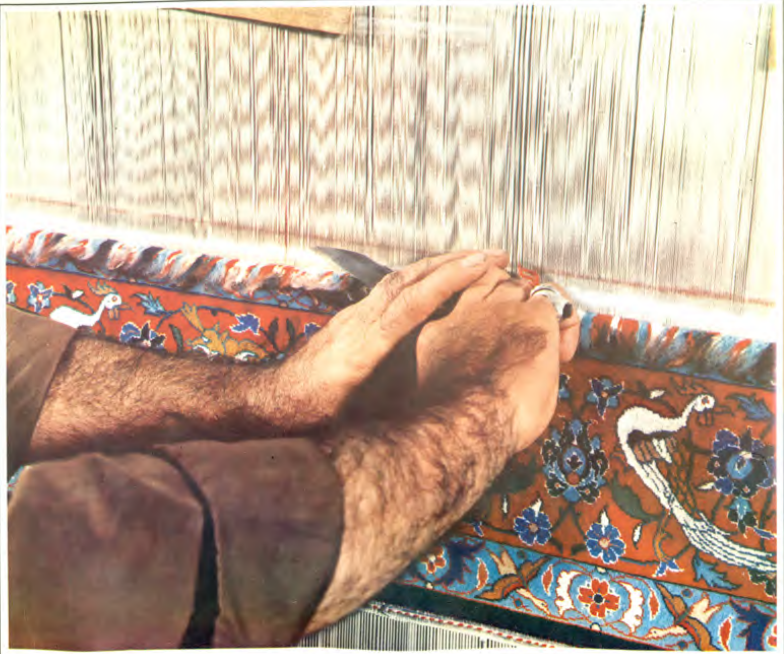
عکس ۷. نحوه برش با قیچی