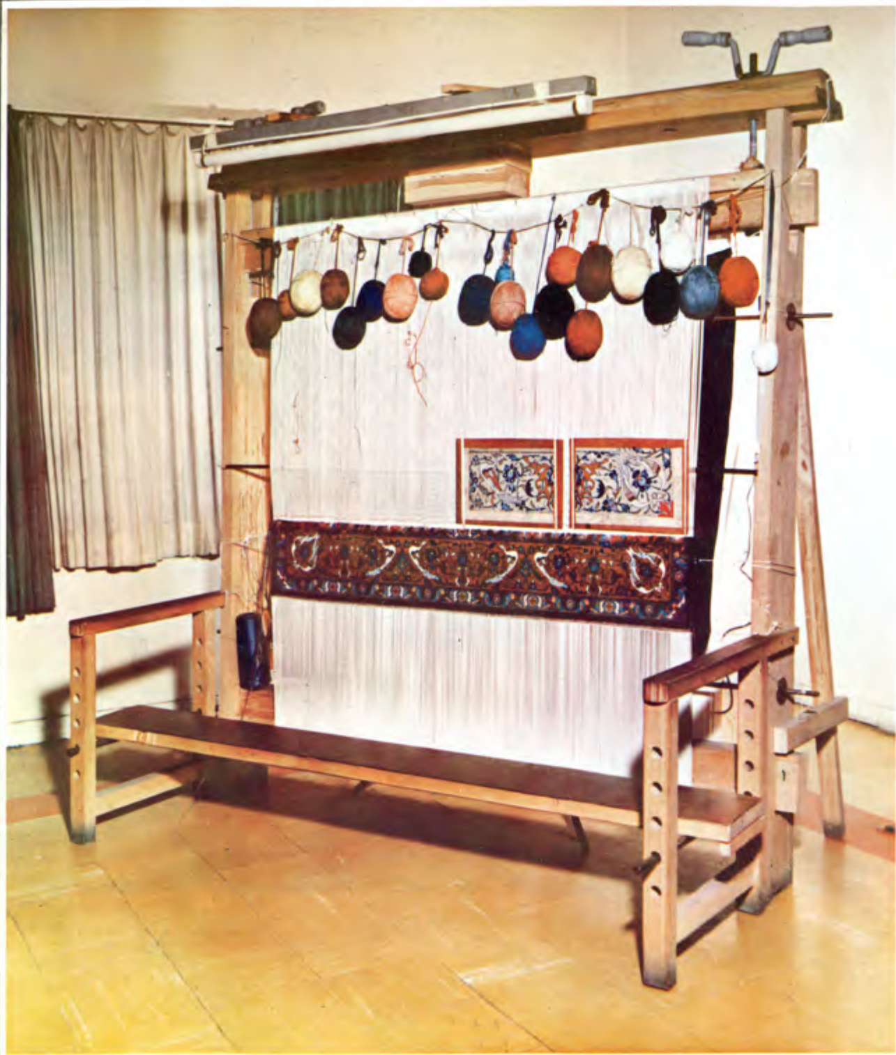
عکس ۹ دار عمودی