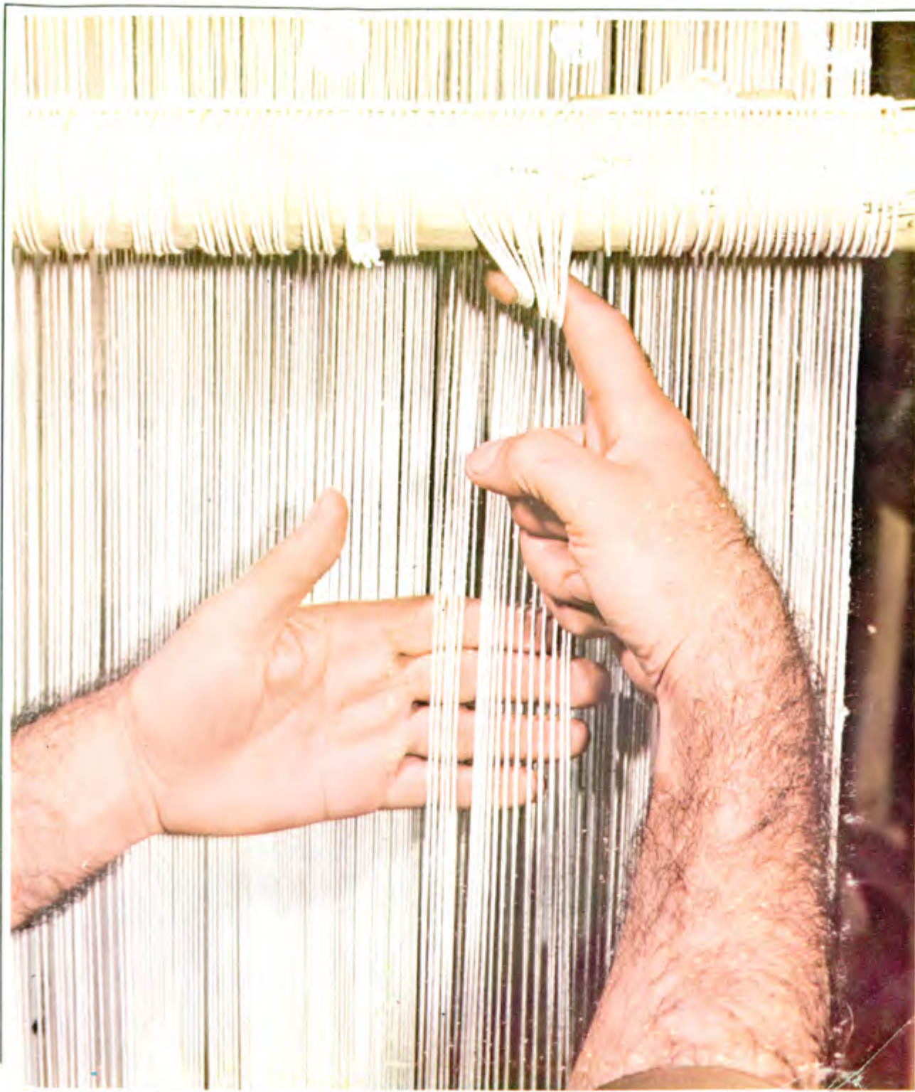
عکس ۰۱۶ کشیدن نخهای کجیو