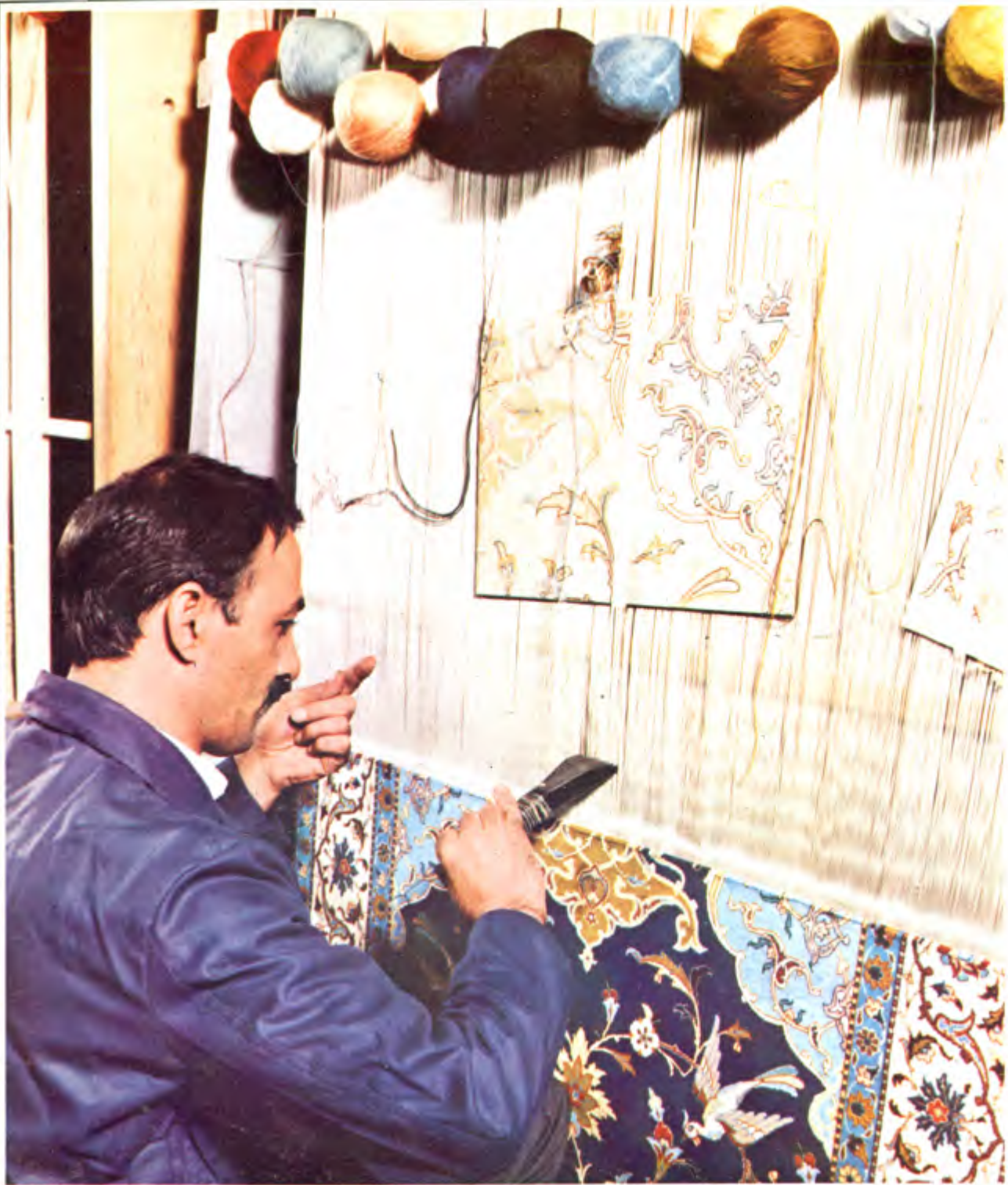
عکس ۵۰ نحوه کار با شانہ