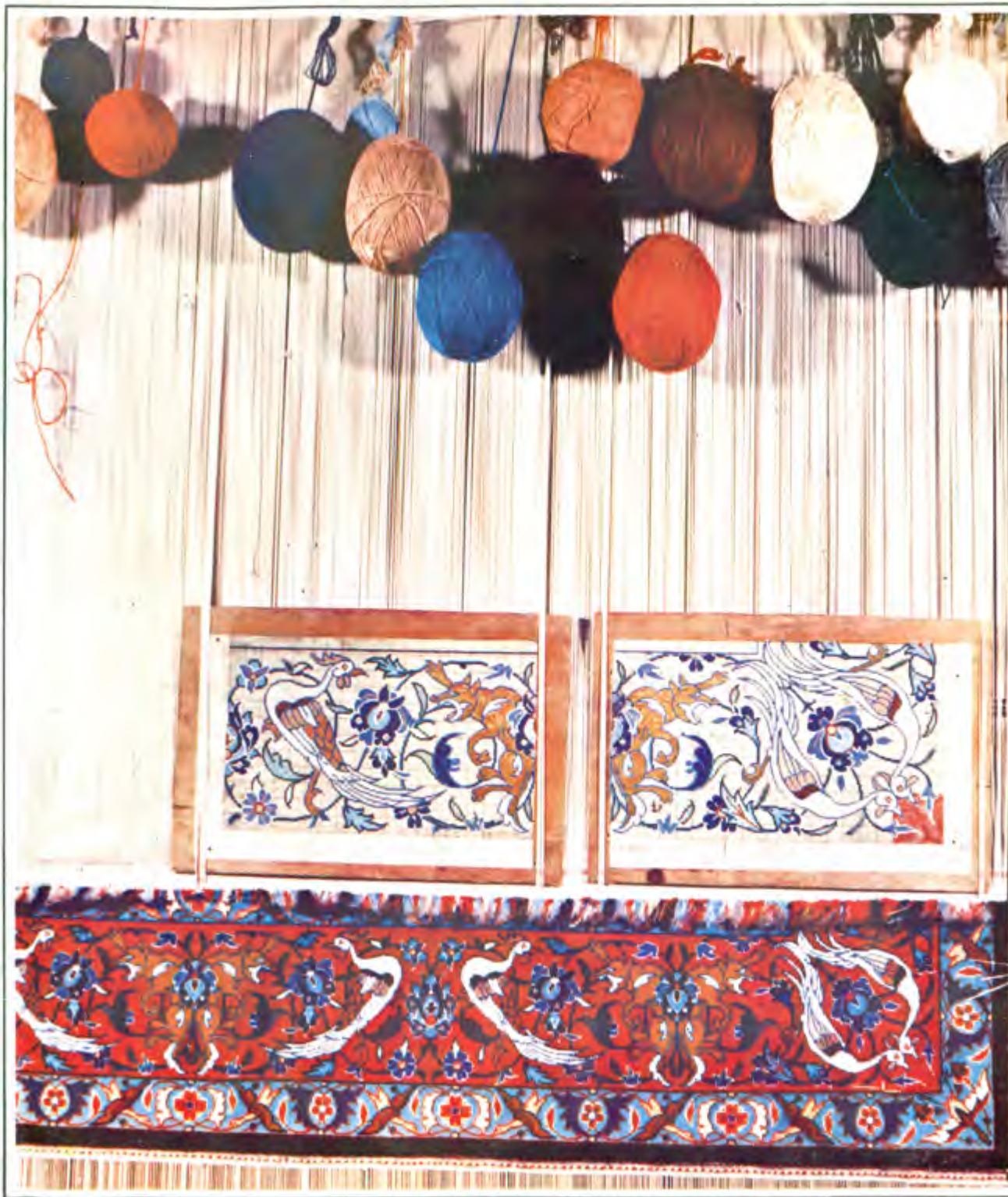
عکس ۰۱۲ نقشه جزء به جزء کار