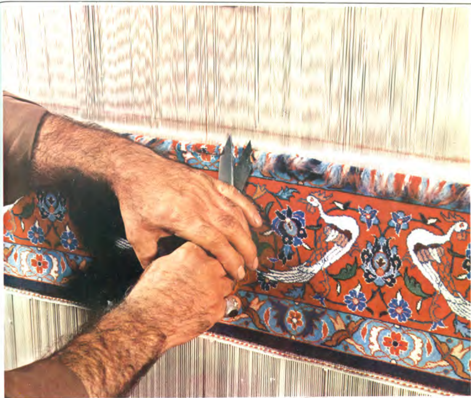
عکس ۰۶ نحوه برش با قیچی