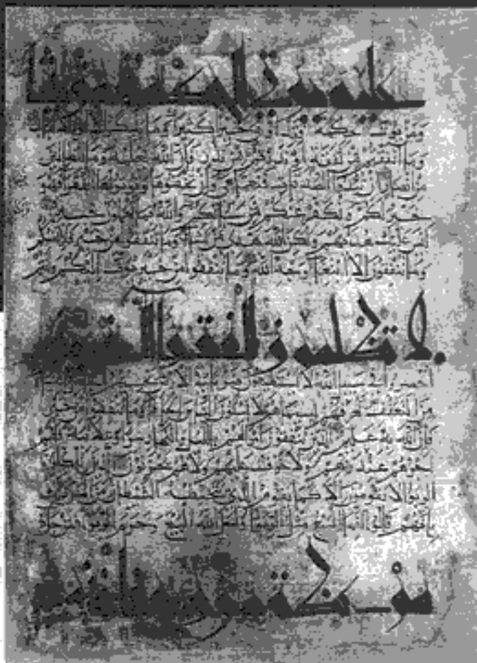
یک برگ از قرآن کریم - توماس نویسی (کوفی و نسخ) قرن پنجم هجری، سوره مبارک بقره، آیات ۲۷۵ و ۲۷۶ موزه رضا عباسی

مناصحه فرآین ویژه کودک و نوجوان سال اول، شماره دوم و سوم، اسفند ۷۶ و فروردین ۷۷ ۱۵۰۰ ریال