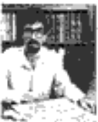
استاد محترم آیت الله العظمی آقا میرزا محمد تقی