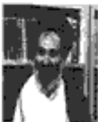
استاد محترم آیت الله العظمی آقا میرزا محمد تقی