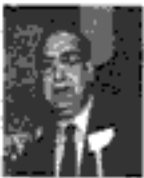
استاد محترم آیت الله العظمی آقا میرزا محمد تقی