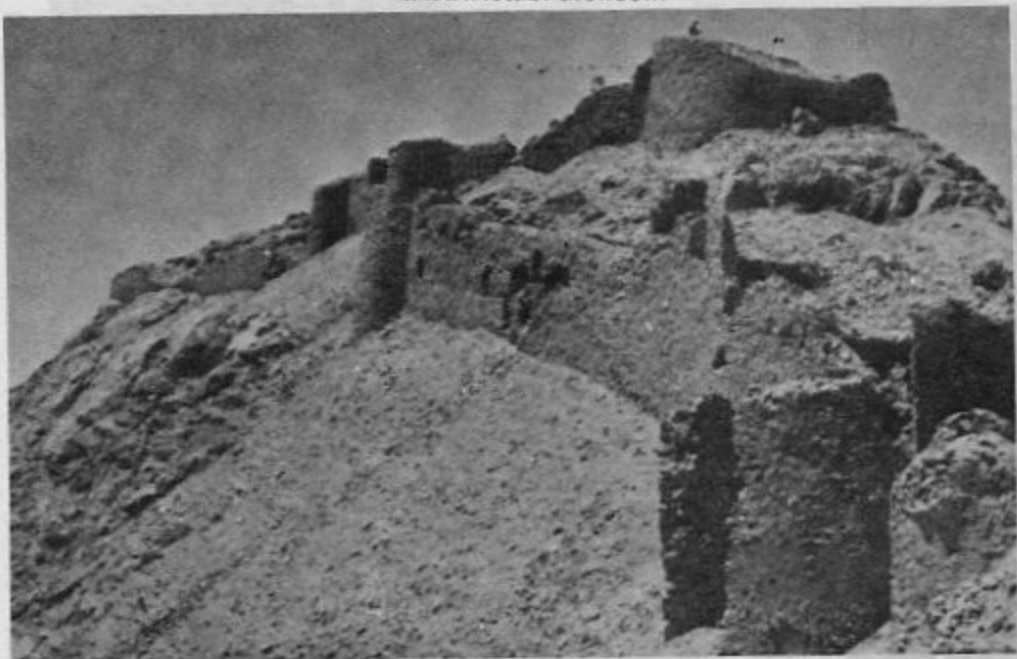
۶- منظره نزدیک تری از دیوارهای قلعه قائن