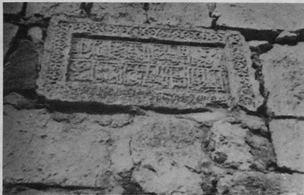
۸- کتیبه‌ای بر دیوار قلعه مصیاف در شام، از قرن سیزدهم (ششم هجری)