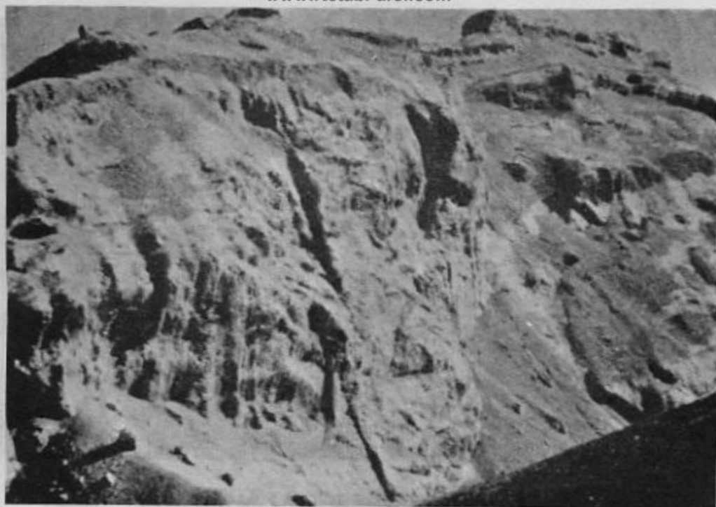
۴- صخره الموت که قلعه الموت بر تارک آن است