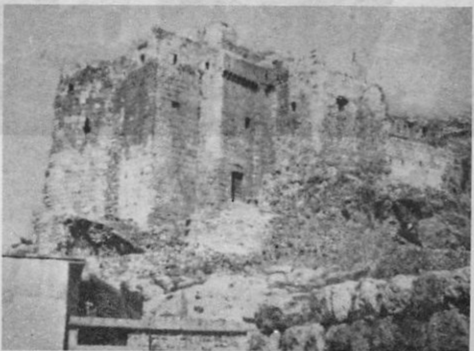
۳- قلعه مصیاف