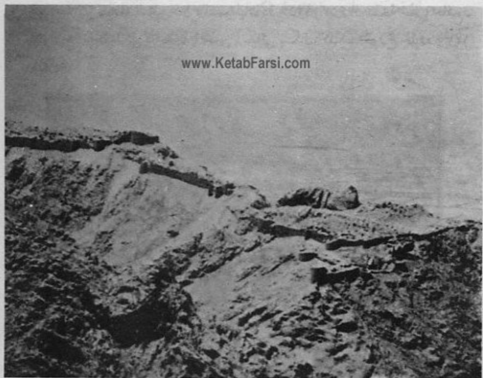
۹- منظره هوایی قلعه عظیم فدائیان در قائن