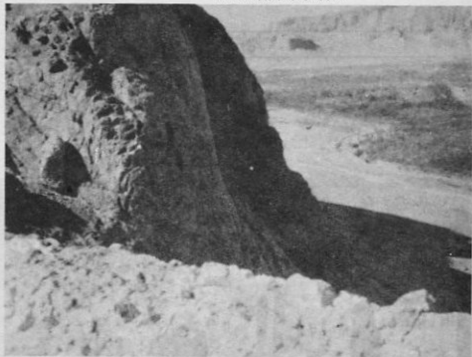
۲- نمای دره از قلعه بزی، نزدیک اصفهان