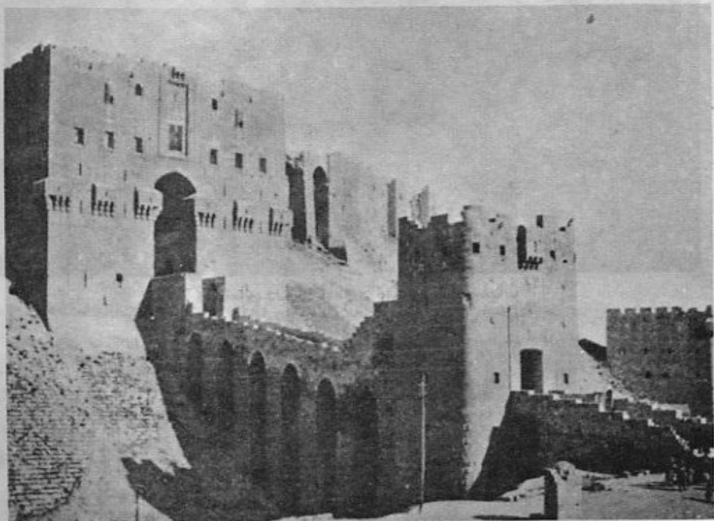
۱- مدخل ارگ حلب