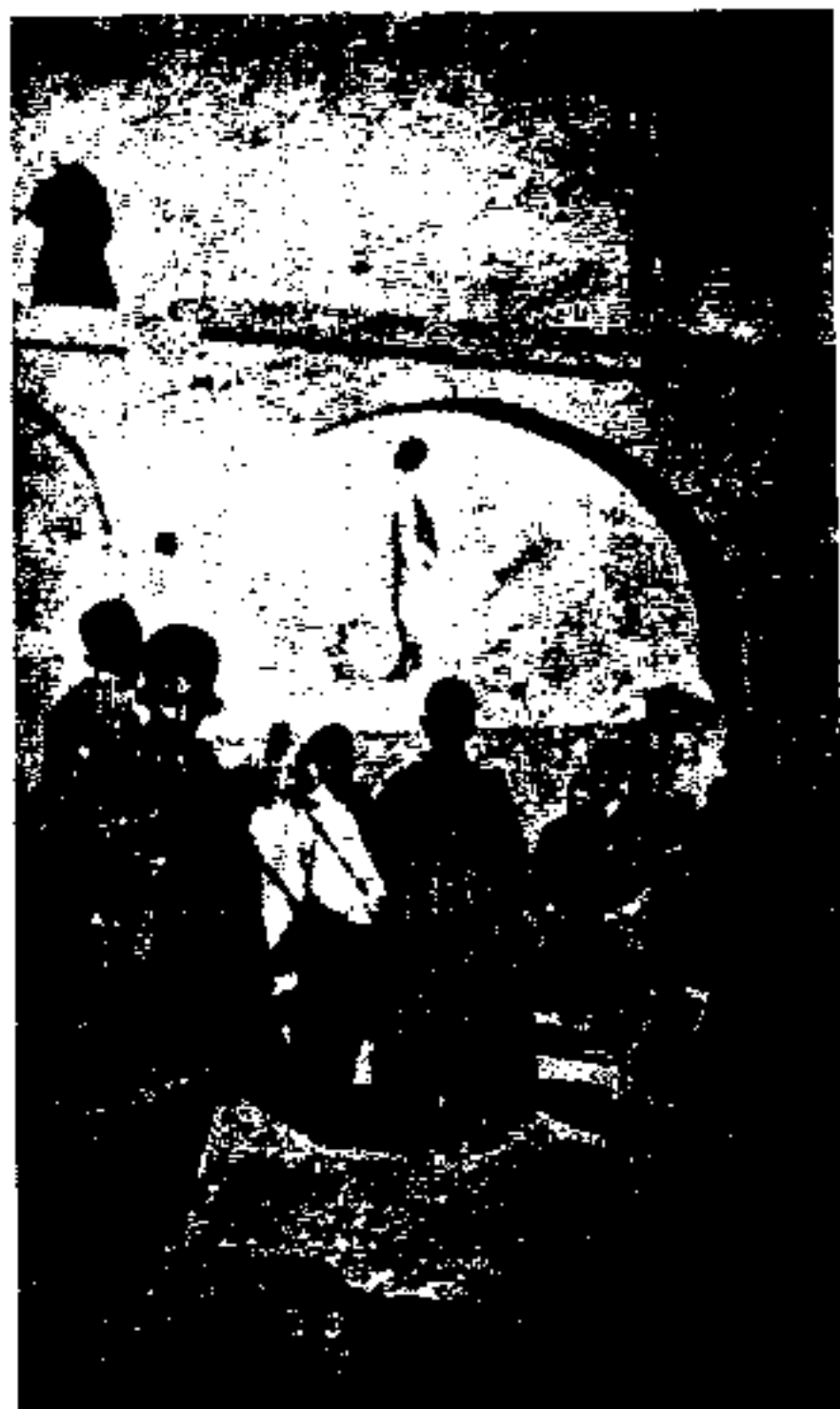
اسماعیل خان مجاهد که در دوره استبداد صغیر به دستور محمدعلی شاه بر در دروازه باغ شاه به دار آویخته شد.