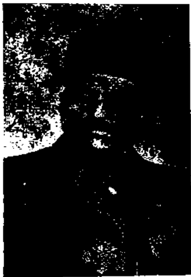
سردار ظفر بختيار