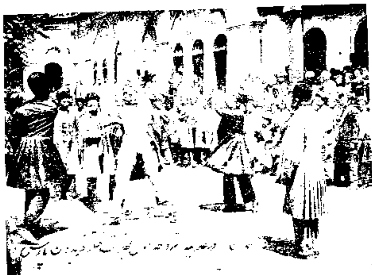
مجازات کشندگان ارباب فریدون به دستور محاکم عدلیه در دوران مشروطیت.