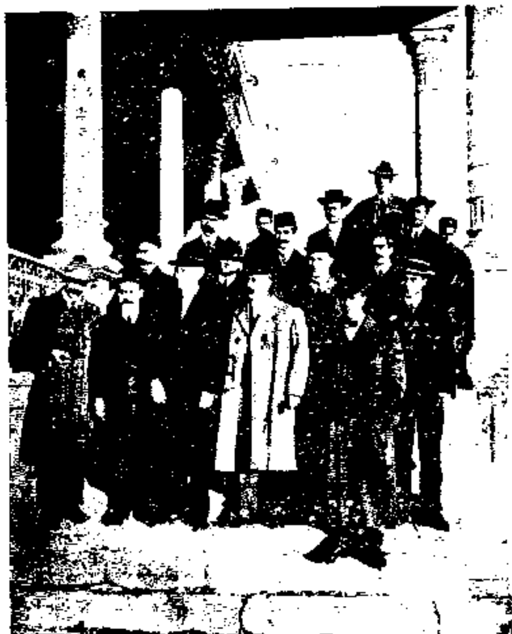
مورگان شوستر ویرم تخان باتنی چند از مجاهدین و اعضاء خزانہ