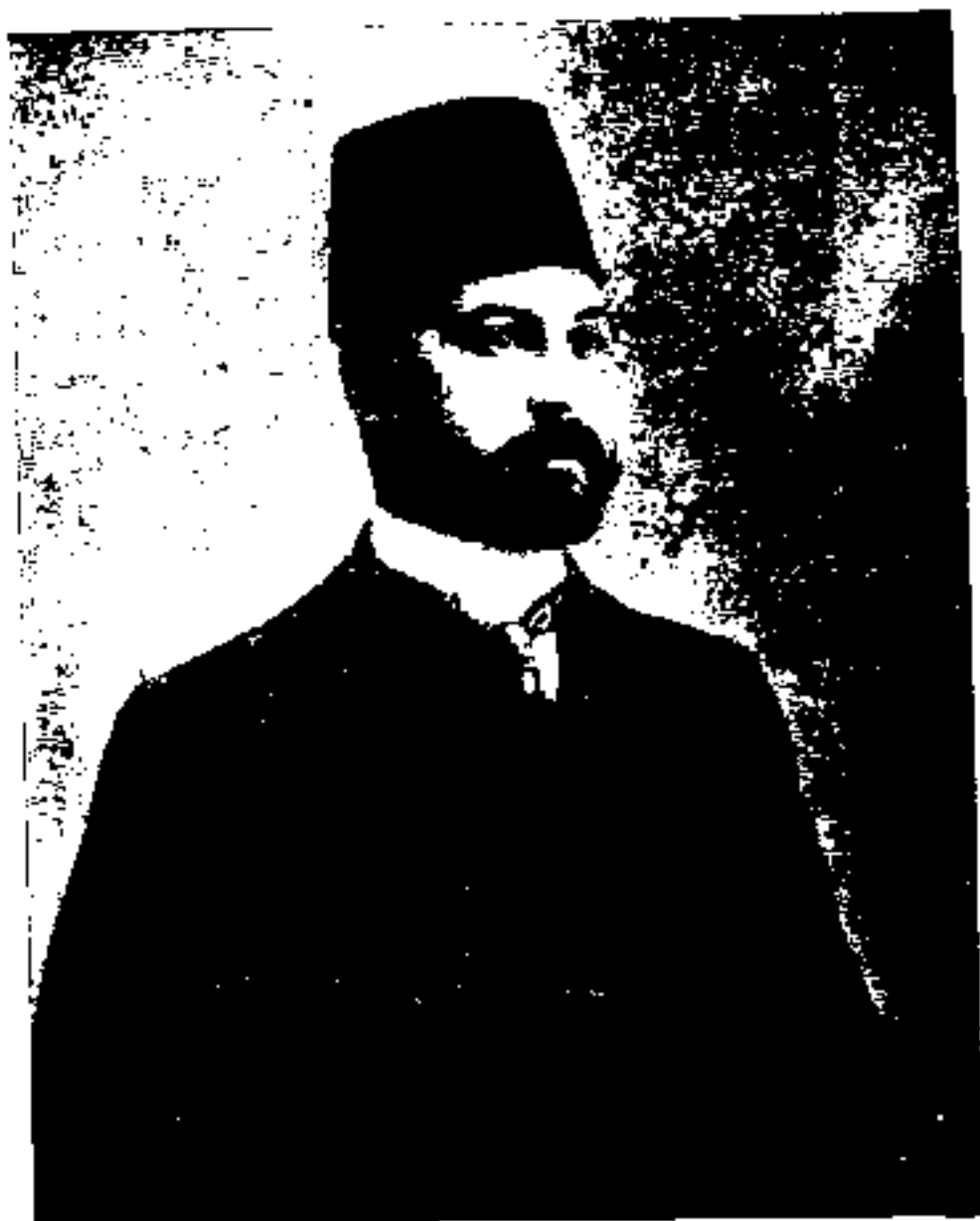
— ﴿﴾ میرزا حسن خان پیرنیا مشیر الدولہ ﴿﴾ —