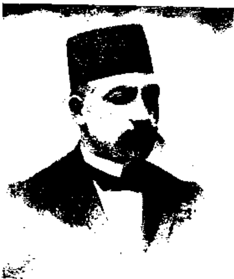
میرزا حسن خان وثوق الدوله

میرزا حسن خسان محنتشم السلطنه که به علت داشتن تمایلات دوستانه به روسهای تزاری مورد کینه و نفرت آزادی خواهان تندرو بود.