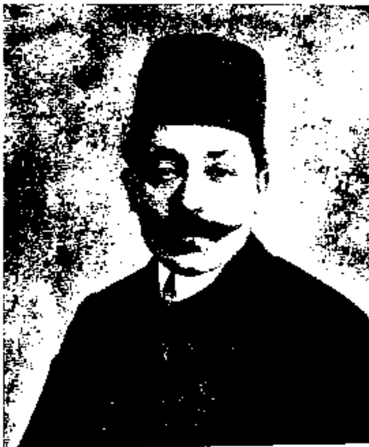
میرزا احمدخان قوام السلطنه