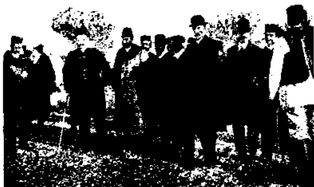
مورگان شوستر و مستخدمین ایرانی و اروپائی خزانه