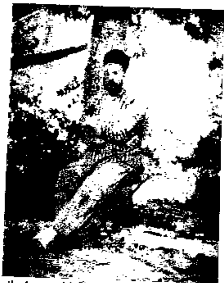
علی خان ارشدالدوله پس از گرفتاری و پیش از