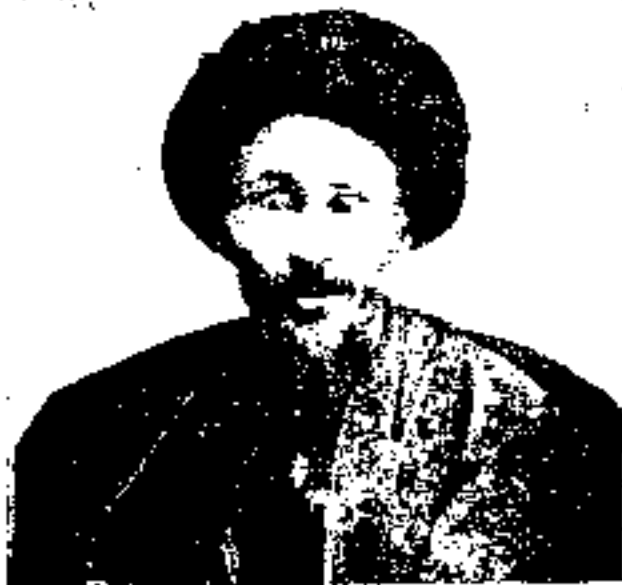
آقا سیدجمال الدین اصفهانی واعظ که پس از بمباران مجلس در بروجرد به دست عمال محمدعلی شاه کشته شد .