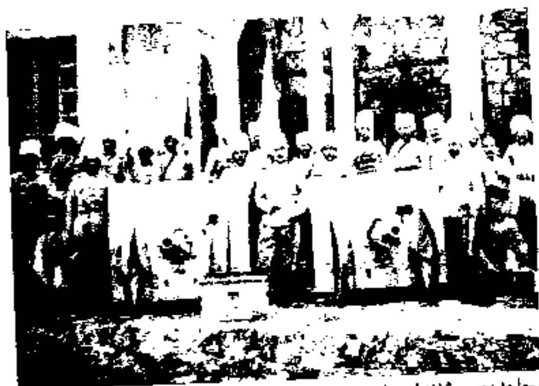
مجاهدین و ژاندارمهای بیرم خان همراه باتویها لحظاتی قبل از حرکت برای جنگ با ارشادالدوله