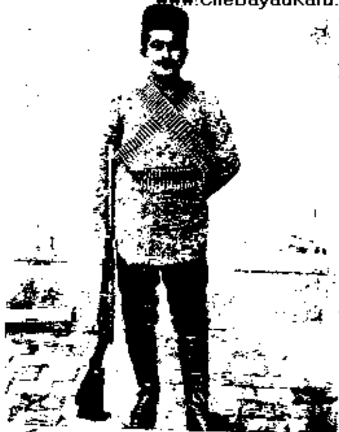
جعفر قلی خان سردار بهادر، بختیاری پس از شکست و گرفتاری علی خان ارشدالدوله