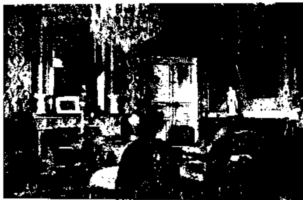
اطاق کار مورگان شوستر در پارک اتابک