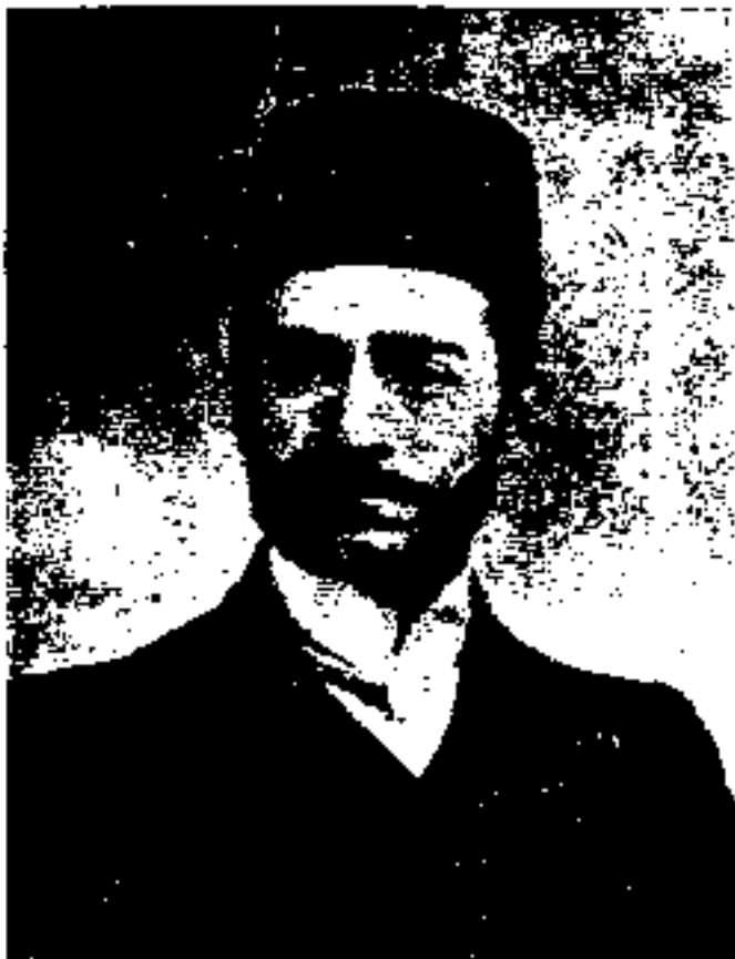
﴿ میرزا اسماعیل خان ممتازالدوله ﴾ از رؤسای مجلس اول