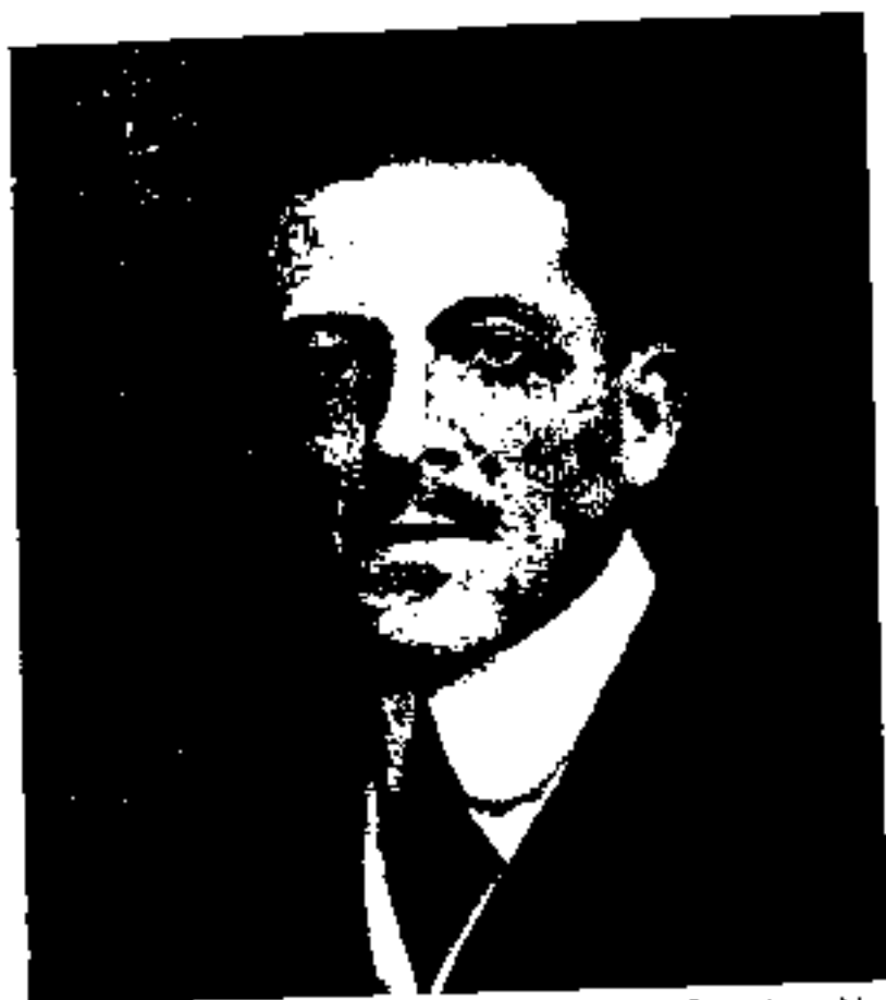
ماژور استوکس افسر هنگه هندوستانی و مامور نظامی