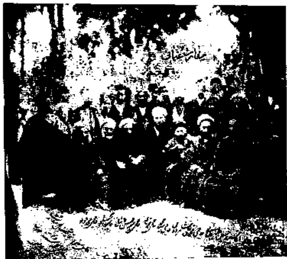
متحصنین سفارت عثمانی