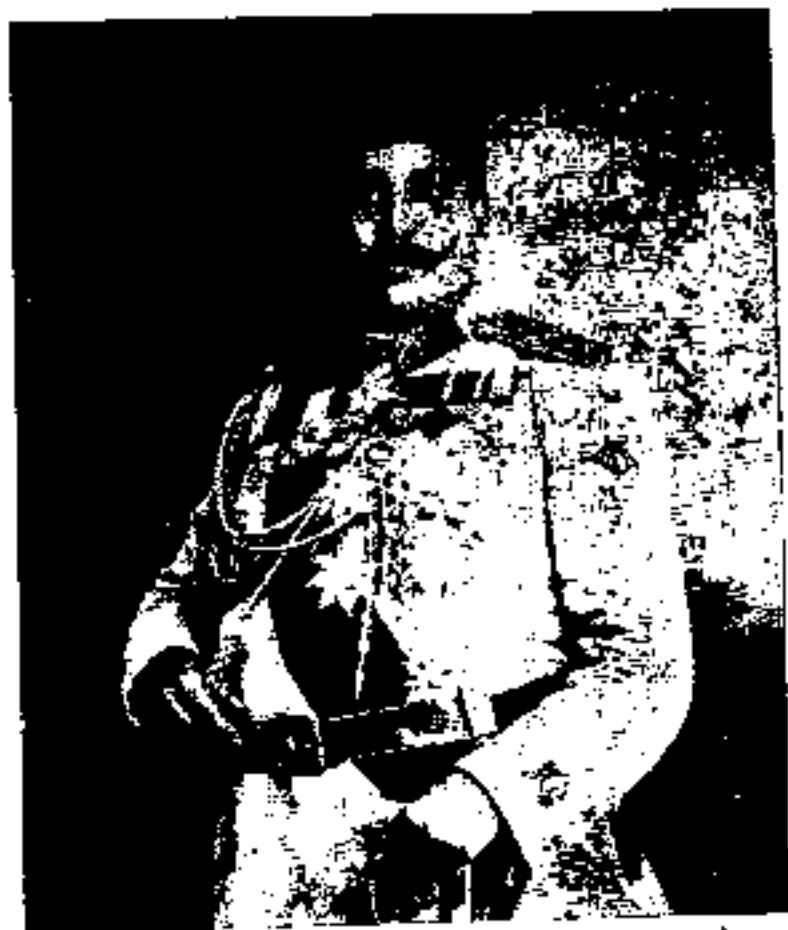
علی خان ارشد الدوله (سردار ارشد) شوهر عمه محمد علی شاه قاجار.