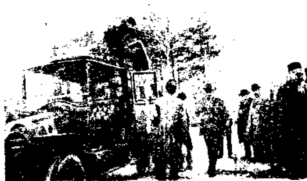
شوستر و خانواده اش هنگام خدا حافظی و حرکت از تهران