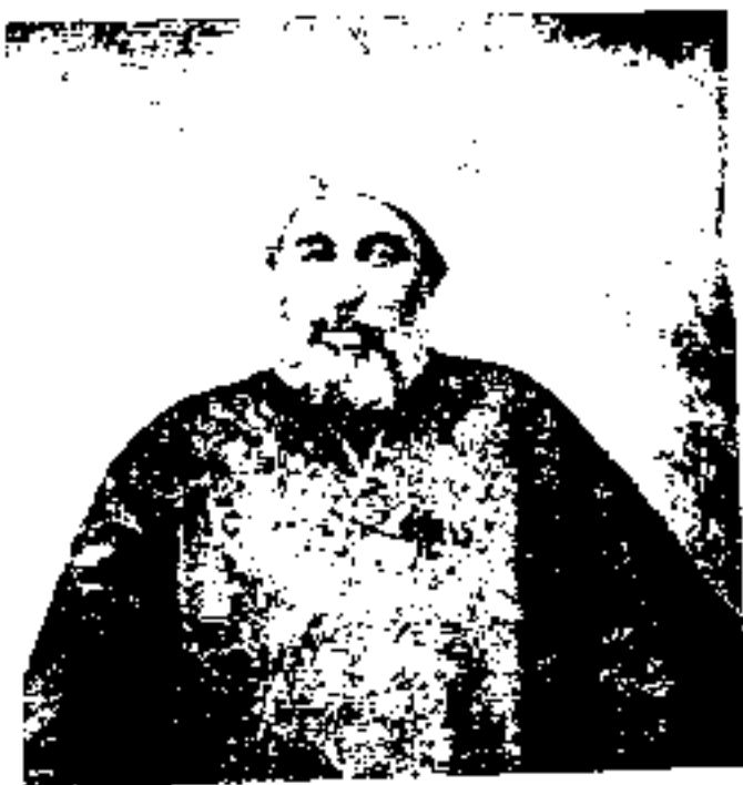
حاجی میرزا نصرالله بهشتی ملك المتكلمين كه روز دوم بمباران مجلس درباغ شاد به امر محمدعلی شاه كشته شد .