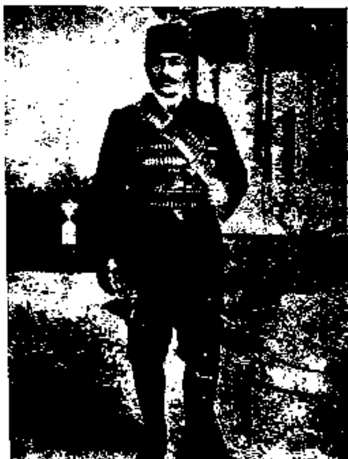
عبدالحسین خان سردار محیبی (معز السلطان)