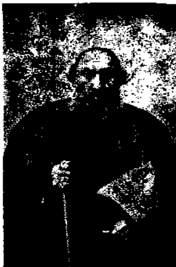
﴿ حاج شیخ فضل الله توری ﴾

که پس از فتح تهران، به جرم همکاری با محمدعلی شاه کشته شد.