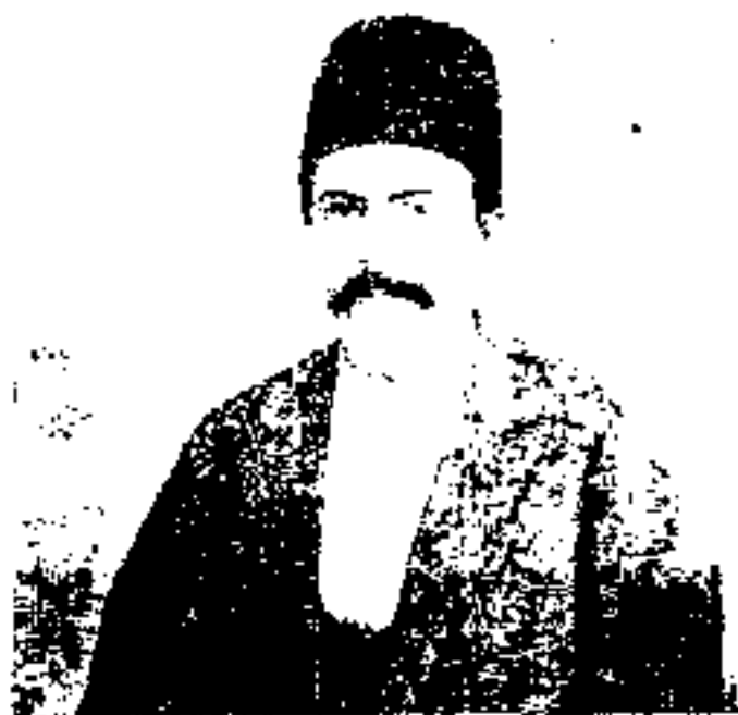
میرزا جهانگیر خان شیرازی مدیر روزنامه صور اسرافیل که در باغ شاه به دستور محمدعلی شاه کشته شد.