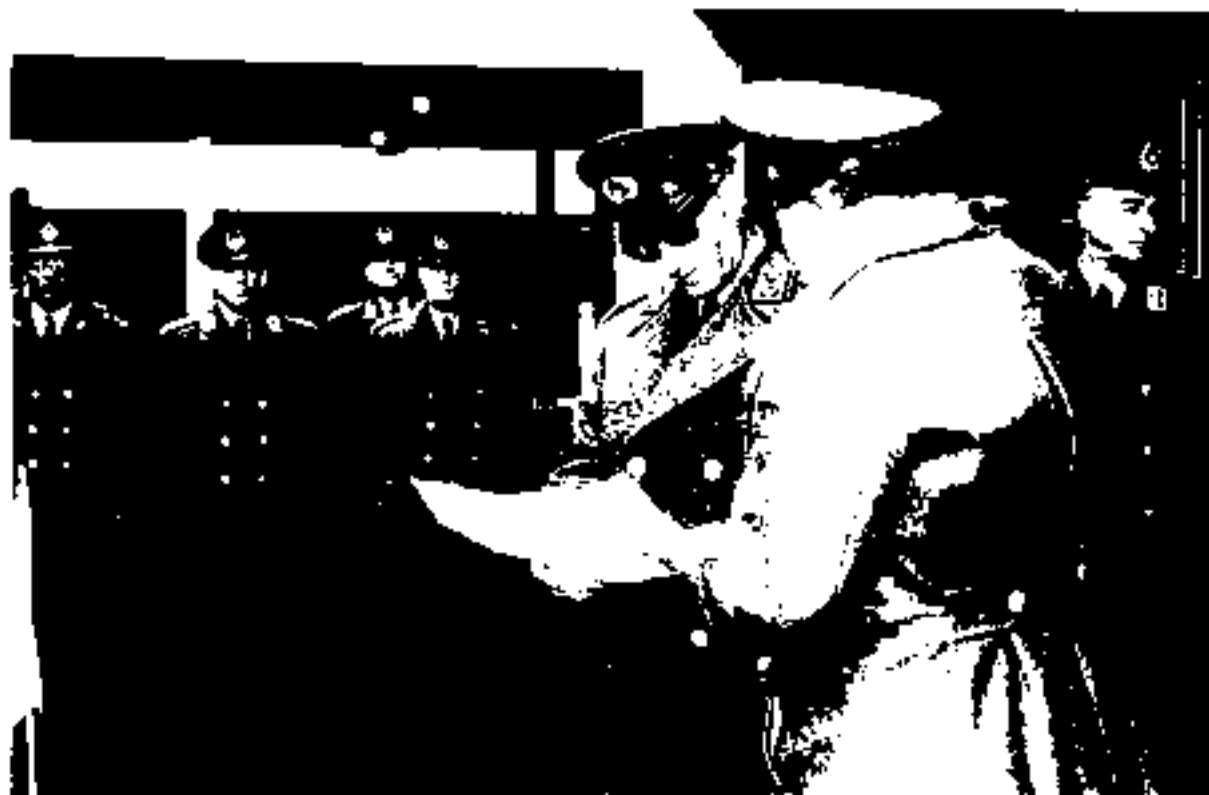
سپید آریانا در حال گزارش عملیات جنوب برای محمدرضا شاه [۱۰۷۷-۴۰]