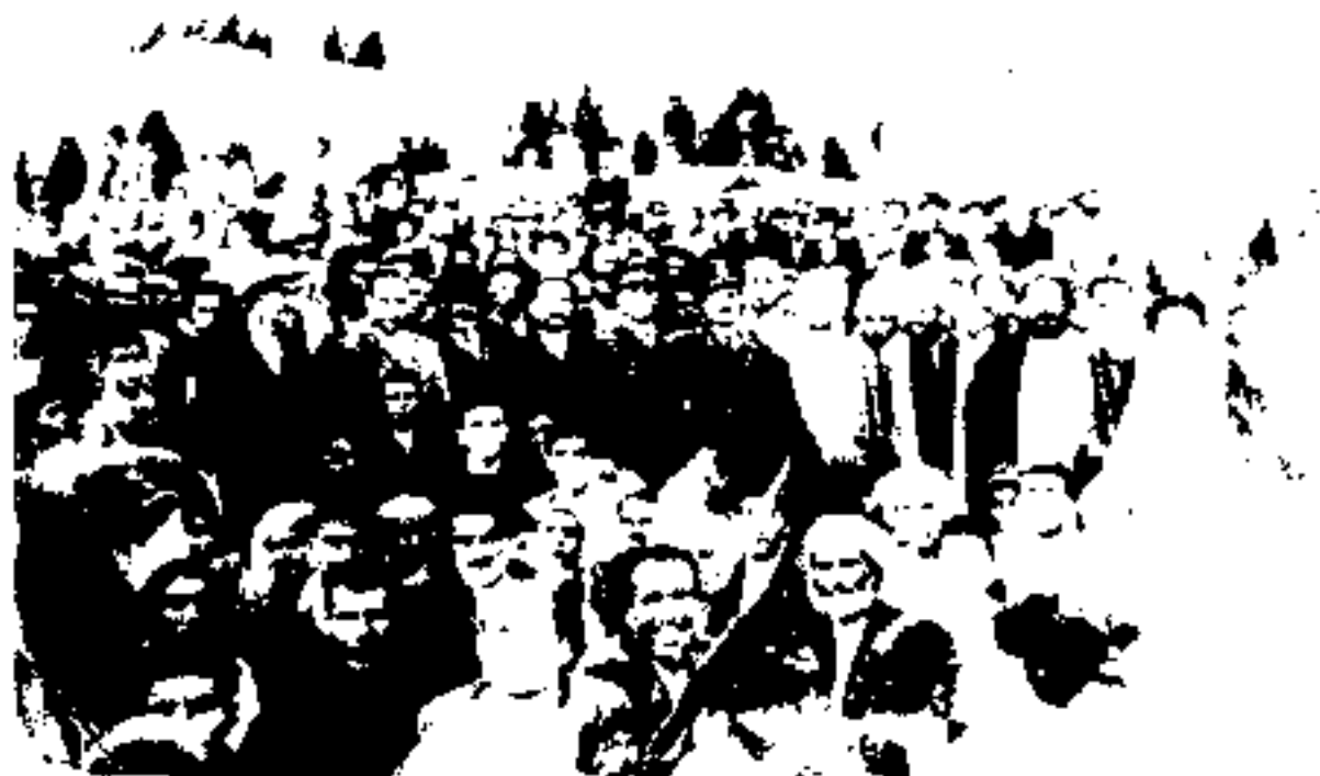
بوئهران: دیدار جمعی از عشایر کهگیلویه و بوئهران با غروی