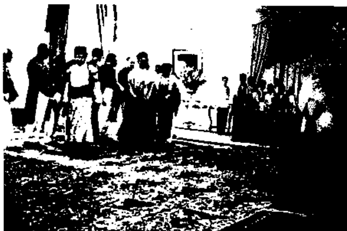
دیدار کدخدایان بویراحمد با محمدرضا شاه