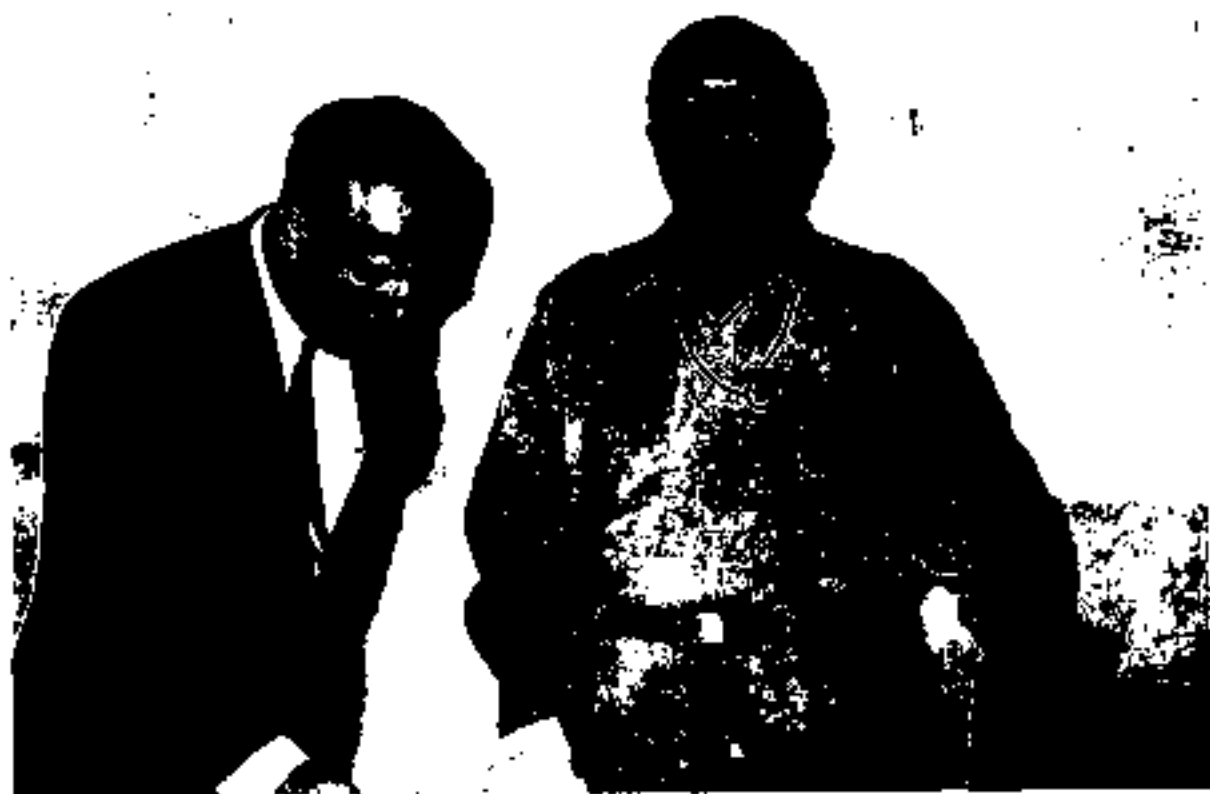
سپهبد بهرام آریانا (فرمانده نیروهای دولتی در سال ۱۳۴۲ ه.ش) [۳۰۵۸-۲]