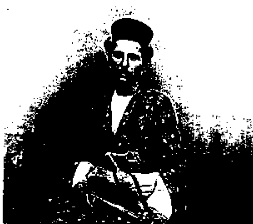
امام قلی خان رستم