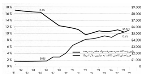
منبع: گزارش جهانی مواد مخدر ۲۰۰۲، ص ۱۷۵

مسلم است که تغییر رفتار انسان ها را نمی توان به علت واحدی نسبت داد. اما در مورد آمریکا مطالعات عمیق نشان داده اند که تلاش های عظیم به عمل آمده در زمینه کاهش تقاضا، نقش مهمی در جلوگیری از سوء مصرف مواد مخدر ایفا نموده است. هزینه های کاهش تقاضا ( به میلیون دلار) و شیوع سالانه سوء مصرف مواد مخدر ( ۱۲ سال و بیشتر) در ایالات متحده آمریکا در شکل زیر آمده است.