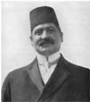
طلعت پاشا، وزیر کشور عثمانی، از طراحان اصلی قتل عام

احزاب و گروه های مختلف ارمنی که از سیاست های خشن و کشتارهای سلطان عبدالحمید به تنگ آمده بودند، به کمک گروه های انقلابی ترک که به ترکان جوان معروف بودند شناختند . ترکان جوان کمیته ای بنام « کمیته اتحاد و ترقی » تشکیل داده بودند و به این ترتیب در برابر سلطان عبدالحمید مبارزه می کردند و سرانجام در سال ۱۹۰۸ با انجام یک کودتا سلطان را به قبول مشروطیت و تشکیل مجلس ملی مجبور کردند و خود راساً زمام امور را در