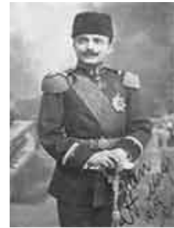
اسمائیل انور پاشا، وزیر جنگ عثمانی، از طراحان اصلی قتل عام

احزاب و گروه های مختلف ارمنی که از سیاست های خشن و کشتارهای سلطان عبدالحمید به تنگ آمده بودند، به کمک گروه های انقلابی ترک که به ترکان جوان معروف بودند شناختند . ترکان جوان کمیته ای بنام « کمیته اتحاد و ترقی » تشکیل داده بودند و به این ترتیب در برابر سلطان عبدالحمید مبارزه می کردند و سرانجام در سال ۱۹۰۸ با انجام یک کودتا سلطان را به قبول مشروطیت و تشکیل مجلس ملی مجبور کردند و خود راساً زمام امور را در