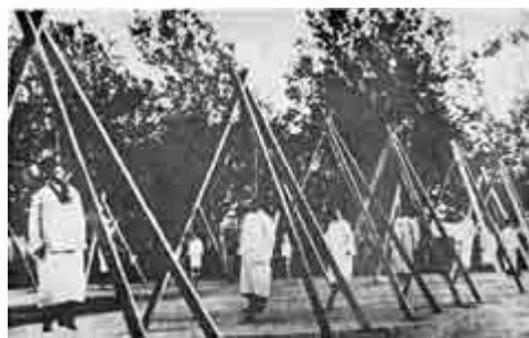
سران حزب داشناک ارمنی که در استامبول بدار آویخته شده اند.

قبل از آغاز جنگ جهانی اول (۱۹۱۴) حدود دو و نیم میلیون نفر ارمنی در قلمرو امپراطوری عثمانی زندگی می کردند ، اما پس از سال ۱۹۲۳ یعنی بعد از قتل عام نهایی ارمنه فقط تعدادی اندک (۵۰،۰۰۰ نفر ) آنهم در شرایطی بسیار اسفناک در قسطنطنیه ، استامبول امروزی ، زندگی می کردند . پس بقیه کجا رفتند ؟