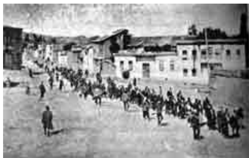
کوچ اجباری ارمنه از موطن اجدادی خود در ارمنستان ترکیه

آنها برای اجرای این سیاست غیر انسانی ، ابتدا مردان بین ۱۵ تا ۵۰ ساله را به بهانه بردن به جبهه های نبرد به ارتش فراخواندند . همچنین دستور صادر شد هر کس که اسلحه دارد باید به ارتش تحویل دهد و هر آنچه که ممکن است در خلال جنگ مورد احتیاج ارتش قرار گیرد نظیر لباس ، قاطر ، غذا و غیره را ضبط خواهد نمود . ولی جالب آنجاست که دولت فقط اموال ارمنه را به نفع ارتش ضبط می نمود . ماموران جمع آوری اموال وقتی به خانه های ارمنی وارد می شدند ، همه چیز را اعم از اینکه مورد احتیاج ارتش باشد یا نباشد ، نظیر لباسهای زنانه ، اشیای زینتی و تزئینی و غیره را جمع کرده و با خود می بردند .