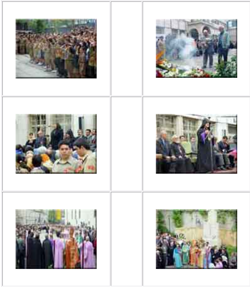
مراسم سالگرد نژادکشی ارامنه در تهران، عصر ۲۳ آوریل ۲۰۰۴