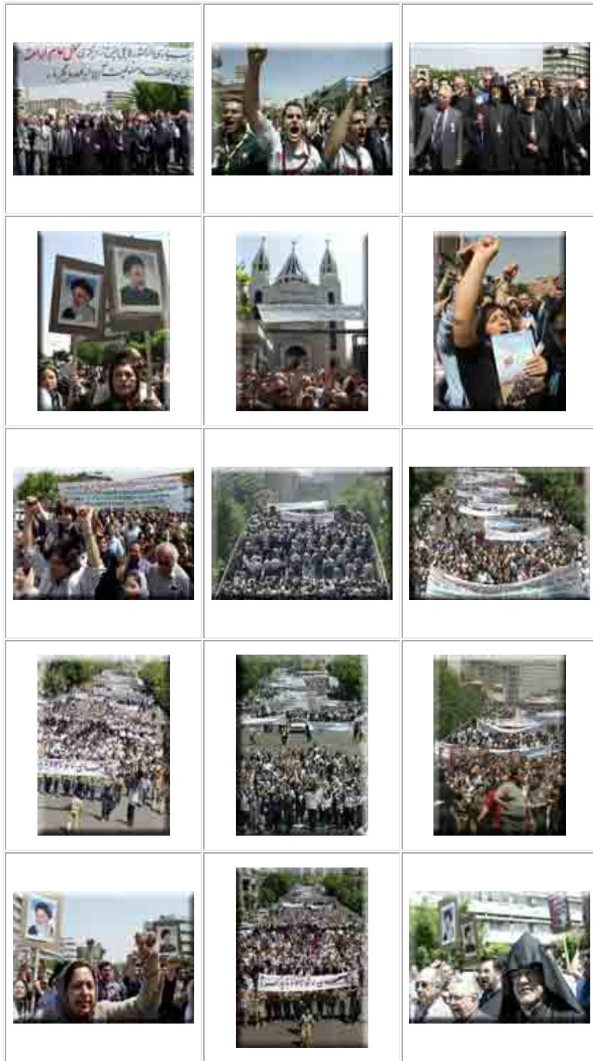
مراسم سالگرد نژادکشی ارامنه در تهران، صبح ۲۴ آوریل ۲۰۰۴